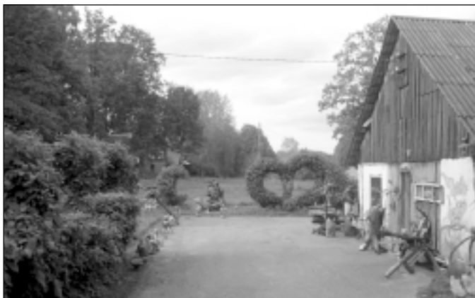
Interesantas figūras un savdabīgus apstādījumus pie vecās pils "Smēdes" izveidojis Gatis Zariņš.