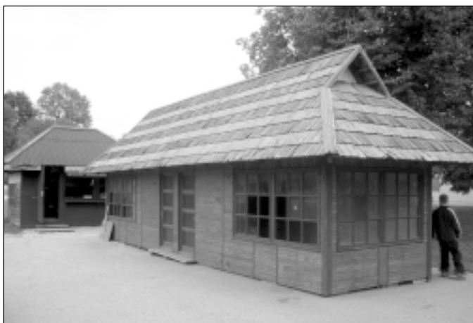
Tirgus nojume, kurā neviens netirgo. Arī apšūtā veidolā tā nav pasargāta no vandālisma.