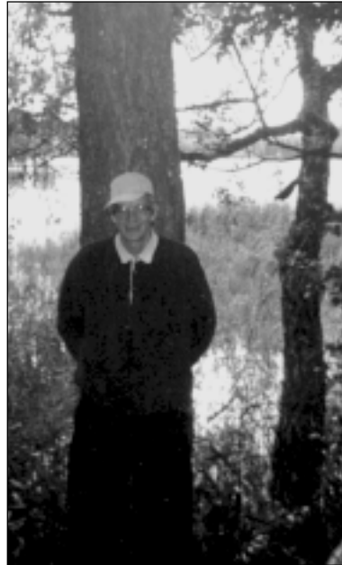
Atpūtas brīdis ekskursijā pie Raiskuma

- Esmu mednieks, bet tāds ļoti dedzīgs nekad neesmu bijis. Pret medībām mana attieksme ir pozitīva. Man nav simpātiska dzīvnieku nogalināšana par katru cenu, nekad arī neesmu dzinies pēc trofejām. Tanī pašā laikā medības ir ļoti jaukas emocijas. Tik tuvu dabai kā mednieks, reti kāds cilvēks pieiet klāt. Medības ir kā līdzeklis, lai šo dabu labāk redzētu, novērotu. Kā tu