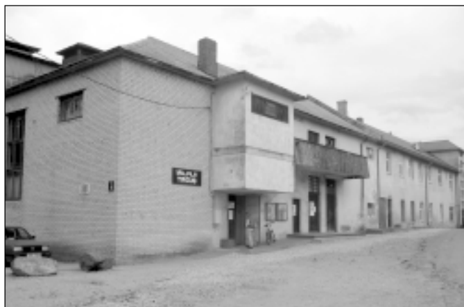
Mālpils centra laukums starp veikaliem un tirgu joprojām bez bruģa un zāliena.