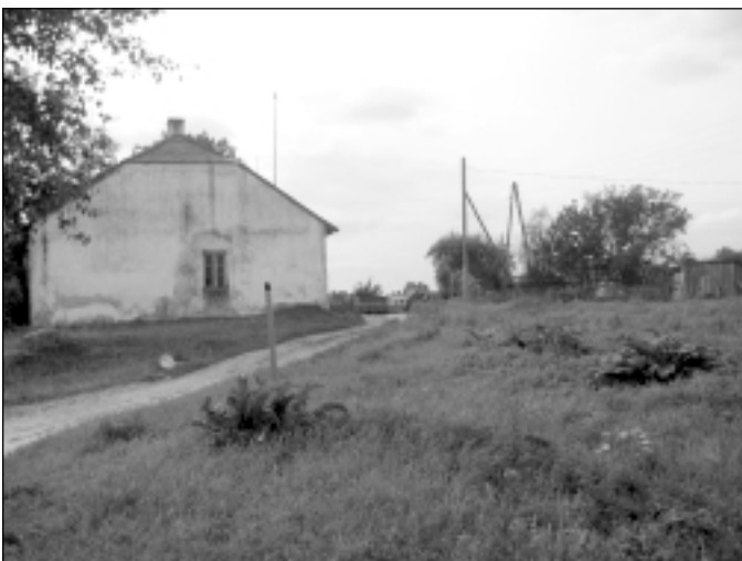
“Šopas” atrodas pašā ceļa malā, tāpēc ikvienam garāmgājējam un braucējam labi redzama ne vien māja, bet arī nesakārtotais iekšpagalms.