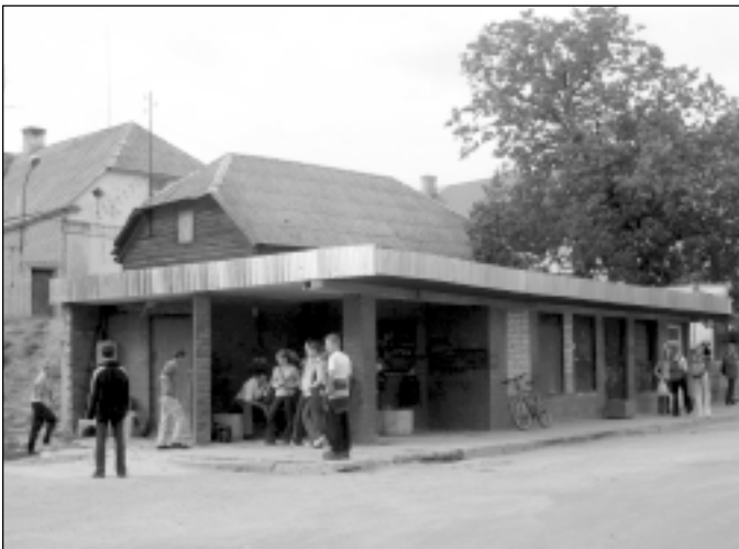
Pagaidām par autoostas rekonstrukciju ārēji liecina vien uz ātru roku pielabotais jumts un apmale.