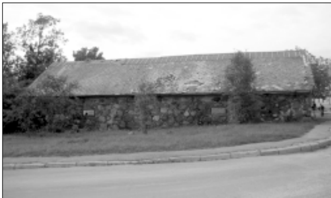
Veco noliktavas ēku pretī autoostai, šķiet īpašnieki atstājuši laika zoba varai.