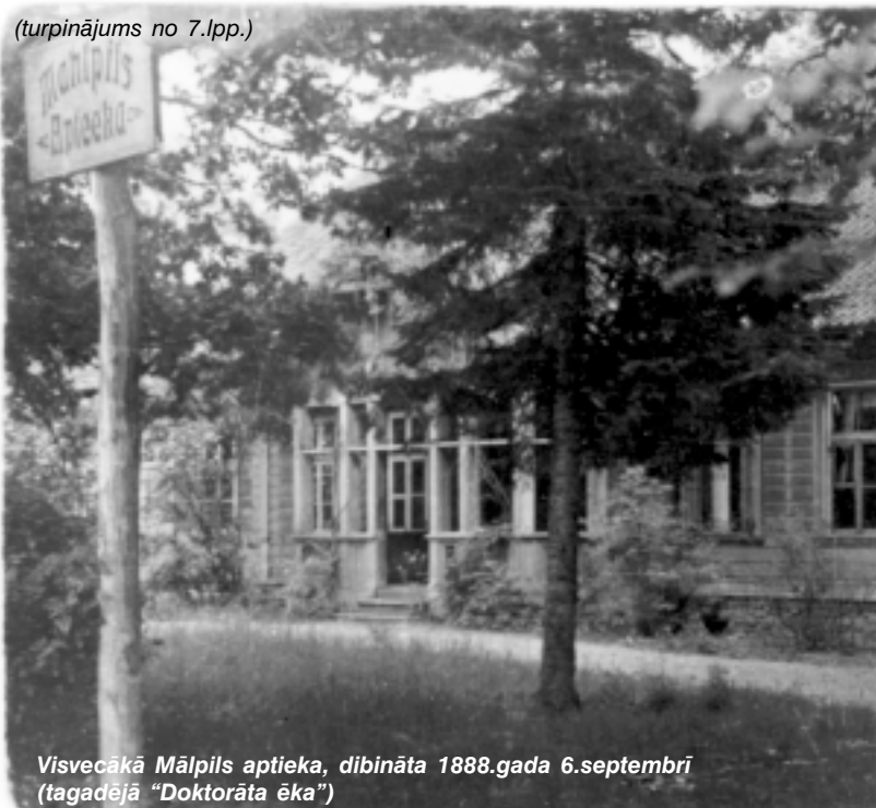
Visvecākā Mālpils aptieka, dibināta 1888.gada 6.septembrī (tagadējā "Doktorāta ēka")