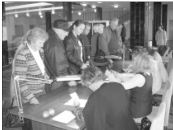
Vēlētāju aktivitāte Mālpilī bija ļoti liela.

pils pagastā par Latvijas dalību Eiropas Savienībā nobalsoja 75, 5 % balsotāji (Sidgundas vēlēšanu iecirknī 79,5 %). Liela daļa pensijas vecuma cilvēku izteicās, ka viņu izvēle balsot "par" ir pamatota ar domu par bērnu un mazbērnu labāku dzīvi nākotnē.