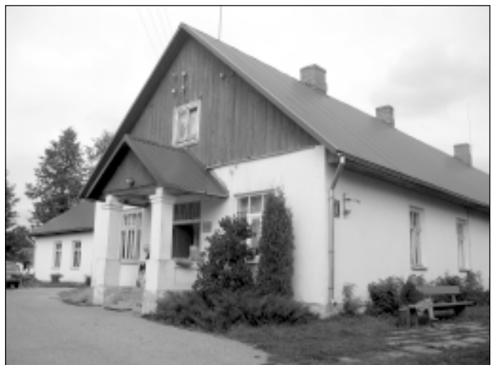
Sociālās aprūpes centra apkārtnē glīti sakopta. Nesen uzcelts arī jauns malkas šķūnis.