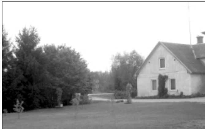
Patikami pārsteidz "Sauleskalna" mājas iedzīvotāju gaumīgi veidotie puķu un krūmu stādījumi, koptais zālājs.