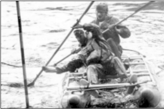
Ūdens tūrisma sacensībās LLA studiju laikā