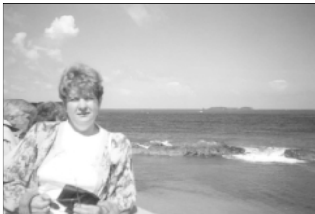
Piepildījies sapnis pabūt pie okeāna. Normandija Francijā

- Tēvs man bija šoferis. Sešpadsmit gadu vecumā viņu paņēma leģionā, apmācīja braukšanā un viņš bija par šoferi vienam vācu feldfēbelim. Laimīgi izgāja cauri vēstures dzirnām. Mama bija finansu inspektore, kaut gan kādreiz ļoti vēlējās studēt bioloģiju un ķīmiju. Man vēl ir māsa, pēc profesijas šuvēja.