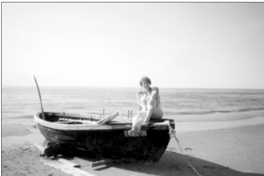
Pie jūras, kur smelties spēkus. Vidzemes jūrmala.

- Tu raksturā laikam esi dzīvīga, aktīva? Kā pārvari negatīvās izjūtas?