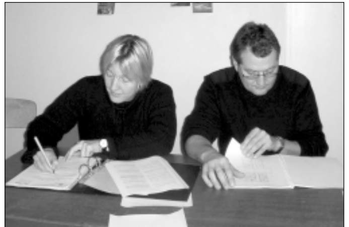
Top jaunais projekts