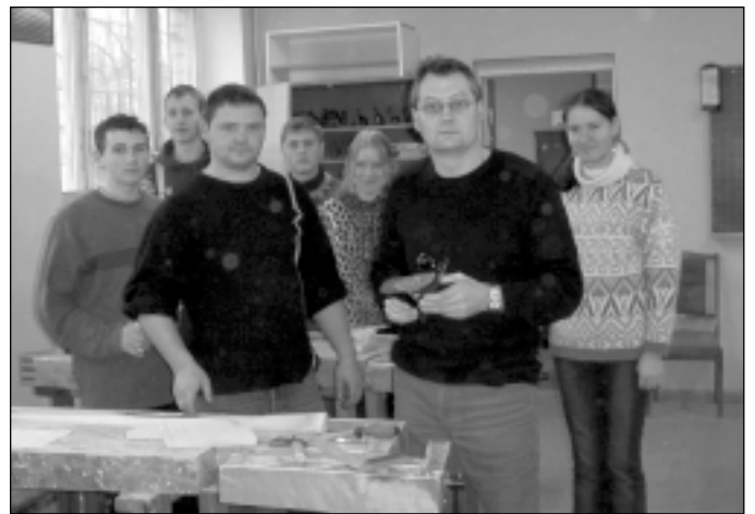
Mālpils profesionālās vidusskolas kokapstrādes darbnīcā