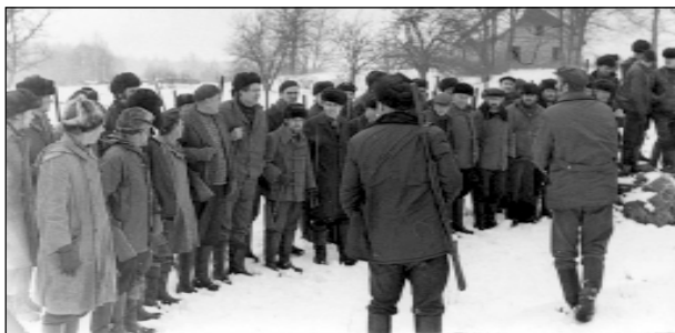
Apvienotie mednieku kolektīvi - More, Zaube, Mālpils, Mergupe pirms medībām. Pie Kalnu-Spaļļiem. 60to gadu beigās

barga, dziļa ziema. Sniegs līdz padusēm. Kā vienmēr, gāju dzīt. Notika mežacūku medības Ūdru iecirknī pie mežsarga Gacka. Medījām „ķēķa mastā”. Mastam apkārt apstājās mednieki, kaut ko nošāva. Bet sniegs bija tik dziļš, ka cūkas nevarēja izdzīt no mastā. Es izšāvu visas patronas, trāpīju tikai diviem sivēniem. Cūku bars joprojām atradās priekšā biezās eglītēs. Eju cūku barā pa kaļ. Cūku māte iet pa priekšu un no mastā neiziet. Nāca tumsa. Tā arī cūku bars palika neizskarts, iznāca pastaiga ar cūku baru bez patronām.