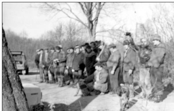
Medību kolektīvs "Sidgunda" 1984.gadā