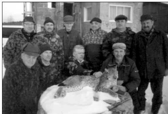
Pēc veiksmīgām lūšu medībām 2000.g ziemā Knieidiņu iecirknī

ir medību sporta kluba „Mergupe” vadītājs un arī ilggadējs mednieks Mālpilī. Viņš pastāsta, ka 50. –to gadu beigās vienā kolektīvā kopā medījuši sidgundieši, mālpilieši, arī allažnieki. Pēc desmit gadiem kolektīvs sadalījās – Mālpilī izveidojās divi kolektīvi, trešais Sidgundā. „Mergupes” priekštecis, „Dinamo” republikāniskās padomes medību sporta kluba Mālpils nodaļa, bijusi Iekšlietu ministrijas pakļautībā.