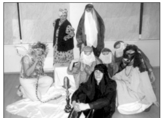
14.februārī Masku ballē kultūras namā