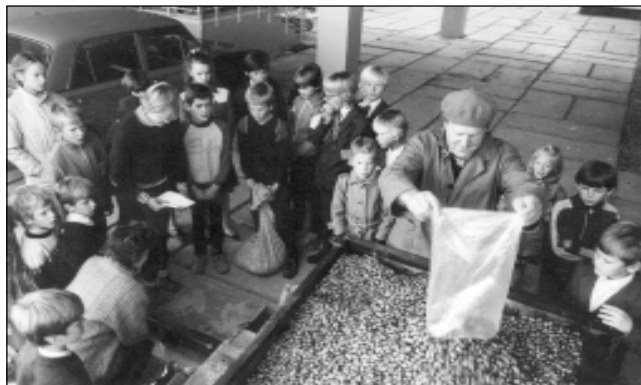
Skolas bērni palīdz meža zvēriem. Ozolziļu vākšana. 80tie gadi