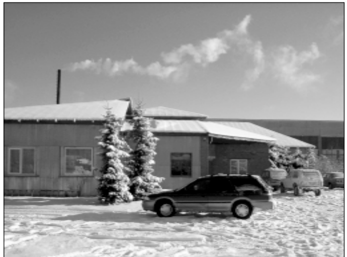
Akciju sabiedrība „Kabatiņas”

Tas ir viļņveida. Ir brīži, kad grūti tikt galā ar darbiem, un ir brīži, kad jādoma, ko darīt. Šis darbs daļēji saistīts ar sezonu. Tomēr galvenais noteicējs pieprasījumam ir cenas. Ja precei cena, tirgū rea-