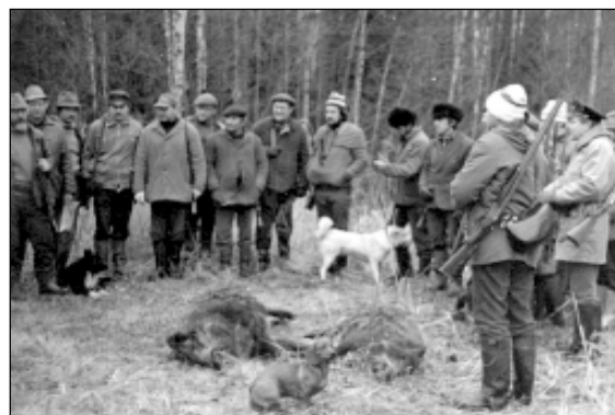
Medību kolektīvs „Sidgunda” mežacūku medībās. 1986.gads