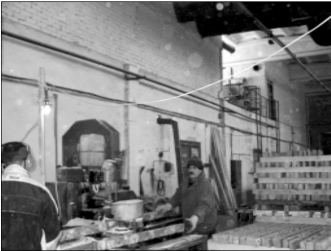
Kokmateriālu pārstrādes cehs