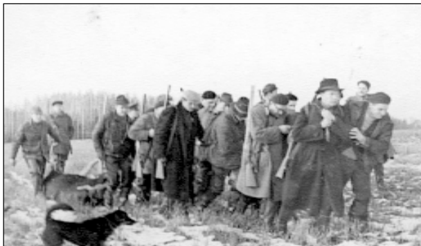
Nomedītais alnis janogādā līdz transportam. 60tie gadi