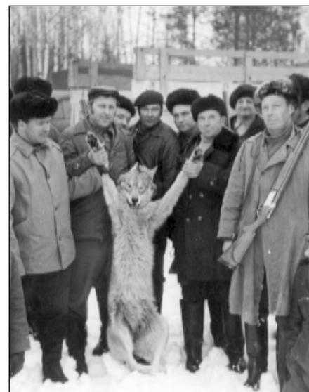
Pirmais Mālpils medību kolektīva nošautais vilks pie „Sniķeru”mājām Mālpilī. 70tie gadi

šaujot. Sidgundā ir atsaucīgi zemnieki, kas par zemu cenu vai pat bez maksas atvēl medniekiem kartupeļus meža