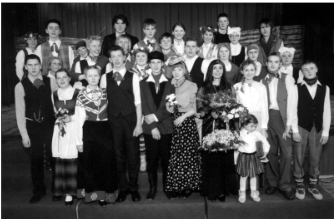
Visi tēlotāji kopā ar audzinātāju pēc izrādes

Prieks par izdevušos darbu izrādes noslēgumā bija visiem. Un vēl, šis iestudējums atgādināja, ka teātra tradīcijas Mālpilī varētu atdzimt, jo turpinātāji ir.