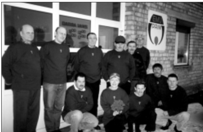
EMU PRIM draudzīgais kolektīvs