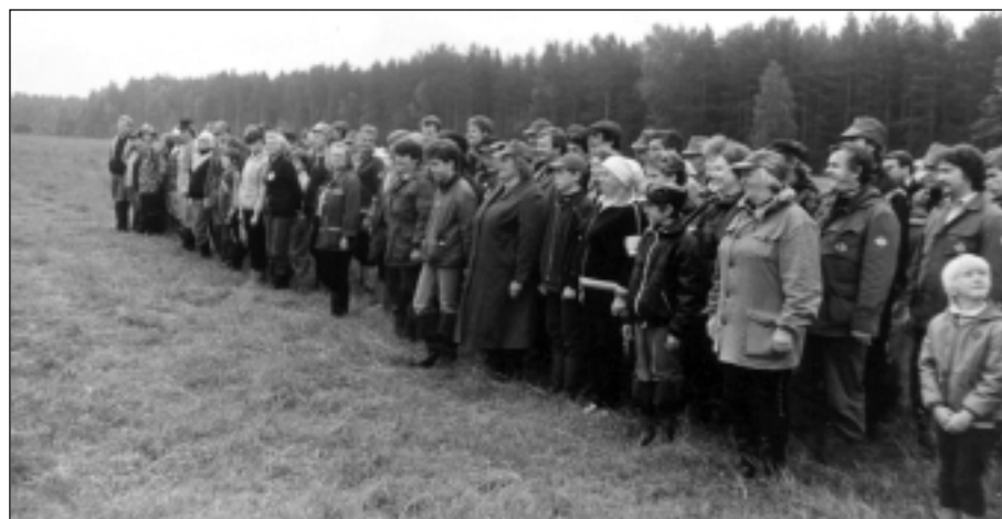
Republikas sacensību dalībnieku kuplais pulks pie Daugavas