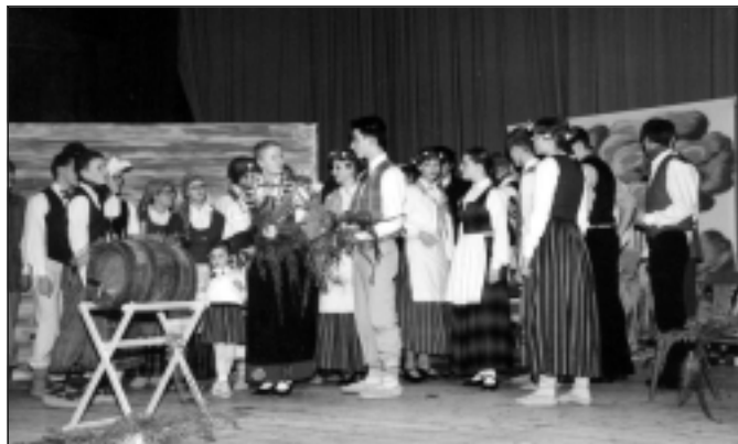
Silmaču saimniece un Alekssis sagaida līgotājus