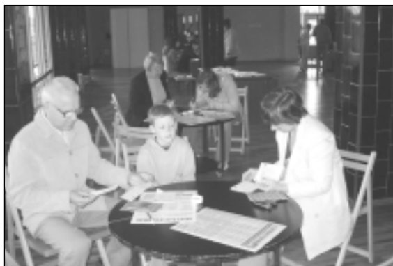
Vēlētāji iepazīstas ar sarakstiem.

No tiem vēlētājiem, kuri ieradās Mālpils un Sidgundas vēlēšanu iecirkņos, sagaidījām sekojošus rezultātus: 1. Latvijas Sociālistiskā partija 20 balsis (Mālpils 19 + 1 Sidgunda), 2. Tautas partija 93 (79 + 14), 3. Konservatīvā partija 19 (18 + 1), 4. Latgales Gaismas 1 (1 + 0), 5. Apvienība "Tēvzemei un brīvībai / LNNK 466 (398 + 68), 6. Politisko organi-