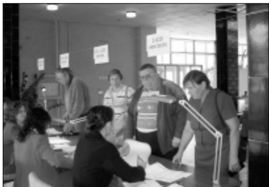
12. jūnijā Mālpils vēlēšanu iecirknī.

Laikā no 09.06.2004. līdz 12.06.2004. Latvijas novados pirmo reizi notika šīs valstu savienības Parlamenta vēlēšanas, kurās tiesības vēlēt bija visu Eiropas Savienības 25 valstu pilsoņiem, tai skaitā Latvijas un arī Mālpils pagastā dzīvojo-