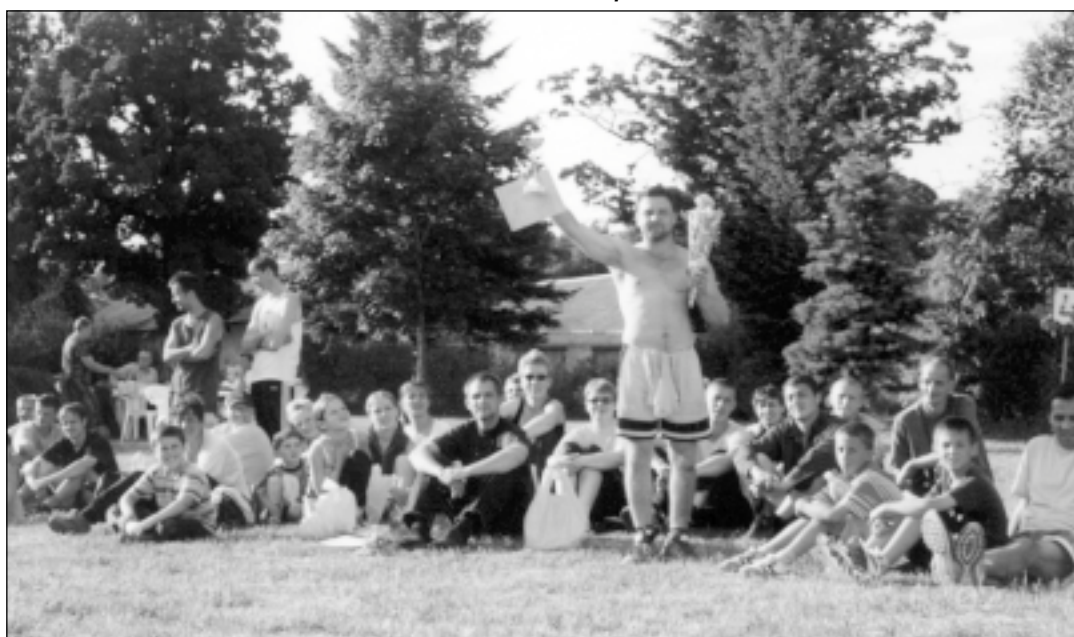
4 ceha kolektīvs priecājas par iegūto pirmo vietu volejbolā.

Esmu priecīga, ka šāds uzņēmums ir, ka varam dot tik daudz darbavietu sava pagasta cilvēkiem un vēl arī kaimiņu pagastiem. Ka materiāli varam atbalstīt sava pagasta iestādes – skolas, bērnudārzu, kultūras namu tur taču dzīvo, mīcās un nodarbojas mūsu bērni.