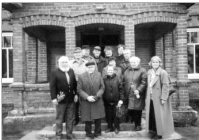
Mālpilī dzīvojošie politiski represētie tikšanās reizē pie Sidgundas pamatskolas.