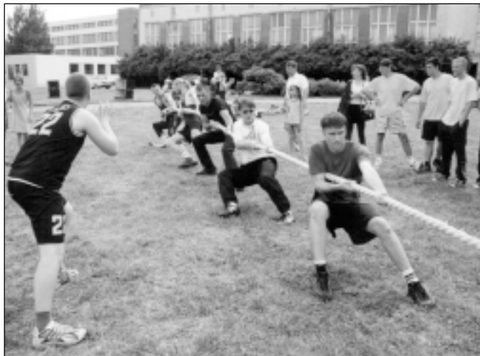
Virves vilcēji spraiģā cīņā.