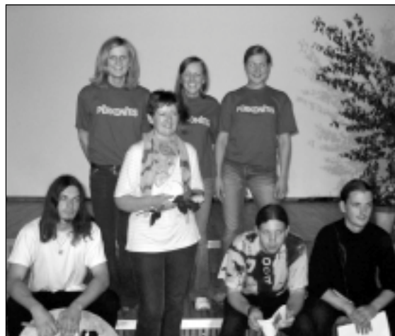
Folkloras kopa "Pērkonitis" no Zaķumuižas mālpilietes apdziedāja Mālpils kultūras namā 8. jūnijā

Maksājieti, maksājieti Mūsu jauku dziedāšanu Jums bij ļabi klausīties, Mums- mēlīte deldējama.