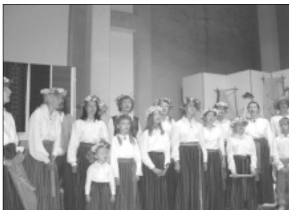
Folkloras kopa "Pērles" no Druvienas.