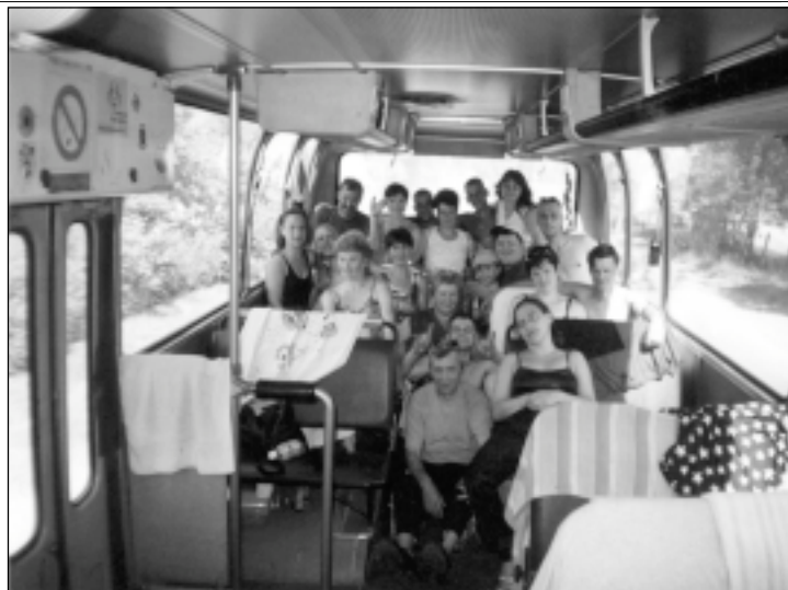
Ceturtdā ceha kolektīvs, kas jau daudzus gadus vasarās kopā apceļo Latviju.

Kad ir vietējās sacensības, tad savstarpēji sacenšas cehi. Lielās sacensības noris starp firmām un katru gadu notiek dažādās vietās, kur ir spēcīgas sporta bāzes. Komandas sacenšas – basketbolā, volejbolā, futbolā, vieglatlētikā, rokasbum-