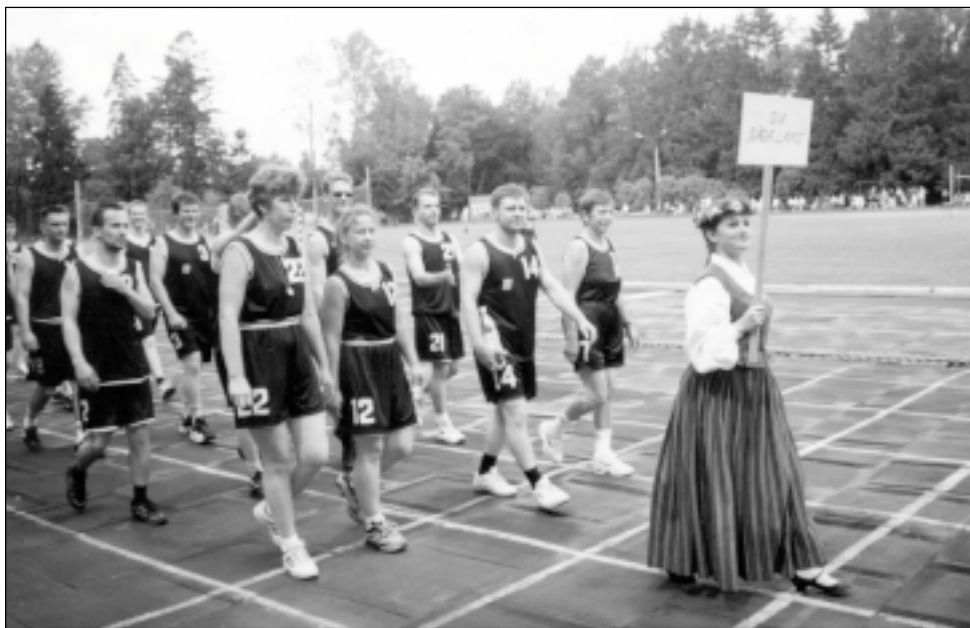
Latvijas kokapstrādes uzņēmumu sporta spēles Murjānos. „Laiko” sportisti parādes gājienā.

Ik gadus mūsu firma ievērojamus līdzekļus atvēl dažādiem ziedojumiem, atbalstām sporta un kultūras pasākumus. Mālpils pagastam katru gadu ziedojam 12-15 tūkstošus latu. Ievērojami līdzekļi šajos gados atvēlēti Mālpils vidusskolas remontam un datoru iegādei, Mālpils bērnudārza remontam un spēlēm, Sidgundas skolas remontam, Mālpils pagasta padomei