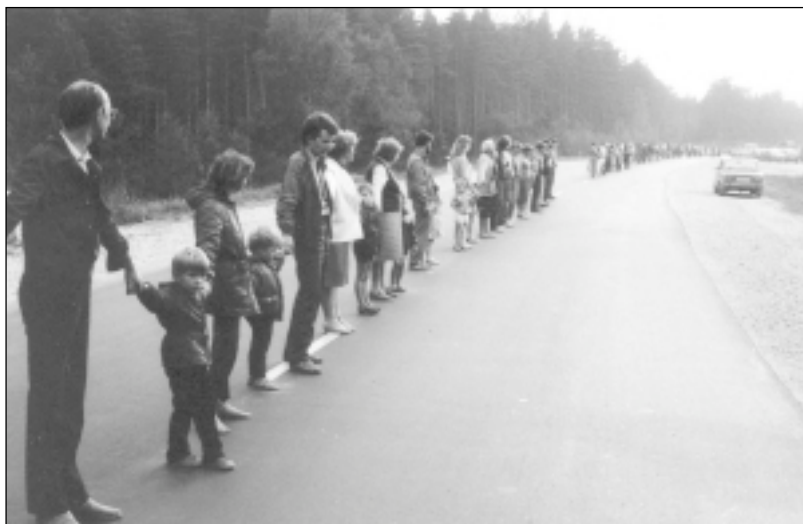
1989.gds 23. augusts. Mālpilieši "Baltijas ceļā" Lorupes gravas apkārtnē.

Pirms 15. gadiem 23.augusta pievakarē no robežas līdz robežai 600 kilometru garumā Igaunijas, Latvijas un Lietuvas iedzīvotāji sadevās rokās, lai aplicinātu visai pasaulei savu vēlēšanos dzīvot brīvā neatkarīgā valstī. Tagad, kad Baltijas ceļa idejas ir piepildījušās, uz laiku pirms piecpadsmit gadiem skatāmies kā uz vēsturi. Vēsturi, ku-