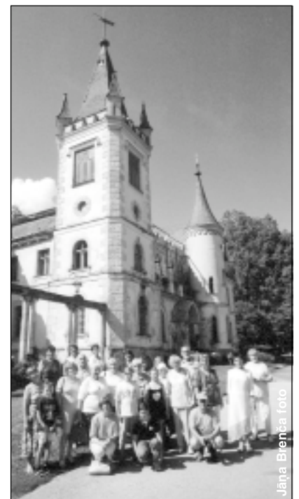
Pie Stāmerienas pils.