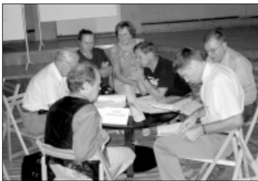
Komisija sarunā ar pagasta nozaru speciālistiem.

Apkopojot rezultātus, Rīgas rajona padomes nozīmēta komisija par uzvarē-