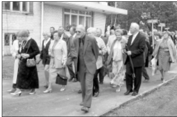
Salidojuma dalībnieki ceļā uz kultūras namu.

ciālajiem darba devējiem, skolotāji kopā ar audzēkņiem analizē izglītības programmu saturu, skolas vadība saskaņo uzņēmēju vajadzības mainīgajā darba tirgū un skolas materiālās bāzes attīstības iespējas audzēkņu apmācībai.