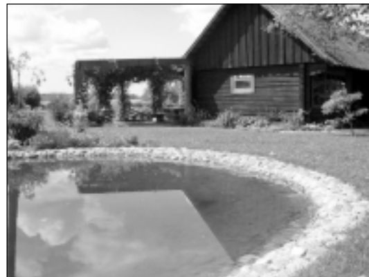
Zemnieku saimniecība "Lazdukalns".

tāju Rīgas rajonā atzina mūsu pagastu un izvirzīja mālpiliešus tālākai izvērtēšanai jau Vidzemes mērogā kopā ar 6 citu rajonu pašvaldībām: Naukšēnu pagastu no Valmieras rajona, Blomes pagastu no Valkas rajona, Trapenes pagastu no Alūksnes rajona, Lejasciema pagastu no Gulbenes rajona, Jaunpiebalgas pagastu no Cēsu rajona, un Lazdonas pagastu no Madonas rajona. Īpaša vērība no Vidzemes zonas vērtēšanas komisijas locekļu puses tika pievērsta pašvaldības teritorijas, uzņēmumu, zemnieku saimniecību, ceļu u.c. objektu stāvokļa vizuālai izvērtēšanai uz vietas. Arī mēs izstrādājām savu maršrutu, kas pēc mūsu domām visobjektīvāk atspoguļotu stāvokli Mālpils pagasta teritorijā, iekļaujot tajā gan mazo, gan lielo uzņēmumu, gan zemnieku saimniecību, gan meža īpašumu, gan netradicionālās lauksaimniecības saimniecību pārstāvjus.