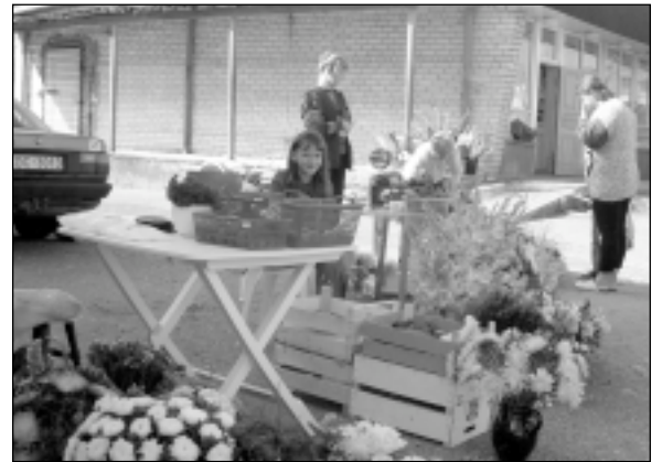
Sestdien, 21. augustā tirgū piedāvāto preču klāsts bija visai plašs – puķes, tomāti, gurķi, kartupeļi, kabači, zaļumi, kazenes un avenas.

Ir patikami, ka Mālpils pagasta pats centrs tiek labiekārtots. Paliek cerība, ka tiks padomāts arī par dārzeņu un puķu tir-