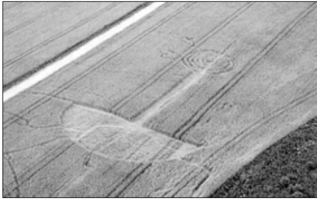
Piktogramma sastāv no trīs daļām – pusapļa, taisnas joslas un sešiem koncentriskiem pusapļiem. Visi zīmes elementi ir savstarpēji savienoti. Piktogrammu veido 20 līdz 30 centimetrus no zemes aplauzi labības stiebrī, kas virzīti pretēji pulksteņa rādītāja virzienam.

Ja raugāties pagātnē, šādas piktogrammas tika sauktas par raganu apļiem. Tagadējā Latvijas teritorijā tās ir minētas