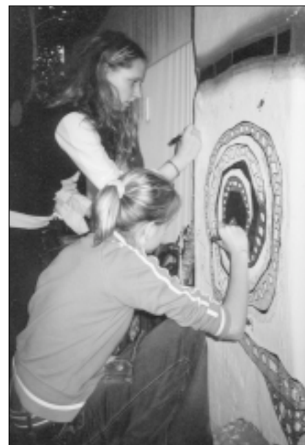
Top sienas fragments Hundertwasserhausā Vinē.