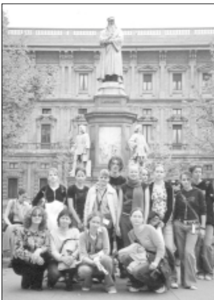
Milānā pie Leonardo da Vinči

un mākslas skolu, Siguldas mākslas skolu, Krimuldas mūzikas un mākslas skolu un Salaspils mūzikas un mākslas skolu.