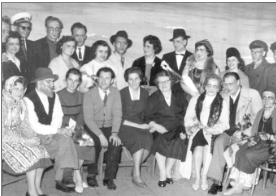
Režisore (1 rindā vidū) kopā ar aktieriem pēc „Zītaru dzimtas” pirmizrādes 1964. gada 18. aprīlī.