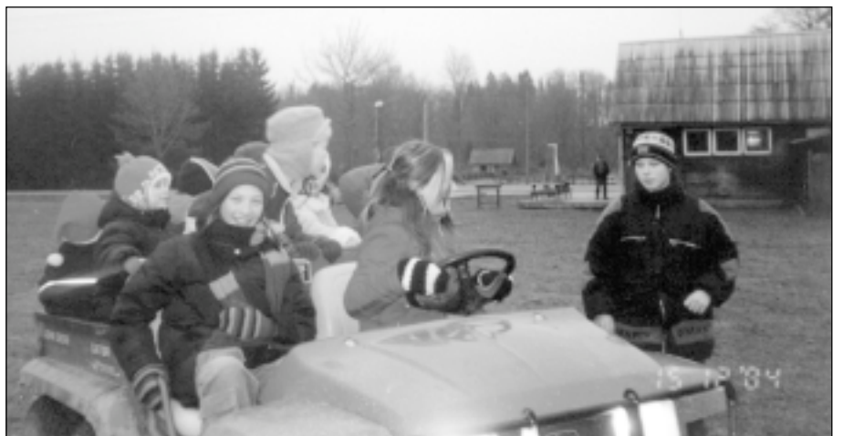
Ceļā uz Rūķu ciemu.

Arī mūsu mājīnieki tika iepriecināti ar ciemakukuli - izgreznotām piparkūkām.