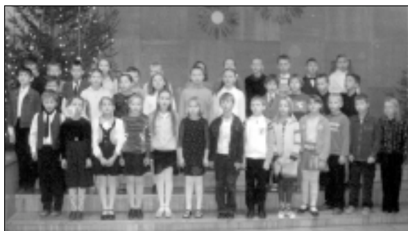
3.a klases skolēni Ziemassvētku priekšnesumā

17.decembrī skolēni pa klašu grupām pulcējās skolas zālē uz "Baltajām stundām", kurās runātāji runāja, dziedātāji dziedāja, bet direktore čaklākos apbalvoja ar Atzinības rakstiem.