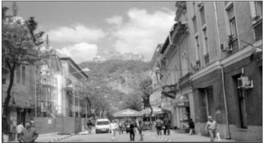
Devas centrālā iela.

Tikšanās notika Rumānijas vienā no lielākajiem apgabaliem Hunedoarā, pilsētā Devā, netālu no Ungārijas robežas (no 17. līdz 24. oktobrim). Tur mēs izstrādājām konkrētu projekta tēmu "Eiropas plāva", vadoties no kopējās tēmas