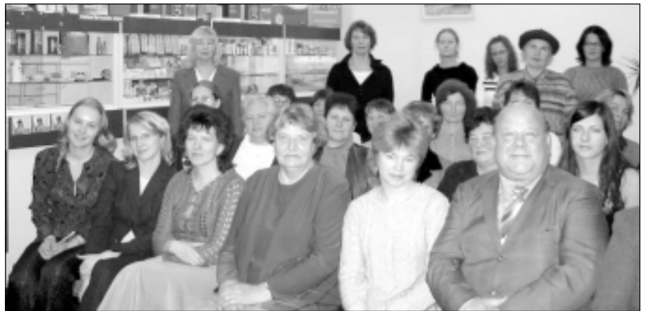
„Veselības skoliņas” dalībnieki un pārējie sarikojuma viesi.

ka stingri reglamentēta, kā arī pārbaudīta. Ja atrada kādas zāles, kas neatbilst prasībām, šīs zāles savāca un izlēja Daugavā. Aptiekāri pazīstami kā zinātniski izglītoti cilvēki, kas veica pētījumus un ga-