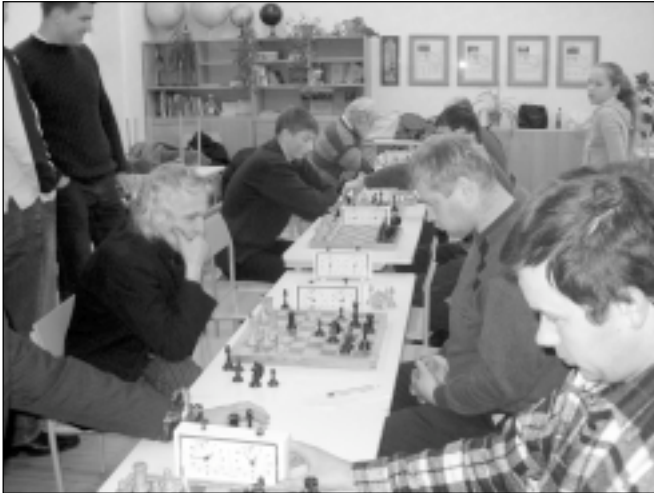
5. decembrī Mālpil vidusskolas telpās notika Mālpils šaha čempionāts.