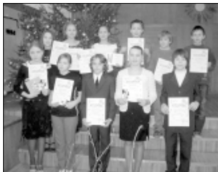
Atzinības rakstus saņēma 151 skolēns. Attēlā: par atzinības rakstiem priecājas 5.b klase