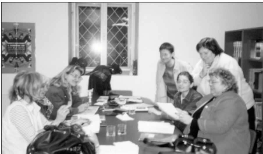
Projekta izstrāde kopa ar kolēģēm no Vācijas, Rumānijas, Polijas.

Rumānija ir ļoti nabadzīga valsts, bet cilvēki tur ir draudzīgi un viesmīlīgi. Mēs pirmo reizi izjutām kā ir būt ārzemniekiem, kurus tik ļoti uzmana un aprūpē. Projekta dalībniekiem tika organizētas tikšanās un