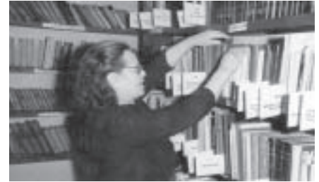
Darbā bibliotēkā. 60.-tie gadi.

kollektora aiznest uz autobusu, bet Mālpilī pie autobusa atkal citi ar ragaviņām sagaidīja.