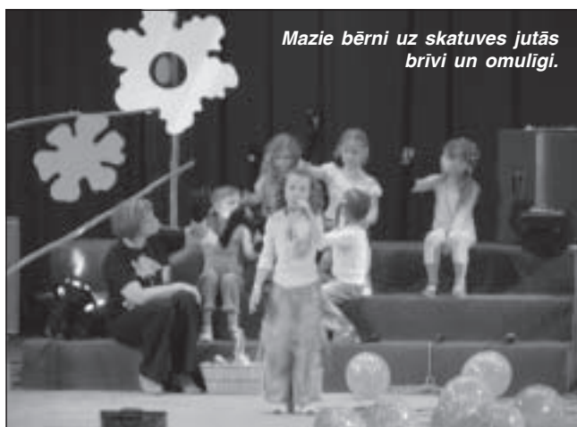
Mazie bērni uz skatuves jutās brīvi un omulīgi.