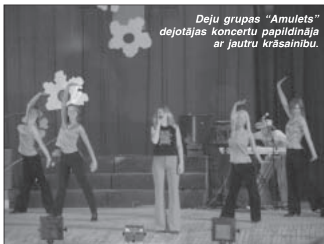
Deju grupas "Amulets" dejojotājas koncertu papildināja ar jautru krāsainību.