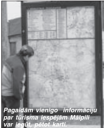
Pagaidām vienīgo informāciju par tūrisma iespējām Mālpilī var iegūt, pētot karti.