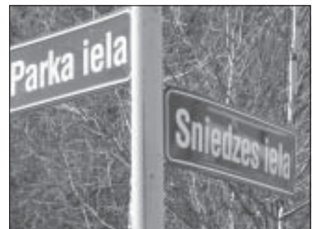
Ari šo abu ielu labiekārtošana ir iekļauta ielu rekonstrukcijas projektā.

Visi rekonstrukcijas darbi pašlaik ir sīkiu stadijā un ir jāturpina projekta izstrāde.