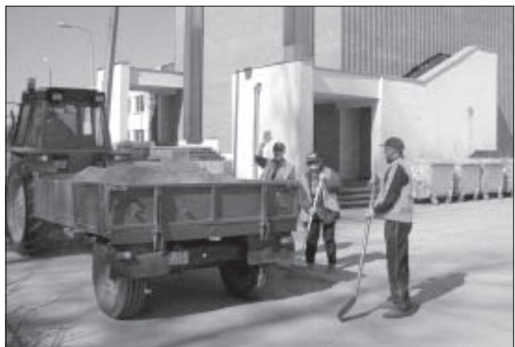
Pagasta ceļu dienesta darbinieki veic ielu attīrīšanu no smiltīm.

Tā laikā visi Mālpils iedzīvotāji aicināti sakopt savas mājas apkārtni un ciemata teritoriju. Ir notikusi pagasta iestāžu vadītāju sanāksme, sadalītas sakopjamās teritorijas. Mālpils vidusskola, kurai jāsakopj skolas apkārtni, celiņa malas parkā un 12. klasei Lielā Tēvijas kara karavīru kapī, šo darbu jau ir uzsākusi, bet citas iestādes izies talkās sev vēlamā laikā. Pagasta padomes darbinieki tāpat kā citus gadus strādās pie sociālās aprūpes centra apkārtnes un arī pie kultūrvēsturisko kapavietu sakopšanas Mālpils kapos. Mālpils mūzikas un mākslas skola palīdzēs sakārtot baznīcas apkārtni, Sidgundas pamatskola, pirmsskolas izglītības iestāde, veiks savas teritorijas sakopšanu, kultūras nams – estrādes apkārtnes satīrīšanu. Bezdarbnieki jau ir veikuši valsts ceļu malu tīrīšanas darbus un turpina strādāt uz pagasta ceļiem. Lai nodrošinātu uzkopšanas darbus savāko atkritumu aizvešanu ir izvietoti papildus lieli konteineri uz Strēlnieku ielas, Parka ielas, Baznīcas kalnā. Konteineri tiks apmainīti pēc nepieciešamības, bet pēc 10. maija lielgabarīta atkritumiem konteineri būs Mālpils centrā divi, Upmalās, Sidgundā, tehnikumā pa vienam. Šajos konteineros iedzīvotāji