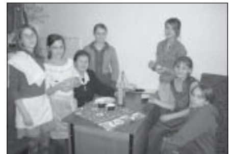
Novadpētnieku jaunākā grupa darbojas pozīcija par skolām un skolotājiem.

Vasarā taps jauna muzeja telpa, kuru skola jau izremontējusi, un tajā būs eks-