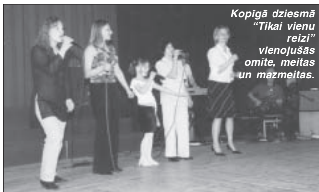
Kopīgā dziesmā "Tikai vienu reizi" vienojušās omīte, meitas un mazmeitas.