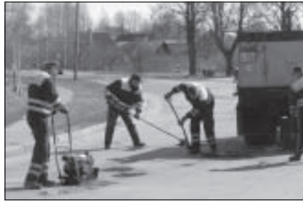
Asfalta bedrīšu nolīdzināšana uz valsts nozīmes ceļiem notika 19. aprīlī.