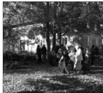
Pie Druvienas vecās skolas.

un grūbām, vakara saules atspīdums Druvienas diķi, un visam pāri druvēniešu laipnā sirsniņa.