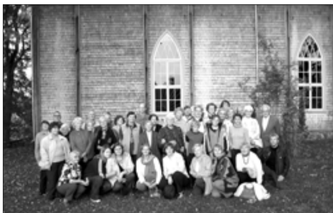
Ekskursanti pie Vijciema baznīcas.

Sirsniņa pateicība visiem, kuri piedalījās šajā jaukajā braucienā par izturību un labo saskaņu visas dienas garumā, kas vēlreiz apliecina – mūs visus vieno un svētī viens Dievs!