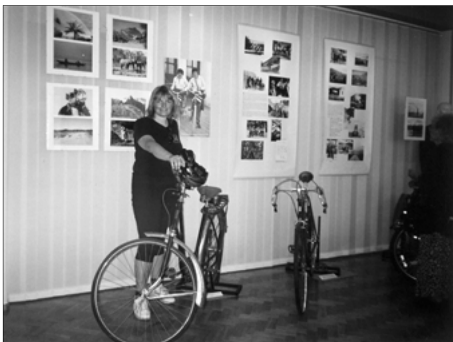
Autore sporta muzejā Tartu, Igaunijā.

Tā "Pēdas" sev atbilstošā veidā nolēma sagaidīt Krišjāņa Barona 170. dzimšanas dienu, kas tiks atzīmēta 31. oktobrī. Tālajā 1858. gadā Tērbatas universitātes astronomijas un matemātikas students Kr. Barons ceļu no Tērbatas līdz Dundagai gāja ar kājām. Visu ceļā piedzīvoto un redzēto atzīmēja kartē un aprakstīja pirmajā ģeogrāfijas grāmatā - Mūsu tēvzemes apraksts. Balstoties uz seno karti, velomaratona maršrutu izstrādāja "Pēdas" darba grupa. Tolaik kad Kr. Barons šo ceļu mēroja kājām, viņam tas prasīja nepilnas piecas nedēļas. Šajās nedēļās viņš nogāja 500 km, savukārt mēs braucām divas nedēļas un pieveicām ap 900 kilometru. Mēs tā pat kā Kr. Barons brauciena laikā iepazīnām Latviju un Igauniju, satikāmies ar daudziem interesantiem cilvēkiem un apskatījām skaistas vietas. Ceļojot vairākās vietās stādījām kociņus, rīkojām sakopšanas talkas kopā ar vietējiem ļaudīm. Braucām lielākoties pa zemes ceļiem, jāatzīst, kad ceļi ir tādi kādi ir un tas nebija viegli. Nonākot kārtējā pieturas vietā, kur varēja sajūst siltu uzņemšanu un īpašu gaidīšanas prieku, smēlāmies spēkus. Gan Latvieši, gan Igaunji ļoti viesmīlīgi mūs sagaidīja visur kur ciemojāmies un atbalsēja mūsu brauciena un darbošanās mērķi. "Pēdas" - jau nav tikai atkritumu vācēji. Tiek