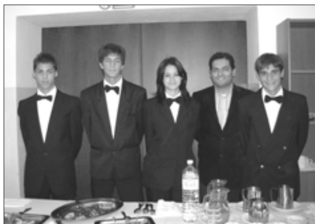
Itāļu audzēkņi darba tēpos.