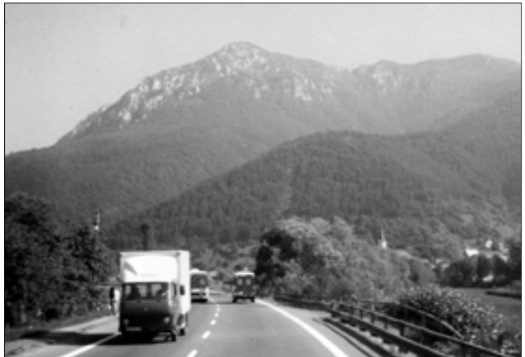
Ceļš un kalni aiz Madrides.

Ir dažādi cilvēki. Daudziem patīk strādāt un dzīvot Īrijā, Anglijā, Vācijā. Man tas neder. Domāju, ka es pat