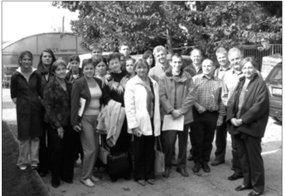
Projekta dalībnieki pie Mortāras profesionālās skolas.

Ļoti interesants bija vācu kolēģu projekts par skolotāju saskarsmes kultūru kolektīvā, skolotāju ētiku, tās izpēti savā skolā un ieteikumiem skolotāju ētikas, savstarpējo attiecību uzlabošanā. (sk. D.Melcere)