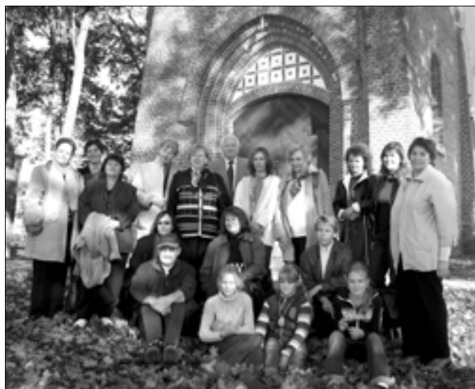
Skolotāji pie Krimuldas baznīcas.

7.oktobrī mūsu skolotāju ekskursija uz Siguldu. It kā tepat blakus, bet tomēr tik daudz nezināma!