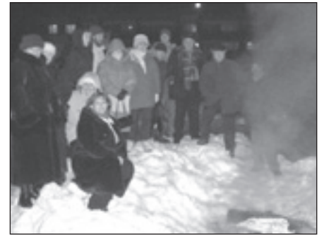
2006. gada 20. janvārī Mālpilī

Es toreiz nebiju Tautas frontes dalībnieks, bet vienkārši brīvprātīgais. Barikādēs piedalījās iekšējās pārliecības dēļ, ka tiksīm vaļā no tiem, kuri pār mums valda un būs brīva Latvija. Bīstamākā bija 20.janvāra nakts, kad Rīgas centrā notika apšaušana pie Iekšlietu ministrijas un Bastejkalna. Gatavojāmies uzbrukuma