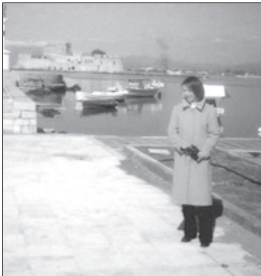
Nafplionas laivu piestātne - pilsētnieku un tūristu iemīļota pastaigu vieta. Tālāk Burdzi, cietoksnis jūrā, vēlāk izmantots kā cietums, tad 50.tajos gados luksus viesnīca Eiropas aristokrātijai.

arī labs – sauss, silts klimats un jauki cilvēki.