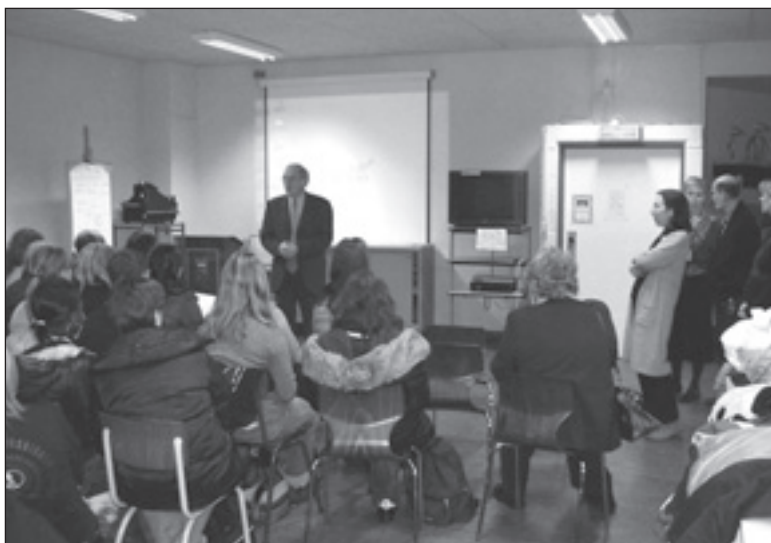
Projekta apspriede. Runā skolas direktors.

pilsētu – Ljēžas profesionālie grafiti mākslinieki mūs iepazīstināja ar interesantākajiem grafiti gleznojumiem pilsētā, pastāstīja par to tapšanas veidiem un paņēmieniem. Pēcpusdienā skolotājiem un skolēniem bija atšķirīgas nodarbošanās. Skolēni veidoja grafiti sienas gleznojumu bērnu dārza pagalmiņā abu mākslinieku vadībā. Savukārt, mēs skolotāji, devāmies uz Ljēžas Mākslas muzeju, kur apskatījām tēlotājmākslas ekspozīciju