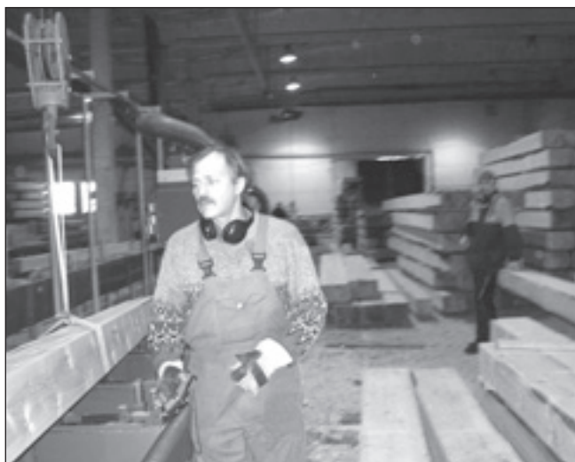
Lielākā daļa darbu notiek automatizēti un ar datoru palīdzību.