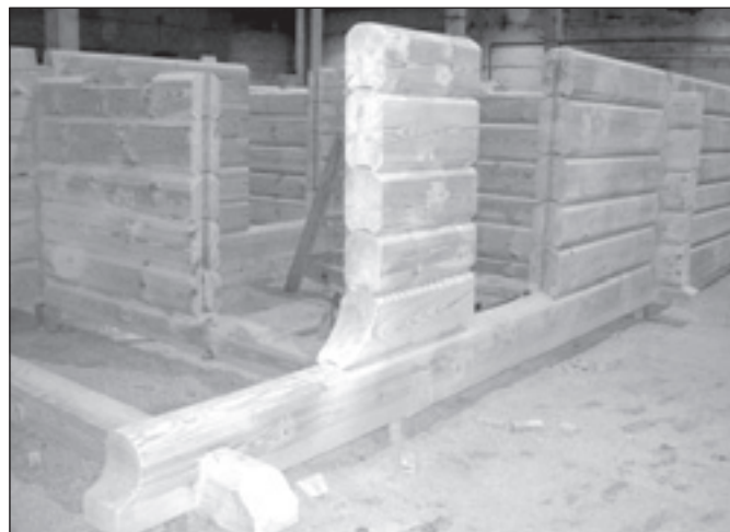
Pirms nosūtīšanas uz Norvēģiju katrai guļbūvei veic kontrolmонтаžu – liek kopā, numurē detaļas.

Mālpilī drīz būs piepildītas telpas, tāpēc veidosim jaunu ražotni Līvānos. Jau ir nopirkta ēka 28 000 kvadrātmetru platībā. Tur jāsakārto un jāattīsta ražošana. Mālpilī sakopsim teritoriju, noasfaltēsim, uzsāksim darbu ar pastarpinātiem materiāliem – grīdas dēļu, spāru apstrādi, iespējams, iegādāsimies vēl jaunu kokmateriālu kalti. Ražošana iet plašumā un cerams, ka pieprasījums būs.