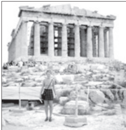
Atēnu Akropoles Parthenona templis, viens no septiņiem antīkās pasaules brīnumiem.

Pirms desmit gadiem mālpiliete Ilze Kaukule , būdama Tūrisma augstskolas studente, no daudzajiem vasaras prakses piedāvājumiem ārvalstīs izvēlējās Grieķiju. Pēc tam kopā ar septiņiem kursa biedriem devās uz Krētu.