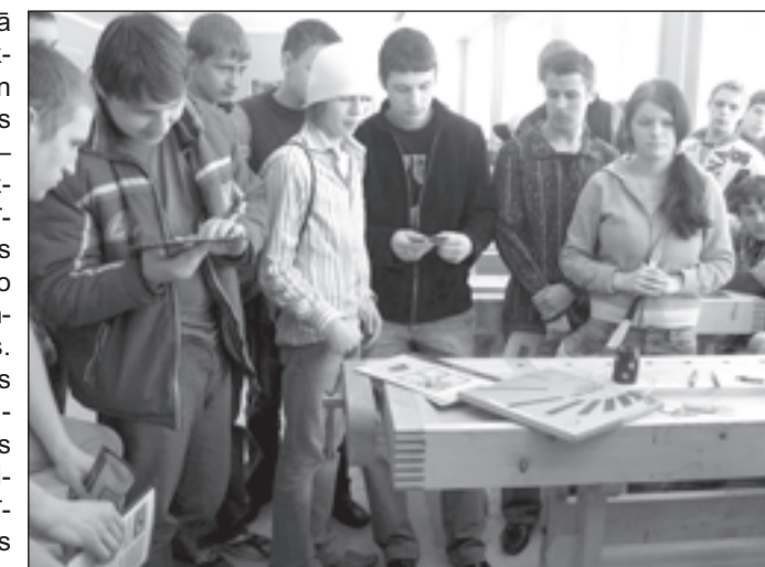
Audzēkņi aplūko jaunākos kokapstrādes instrumentus.