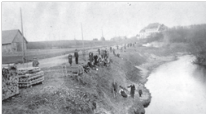
Meža dienas Mālpilī 1934. gada maijā

Valsts Meža dienesta rīkotajās Meža dienās iesaistās valsts un pašvaldības institūcijas, sabiedriskās organizācijas un kokapstrādes uzņēmumi. Kopumā paredzēti vairāk nekā 400 pasākumi – meža stādīšana, sakopšanas talkas, semināri un konkursi. Meža dienu, kuras šogad norisināsies jau 78. reizi, devīze ir "Mēs mīlam mežu" un tajās īpaša vērība tiks veltīta skolēnu informēšanai un izglītošanai.