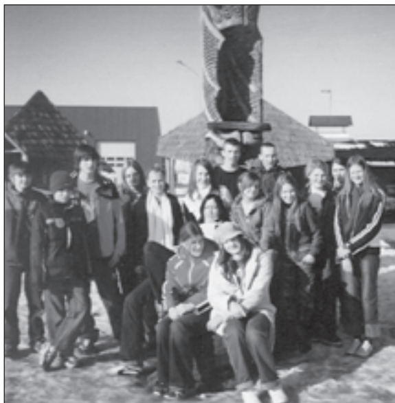
Mēs ceļojuma laikā