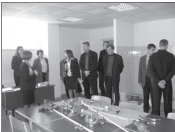
Uzņēmēji iepazīstas ar skolas materiālo bāzi.

Mālpils profesionālajā vidusskolā īsteno ar Rīgas reģiona attīstības stratēģiju saistītas izglītības programmas: "Ēdināšanas serviss", "Kokizstrādājumu izgatavošana" un vienīgie Latvijā – "Siltuma, gāzes un ūdens tehnoloģija". Lai paaugstinātu audzēkņu, bet pēc skolas beigšanas ēdināšanas servisa speciālistu, ēku inženiertīklu tehniķu, mēbeļu galdnieku konkurētspēju darba tirgū Mālpils profesionālā vidusskola tradicionāli marta beigās organizē Uzņēmēju dienas. Šogad Uzņēmēju dienās laikā no 20.marta līdz 24.martam audzēkņi, viņu vecāki, skolotāji, uzņēmēji, Rīgas rajona padomes un Mālpils pagasta pašvaldības pārstāvji: 1) analizēja izglītības programmas un materiāli tehniskās bāzes nodrošinājumu, 2) paredzēja kvalitatīvi uzlabot uzņēmumos organizētās mācību prakses, 3) analizēja darba tirgus pieprasījumu pēc kvalificēta darba spēka un nākotnes tendences, 4) paredzēja pilnveidot sadar-