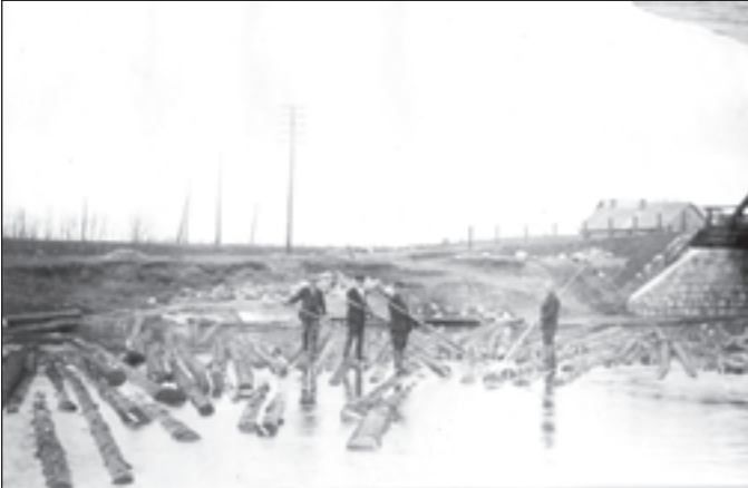
Koku pludināšana pa Mergupi pie "Tiltņiekem" 1930. gadā.