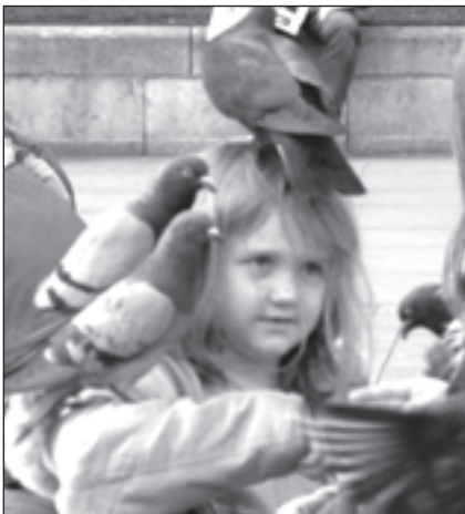
Arī Londonas Trafelgera laukumā izlikti brīdinoši uzraksti – nebarot putnus. Taču bērnu prieks par draudzīgajiem baložiem ir stiprāks.

Putnu gripa ir akūta, ļoti lipīga putnu infekcijas slimība, kas rada bojājumus dažādās orgānu sistēmās. Ar putnu gripu slimo vistas, tītari, pīles, paipalas, pāvi, fazāni un strausi, retāk citas putnu sugas. Slimībai izšķir divas formas – zemi patogēna putnu gripa (ZPPG), kas norit ar vispārīgām saslimšanas pazīmēm, kuras ne vienmēr liecina par saslimšanu ar putnu gripu un augsti patogēna putnu gripa (APPG), kas putnu audzētājiem rada milzīgus zaudējumus, kas saistīti ar putnu likvidēšanu slimības apkarošanas ietvaros. Vīrusu izplatītāji ir savvaļas putni, sevišķi ūdensputni, kam slimība var noritēt bez raksturīgajām pazīmēm.