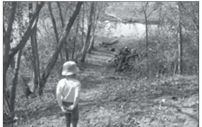
13. maijā notika Sidgundas Veckalnu pilskalna sakopšanas talka, kurā piedalījās gan sidgundieši, gan mālpulieši. Talcinieki atbrīvoja no kokiem un krūmiem Sudas un Mergupes satekas vietu. Lielās Juglas sākums tagad labi pārskatāms.

"Visu Latvijai!" atzīmē 15.maiju. Partijas biedri vieglajās automašīnās un vairāki motociklisti ar Latvijas karogiem devās ceļā no Valmieras uz Rīgu, pietājot Cēsis, Siguldā, Mālpilī pie kultūras nama, Suntažu centrā, Ķegumā, Ogrē, Ozolnieku tautas namā, Jelgavā, K. Ulmaņa dzimtajās mājās "Pikšās". Brauciens noslēdzās vakarā ar kopīgu dziedāšanu un sveicīšu iedegšanu pie K. Ulmaņa pieminekļa Rīgā.