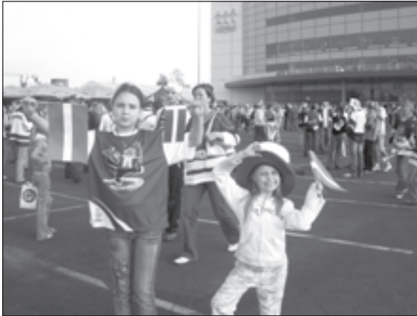
Mālpils fani valsts krāsās pie hokeja halles "Arēna Rīga".