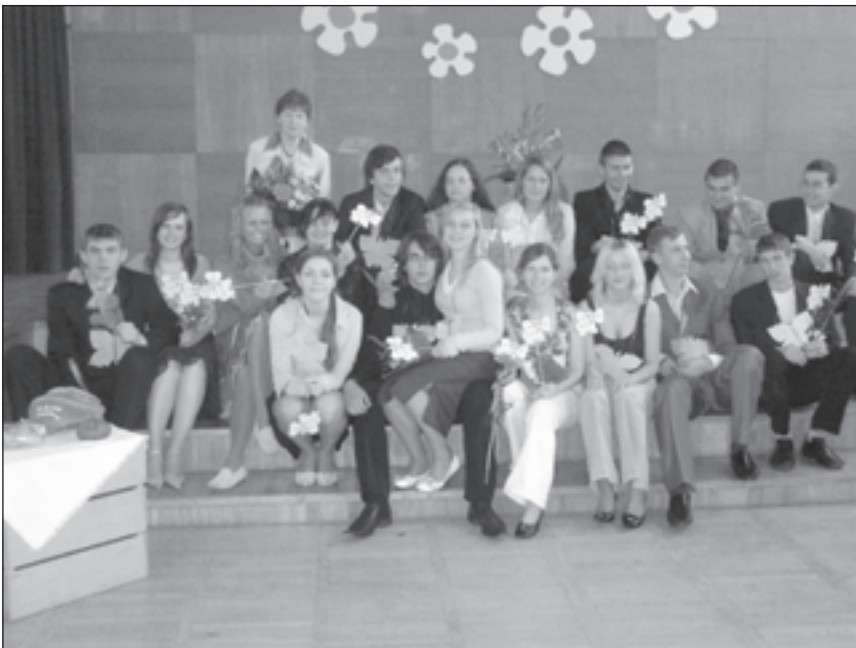
12.klases skolēni pēc Pēdējā zvana sarīkojuma.