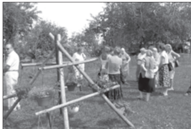
Vācu aitu suņu audzētavā ciemojās arī Lodes pagasta dāmu klubīņa dalībnieces

„Cik Latvija ir skaista..., Cik daudz interesanta var uzzināt, apceļojot mūsu zemīti...” – tādas atsauksmes dzirdu jo bieži no saviem ceļotājiem, kuri izvēlējušies nedēļas nogalēs apceļot Latviju, Lietuvu, Igauniju. Ceļojumu aģentūra,