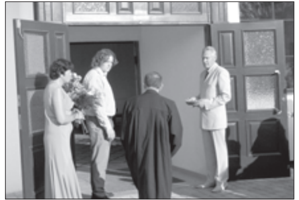
Svinīgais lentas pārgriešanas brīdis 19. augustā