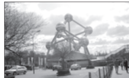
Atomium tika būvēts uz Expo izstādi, un šogad to atklāja atjaunotu.

Bet Briseles īpašums un vienreizība slēpjas tajā, ka tā ir jāpamana. Jāpamana sīkumi, kas šo pilsētu veido. Ja Parīzē viss ir liels, izgaismots un pasvītrots, tad Brisele nav tik izteiksmīga. Pirmais iespaids man bija vairāk vai mazāk pelēcīgs. Nu ir mājas, laukumi, šaurās ieliņas, katedrāles. Viss ir. Un kas tad vēl?! Bet nodzīvojot Briselē aptuveni 9 mēnešus, varu teikt, ka tur ir tik daudz kā vairāk. Ir apgleznotas māju sienas (ne grafiti, bet komiksu stilā veidoti