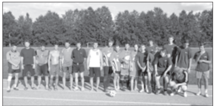
Mālpils "Sadraudzības kausa" futbolā godalgoto vietu ieguvēji. No kreisās: 2.vietas ieguvēji Lemberga (Mālpils), 3.vietas ieguvēji LMT un uzvarētāji – Jumurdas komanda.

turnīra organizatori nebija cerējuši. Bija ieradušās komandas no Ērgļiem, Ogres, Valmieras, Taurupes, Menģeles, Jumurdas, Zaubes, Mazozoliem, Lēdmames. Mālpilieši startēja ar 4 komandām un viena komanda pārstāvēja "Latvijas Mobilo Telefonu". Komandas tika sadalītas 4 grupās: 2 grupas pa 4 komandām un 2 grupas pa 3 komandām. Pirmā un otrā vietā no katras grupas ieguva tiesības piedalīties izslēgšanas turnīrā.