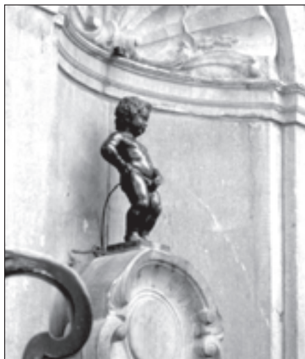
Manneken Pis . Čurājošais puisītis.