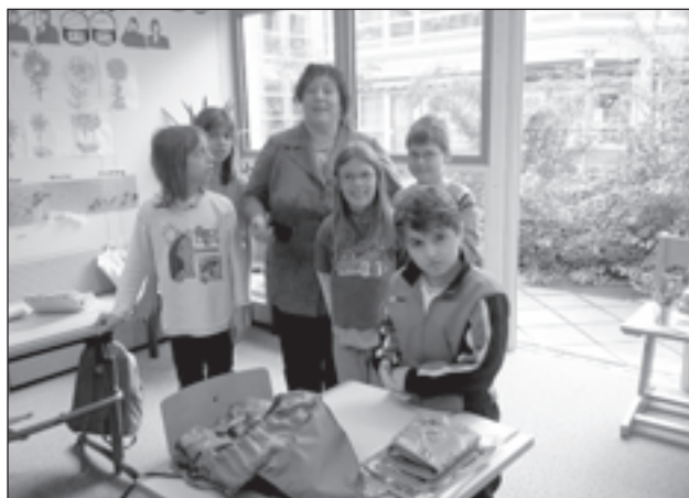
Sarunas ar bērniem stundu starpbrīdī

bērniem ar īpašām vajadzībām. Pirmās nedēļas rīta cēlienos piedalījās stundās skolēniem no pirmās līdz ceturtajai klasei. Hospitēju stundas, aktīvi iesaistījos individuālajā darbā ar skolēniem, kā arī pati mācījos rēķināt vāciski matemātikas stundās, rakstīju diktātus vācu valodas stundās. Varu palielīties – septītās klases līmeņa diktātā man bija tikai divas kļūdas, pati brīnījos! Pēcpusdienās darbojos pirmsskolas vecuma bērnu grupās, kur kopā ar