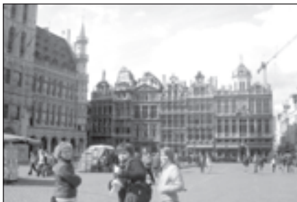
Briseles galvenais laukums – Grande Place.

atpakaļ budžetā un ieguvusi labus kursa biedrus). Taču tajā pat laikā es zināju, ka braukšu, neraugoties uz visām šaubām un neziņu. Septembra sākumā iekāpu lidmašīnā un aizbraucu uz Briseli. Gribēju un aizbraucu. Viss.