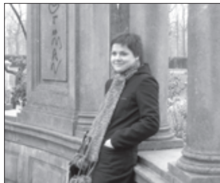
Pati. Piecdesmitgades parkā.

Sapratu arī, ka nav attāluma. Nu nav. Nav vairs tie laiki, kad vajadzēja kaut kur sadabūt zirgu un proviantu 3 dienām, lai nokļūtu uz kādu attālāku vietu. Tagad ceļā no Briseles uz Rīgu ir jāpavada vien divas