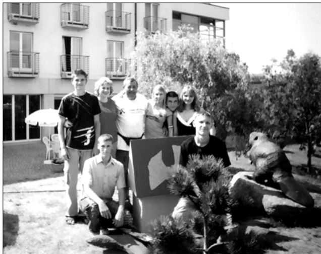
Pie savdabīgās strūklakas Angermindes Rātslaukumā.