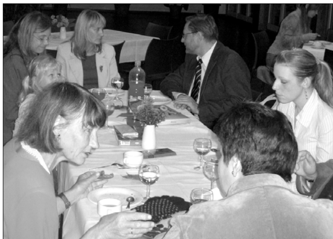
Vācu virtuves ēdienu degustācija.