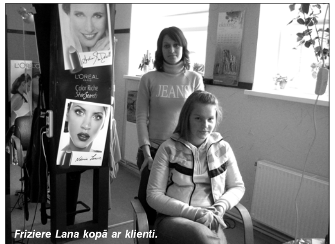
Friziere Lana kopā ar klienti.

Frizētavas un veikala darba laiks - katru dienu no 9.00 līdz 18.00, izņemot svētdienas, tālrunis informācijai 7925509.