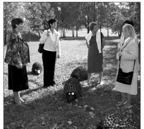
Ārzemju viesi pie 3. klases veidotajiem ežiem.