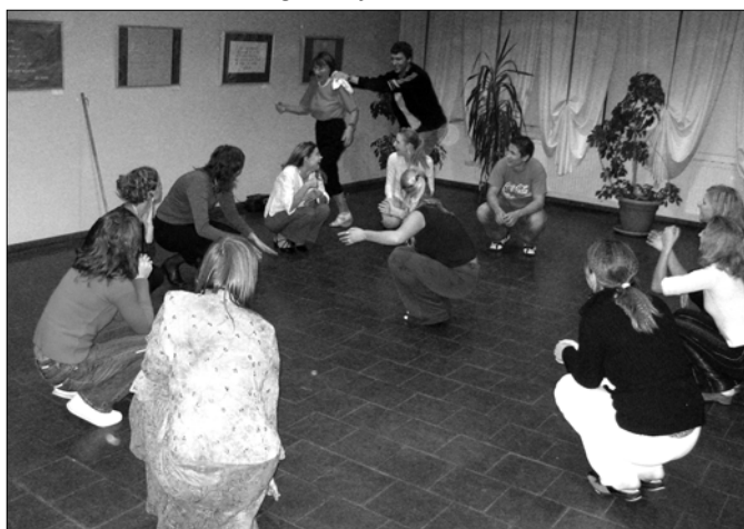
Latviešu vakarā iemācījāmies arī vācu rotaļu.