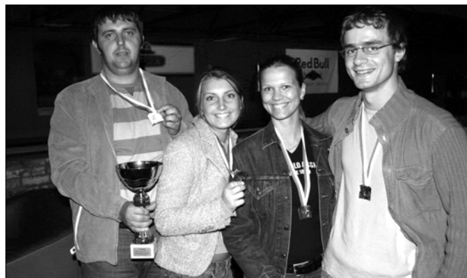
3.vietas ieguvēji Rīgas rajona 2006.gada sporta spēlēs Bowlingā.