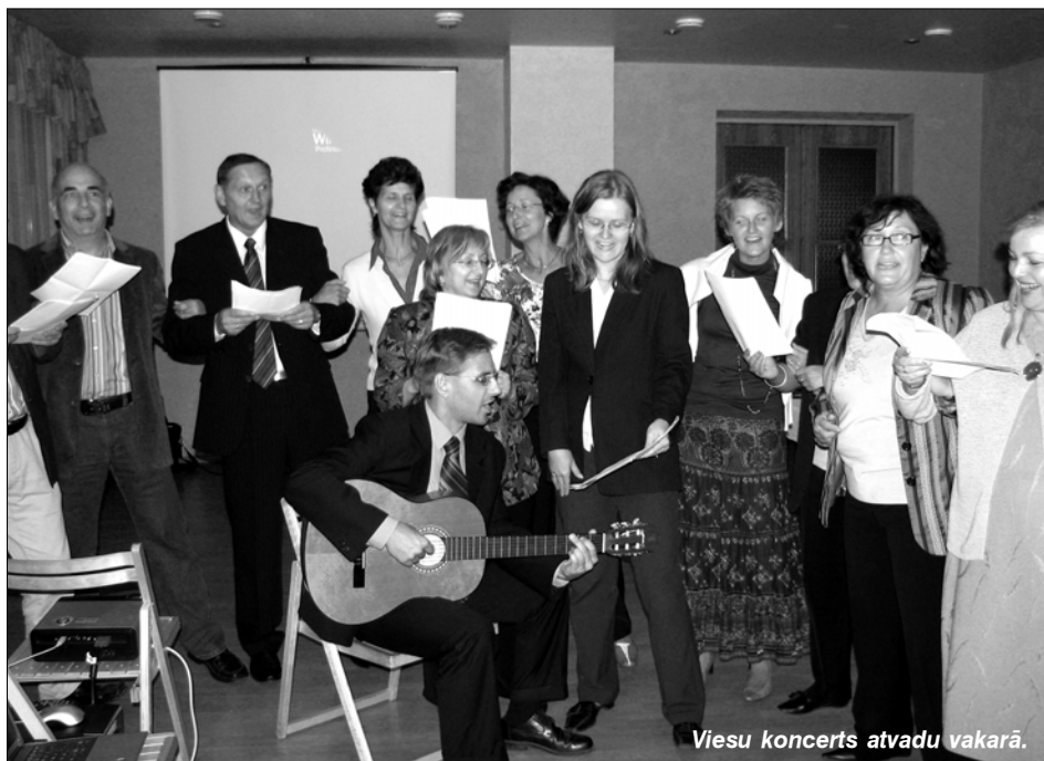
Viesu koncerts atvadu vakarā.

mācību darbnīcas. Ēdienu gatavošanas laboratorijā viņiem bija iespēja pagaršot raksturīgus latviešu ēdienus. Viesi atzina, ka mālpilieši ir radoši izmantojuši visas iespējas, ko sniedz ES izglītības programmas, sevišķi Leonardo da Vinci prakšu programmu, kas vispārīglokošajām skolām nav pieejama.