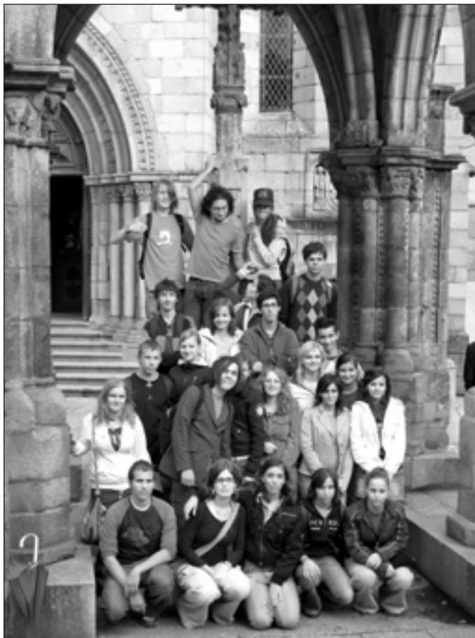
Portugāles pirmā karaļa pilsētā Guimaraes.