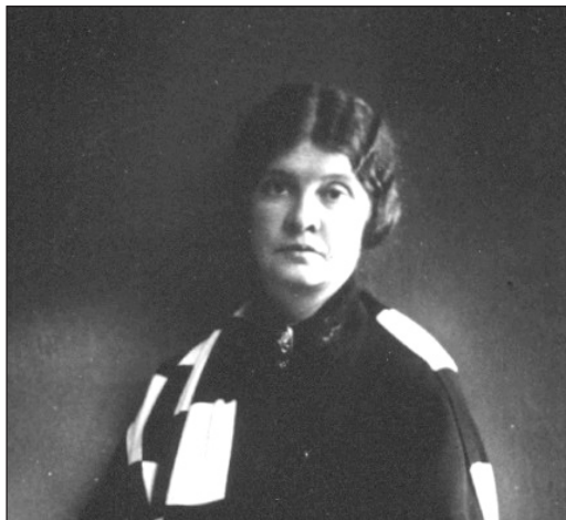
Ivande Kaija pusmūžā.