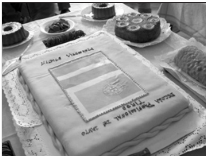
ĻOTI saldā atvadu torte.

Kā veicās ar angļu valodas pielietojumu? – Ar angļu valodu viņiem iet švaki, tomēr tas nebija šķērslis sarunām, pie rokās vienmēr bija vārdnīca, kura palīdzēja kaut daļēji saprast, ko otrs vēlas, reizēm palīdzēja arī zīmju valoda ( Diāna ). Ar angļu valodas pielietojumu man veicās labi. Lieliska iespēja bija savas angļu valodas zināšanas