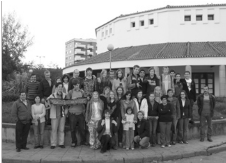
Atvadu rītā kopā ar ģimenēm.

Savukārt, mums ar skolotāju līnū patīkams pārsteigums bija portugāļu partneru precīzais un uzticamais atbalsts visās grūtībās, kuru šajā braucienā nūdien netrūka. Kolēģu saulainais miers palīdzēja to visu pārvarēt, un arī mēs daudz ko varējām ielikt savā pieredzes krātuvē blakus priekam par tiem brauciena dalībniekiem, kas bija gan čakli strādājuši pie projekta tēmām jau pirms brau-