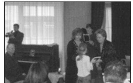
Apbalvojumi par estētiskāko klases noformējumu.