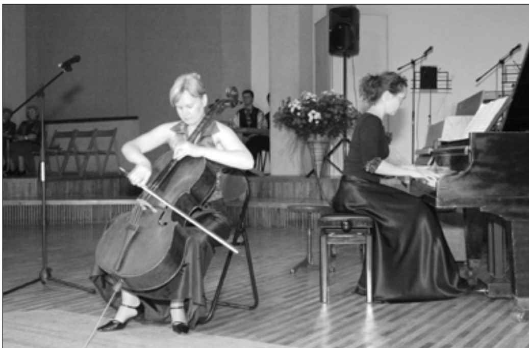
Koncertu sniedza Mālpils mūzikas un mākslas skolas pedagogi.