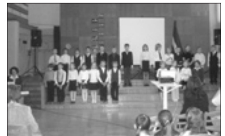
Jaunāko klašu pasākums.