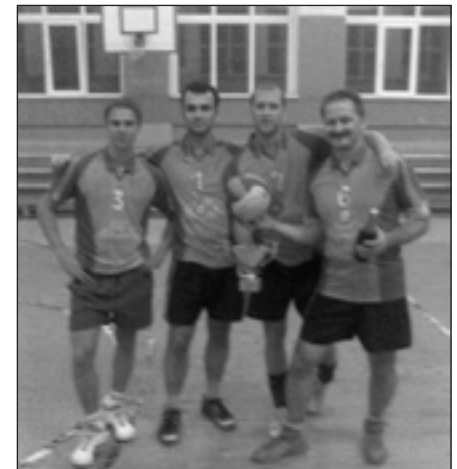
1.vietas ieguvēji – LMT komanda.