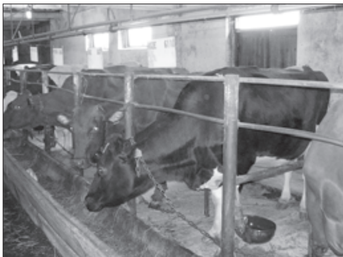
Zemnieku saimniecības "Ruķi" govju novietnē.

Visiem lauksaimniekiem vēlu gaišu noskaņu Ziemassvētkos. Jaunajā gadā spēku, izturību, daudz ideju, radošu domu un veiksmi.