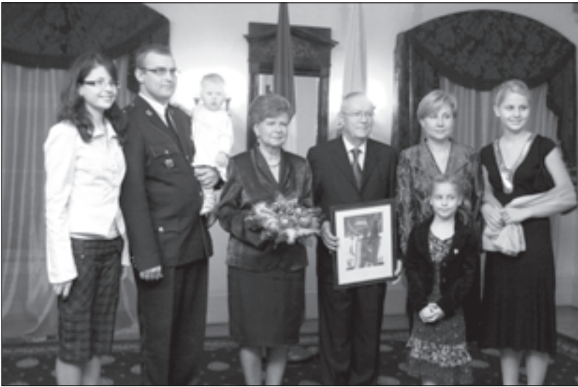
Bausku ģimene kopā ar prezidentu Vairu Vīķi-Freibergu un Imantu Freibergu.

(Pēc "Neatkarīgās Rīta Avīzes" materiāliem)