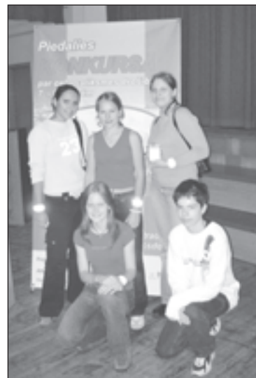
Konkursa “Gribu būt mobilis” pusfināla 2. vietas ieguvēji – 9.b klases komanda

Ar Mālpils vidusskolas komandu (9.b kl., 7.a kl.) iegūto 2. un 3. vietu republikas konkursa “Gribu būt mobilis” pusfinālā. Projektu organizēja CSDD. Apsveicam!