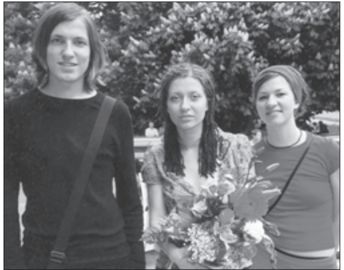
Izlaidums Rīgas lietišķajos

Pati lielākā veiksmē, kas joprojām nav mani pametusi, ir gan mani skolotāji, pasniedzēji un profesori, tie brīnišķīgie cilvēki, ko sauc par draugiem un kolēģiem. Viņiem visiem ir kaut kas kopīgs – skaisti, gudri, talantīgi! Bet ja pavisam nopietni, tad