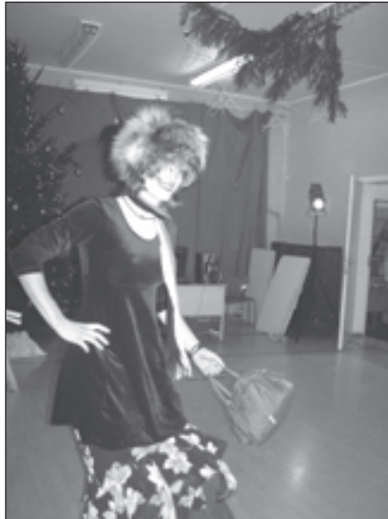
Viena no lieliskajām Sniegbaltītēm

Ar šo dzejoļa divrindi nāk atmiņā vēl viena jauka tradīcija, kad Adventes vainagā tiek aizdedzināta svece. Lielajā skolas vainagā to aizdedzina direktore, bet katra klase – savā mazajā.