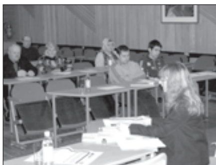
Mālpils pagasta padomes konferenču zālē pārliecinājāmie par plašo interesi gan no jauniešu, gan jau pieredzējušu zemnieku puses

"Mālpils zemniekiem ir dota iespēja papildināt savas zināšanas lauksaimniecībā. No 2. janvāra līdz 14. februārim notiek apmācības 4 galvenajās nozarēs: augkopībā, lopkopībā, grāmatvedībā un ekonomikā. Kopīgais apmācību ilgums ir 120 stundas.