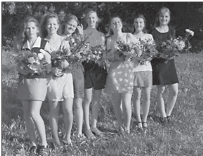
Pirmais izlaidums mākslas nodaļā

Mālpils mūzikas un mākslas skolas Mākslas nodaļas vadītāja