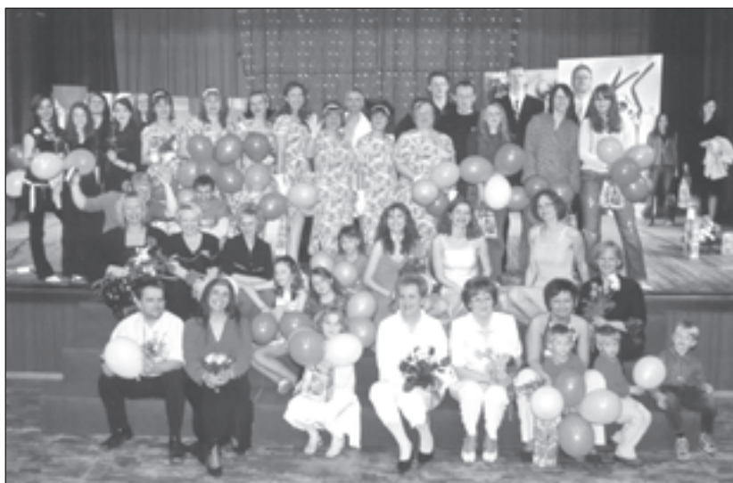
2006. gadā tika svinēta dziedāšanas svētku “Mālpils dziesma” piecu gadu jubileja

Gaidām jau zināmos un jaunus dziedātājus! Sevišķi priecāsimies par dziedošajām ģimenēm. Par koncerta – konkursa noteikumiem lūdzam interesēties kultūras namā. Dalībnieku pieteikumus gaidām līdz februāra beigām. Lai izdodas atrast vislabāko dziesmu!