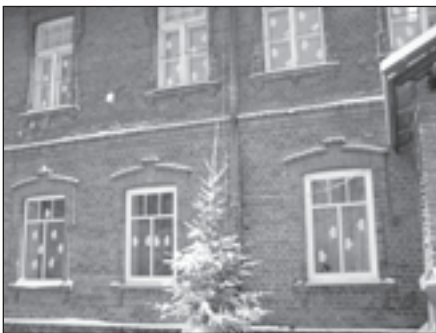
Skola Ziemassvētku noskaņās

Vēl ļoti neaizmirstamas bija tikšanās ar "Mālpils maizes" un "Lāču" ceptuves pārstāvjiem. Lieki piebilst, ka šīs tikšanās, protams, beidzās ļoti garšīgi – ar maizītes degustāciju. Vēl noteikti vēlos teikt, ka "Lāču" ceptuves pārstāvis ir mūsu skolas