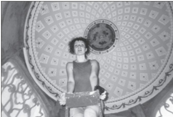
Darbs tuvu debesīm

Ir svarīgi būt aprītē. Ar to es domāju ne tikai aktīvu dalību karnevālu sezonā. Daudz nozīmīgāk ir būt informētam par notikumiem izstāžu zālēs, teātros, literatūrā, mūzikā..., un nesamierināties ar Latvijas mērogu. Ir taču valstis, kur jau ir laikmetīgās mākslas muzeji un koncertzāles. Nemaz ne tik tālajā Tallinā, piemēram, nemaz nerunājot par Londonu vai Romu. Šķiet