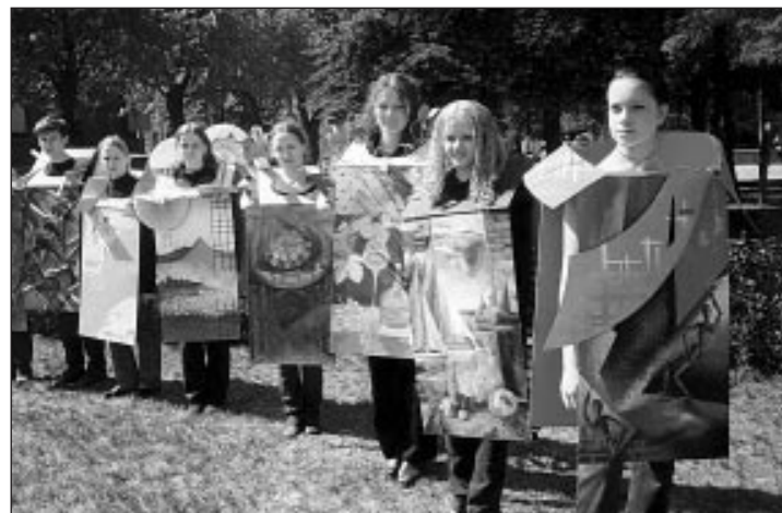
2000. gada diplomdarbi "Gadsimtu vīzijas"