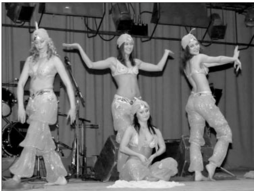
Deju grupa "Amulets"