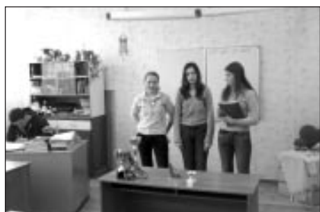
8.a klase projekta aizstāvēšanā