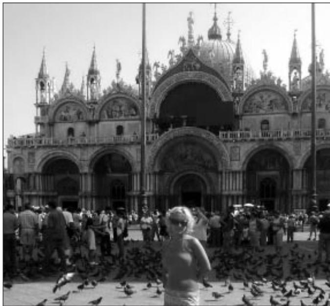
Svētā Marka laukums Venēcijā