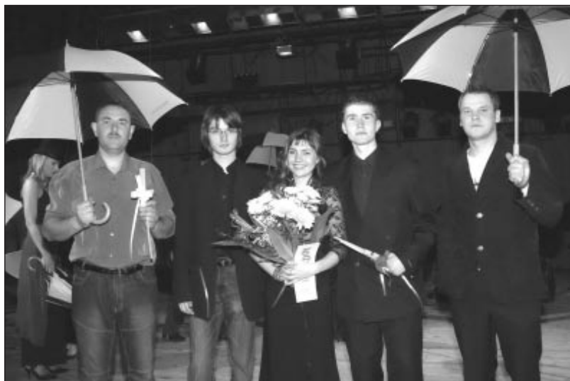
Grupa “Evija un puīši”