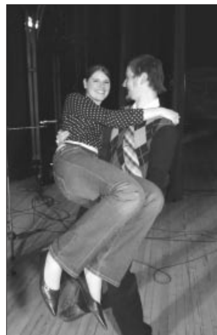
Duets “Ercenģelis no Hospitāļu ielas”