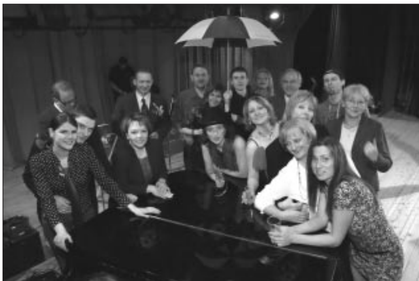
Žūrija un dalībnieki dziedāšanu turpināja vēl pēc koncerta