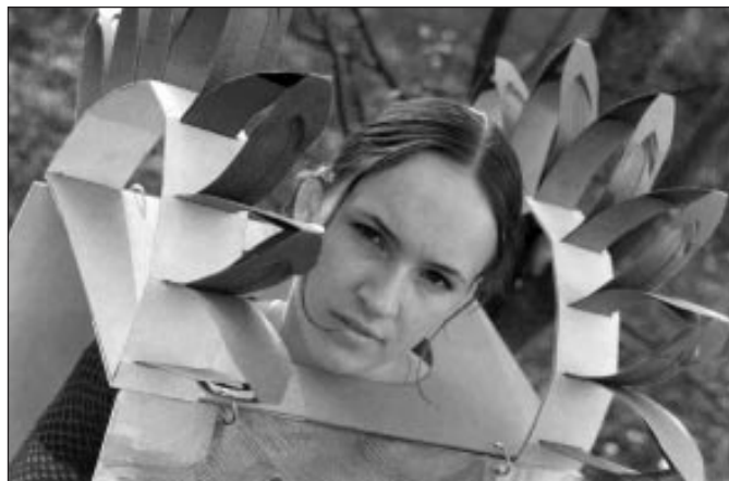
Diplomdarbs “Gaimas rotaļas laikā”

Un sākums šim ceļam bija Mālpils Mākslas Skola.