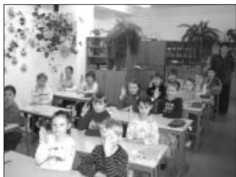
1. klase savā pirmā projekta aizstāvēšanā