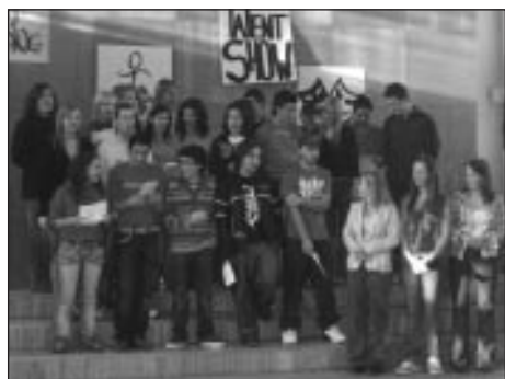
Angļu vakarā kopā ar viesiem no Portugāles