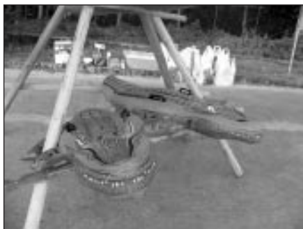
Balvas gaida nakts trasītes uzvarētājus