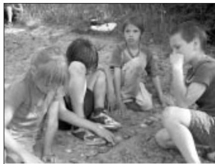
Ja komandai "Lauvas" izdosies atminēt mīklu, kas uzrakstīta uz akmeņiem – apslēptā manta būs rokā