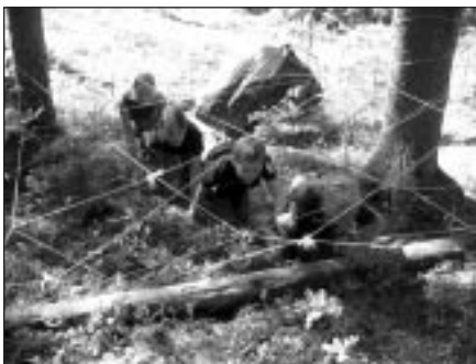
Zirnekļa tīklus šķērsot neaizskarot zvaniņus, cenšas komanda "Šausmas un drausmas"