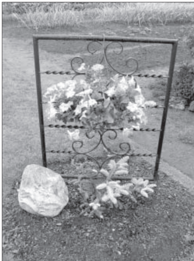
Ceriņu iela 8

Mājas sienai piekļāvusies skaisti sakranta malkas grēda, kas veic arī dekoratīva elementa funkcijas. No kalna gala paveras skats uz plašajām pļavām un lejā esošo parku. Kas tās lapas var savākt? Pašu spēkiem vien viss notiekot. Šogad apstrādāti krūmi ceļa malā, savu kārtu gaida arī lapene, kurai jau iezīmēta vieta. Pēc ilgām pārdomām rasts interesants risinājums vecajiem grodiem, kas tagad kalpo kā aktīvās atpūtas zona mazajam meitēnam, kas kopā ar kaķi draiskojas plašajā dārzā.