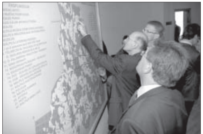
"Saint-Gobain" pārstāvji pie Mālpils pagasta kartes.

Latvijā "Saint-Gobain" savas aktivitātes uzsāka īsi pēc neatkarības atgūšanas. Jau 1993. gadā tika nodibināta pirmā pārstāvniecība. Tiek plānots laika periodā no 2007. – 2011. gadam