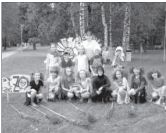
Teātra pulciņa dalībnieki