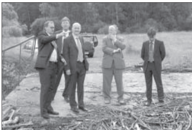
Jaunās ģipškartona rūpnīcas vietas apskate.

Ir paredzēts rekonstruēt un noklāt ar asfalu pievadceļu no Siguldas šosejas līdz mūsu uzņēmumam, kā arī rekonstruēt tiltu pār Sudas upi. Izvērtējot rūpnīcas novietojumu, Ceļu projektā