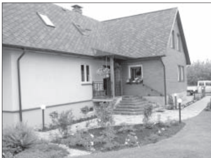
Kalna iela 6

Tāds miglains rīts. Pa retai pilei nopil, tomēr noskaņojums priecīgs – esmu brīnuma gaidās. Citādi nemaz nevar būt, jo dodos līdz vērtēšanas komisijai Mālpils pagasta skaistākā dārza meklējumos. Kas mūs sagaida? Ceru satikt jaukus māju saimniekus, ieraudzīt pasakainus dārzus, papriecēt acis pie puķu kupenām.