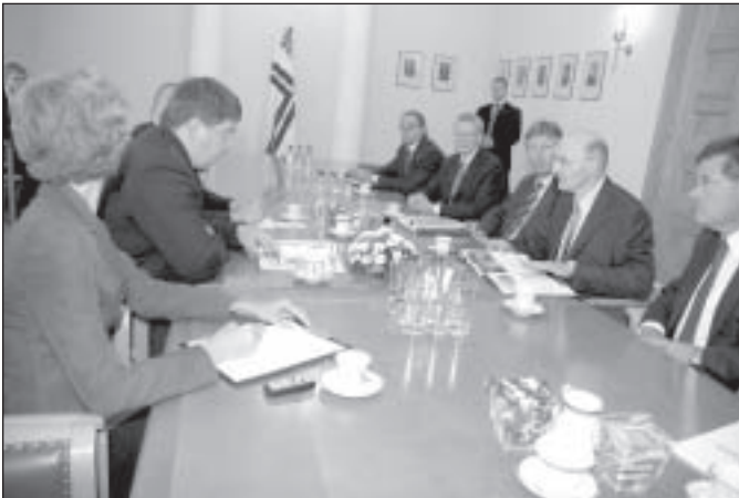
Tikšanās pie Ministru prezidenta.

Saskaņā ar apstiprināto Darba uzdevumu, no tajā minētajām institūcijām tika saņemti visi nosacījumi detālplānojuma izstrādei. Tika nolemts: apkopot institūciju izsniegtos nosacījumus un iesniegtos priekšlikumus, un, ja nepieciešams precizēt Darba uzdevumu; Izstrādāto detālplānojuma pirmo redakciju iesniegt izskatīšanai pašvaldības padomē; Organizēt detālplānojuma pirmās redakcijas nodošanu sabiedriskajai apspriešanai un atzinumu saņemšanai.