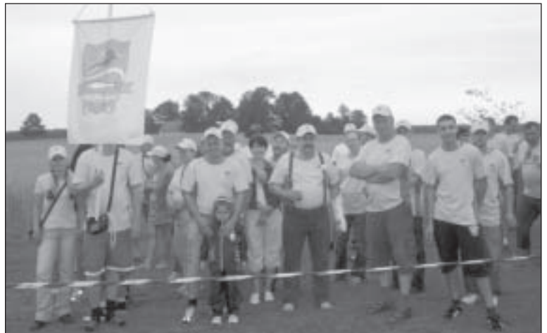
Mednieku biedrība "Mergupe"

Lielisko sajūtu – būt starp savējiem un izjust mednieku garu – jautrību, draudzību un azartu izbaudīja arī mūsu Mālpils pagasta mednieki, viņu ģimenes locekļi un līdzjutēji.