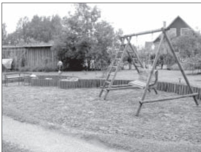
Kalna iela 10

Pats saimnieks sagaida pie vārtiem un vedina tālāk dārzā. Pa koka ripu celiņiem var nokļūt spēļu laukumā, kas tiek izmantots katru mīļu brīdi. Lai piesegtu kaimiņu malkas šķūnīti, sastādīti koki, kā arī citas dārza puses norobežotas ar dekoratīvo krūmu stādījumiem. Visjaukāk laikam ir maijā, kad zied ceriņi!