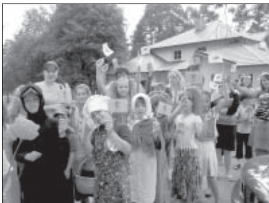
Gatavojoties svētku gājienam

Uzminiet mīklu! Vasaras brīvlaiks, bet bērniem jāiet uz skolu. Kāpēc? Nemocišu jūs ar minējumiem.