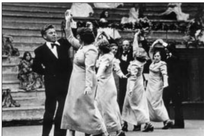
Vidējās paaudzes dejotāji svētkos. 70. gadi