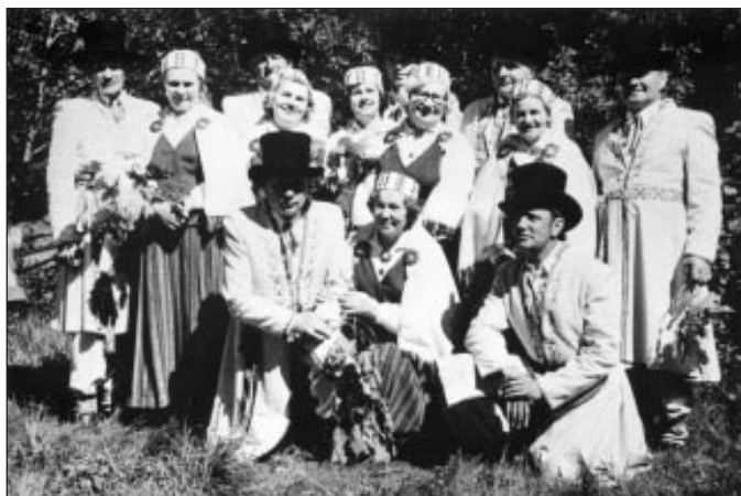
Vecākās paaudzes deju kolektīvs. 60. – 70. gadi