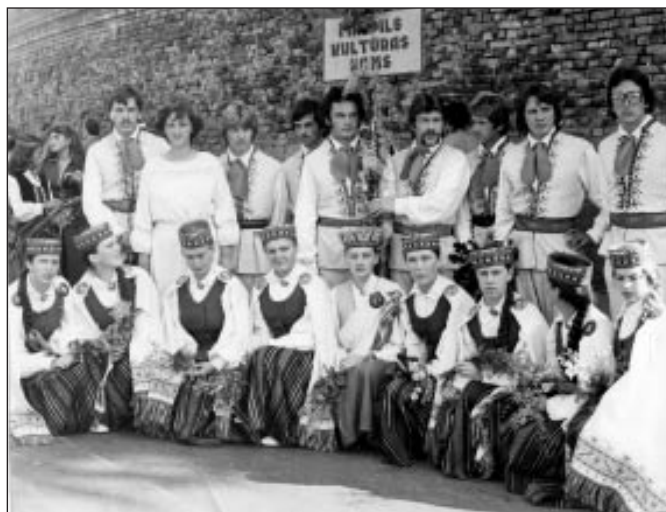
Jauniešu deju kolektīvs zonas svētkos. Ogrē 70. gadi