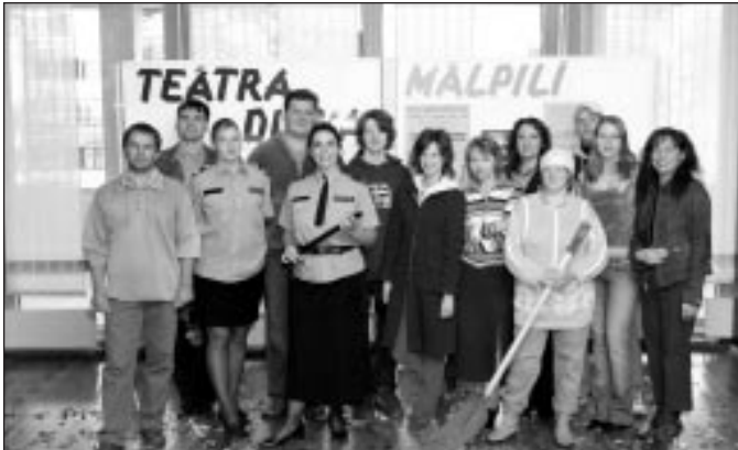
Izrādes "Klusu!" dalībnieki