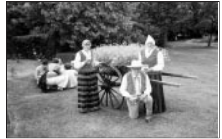
Tautas mākslas svētkos Beļģijā

top lupatdeķis. Tajā savu strīpiņu ieauš katrs kultūras nama darbinieks, dziedātājs, dejotājs un teātra spēlētājs.