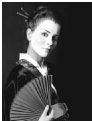
Arta skolas uzdevums – japāniete