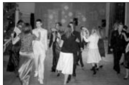
Vidusskolēnu Ziemassvētku balle