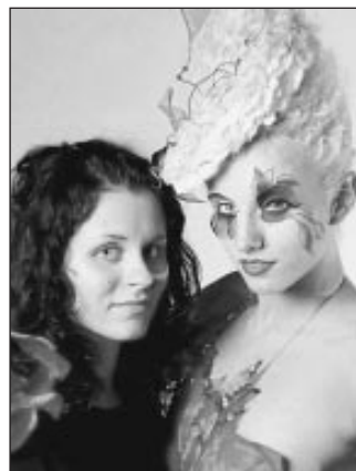
Baltick beauty world konkursā