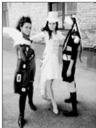
diplomdarbi – Artas pa vidu