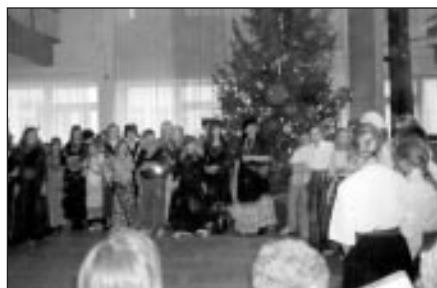
Budēji ir klāt!