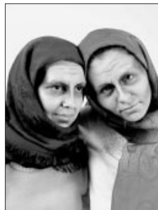
skolas grimēšanas uzdevums – večiņas