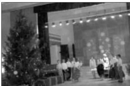
Mājīnieki gaida budēļus