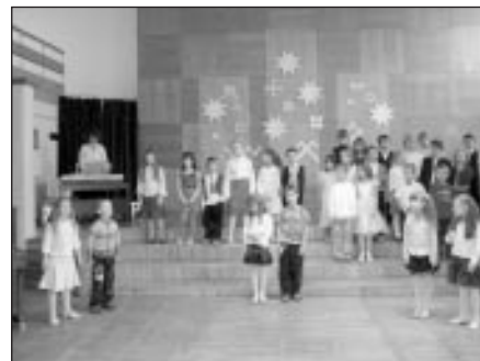
1. – 4. kl. pasākums

mā pulcēja pedagogus. Netrūka ne patiesi emocionālu mirkli, ne laba vēlējumu, ne savstarpēju dāvinājumu, ne jautrības.