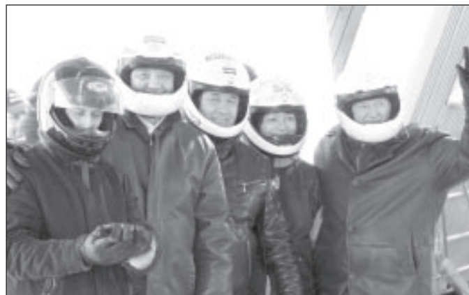
Mālpils komanda Rīgas rajona pašvaldību darbinieku ziemas sporta spēlēs