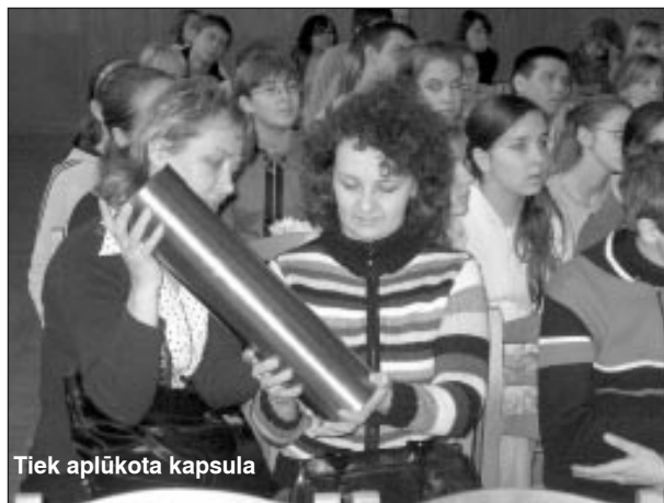
Tiek aplūkota kapsula