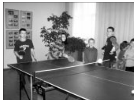
Galda tenisa spēle aizrauj ikvienu