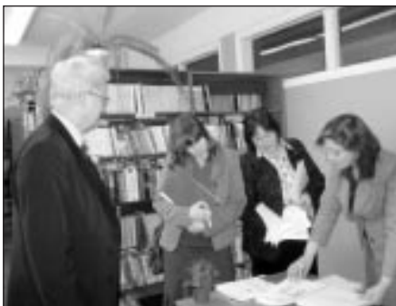
Rīgas rajona skolu bibliotēkas skates komisija vidusskolas bibliotēkā