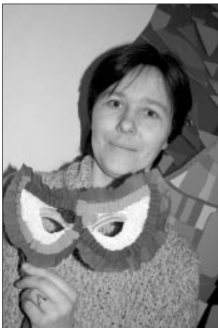
Godalgota vecaku maska

Jau trešo gadu Mākslas nodaļā tiek organizēta vecāku diena, kad kopā ar saviem bērniem dažas vērtīgas idejas un prasmes var iegūt arī vecāki. Šajā dienā ciemos tiek gaidīti visi – gan mammas