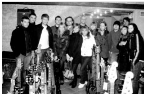
Dienu pēc mūsu tikšanās "Dzelzs Vilks" kļuva par Latvijas mūzikas ierakstu Gada balvas 2007 divkāršiem uzvarētājiem. Apsveicam!