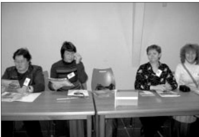
Mālpilietes projekta sanāksmes atklāšanā