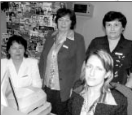
Laimi un izdošanos šajos grūtajos laikos vēl Mālpils pasta nodaļas darbinieces

Aizvien nozīmīgāki šajos steidzīgajos laikos kļūst cilvēciskie kontakti. Un, starp citu, pagājušajā gadā, kad bija tas lielais sajukums ar pasūtītās preses izdevumu savlaicīgu saņemšanu, ar Mālpils pastā veiktajiem pasūtījumiem viss bija kārtībā.