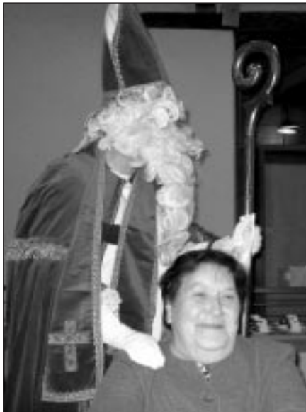
Ziemassvētku vecītis jau strādā