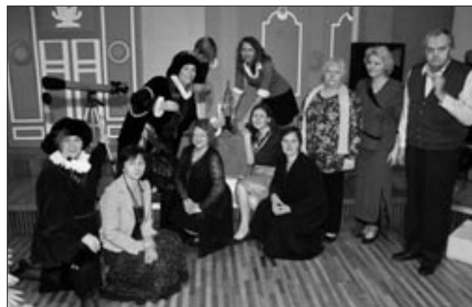
• KERAMIKAS STUDIJA "MĀL-PILS" UN "URGA"