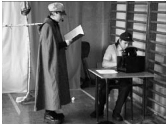
Fragments no uzveduma par poļu brīvības cīņām