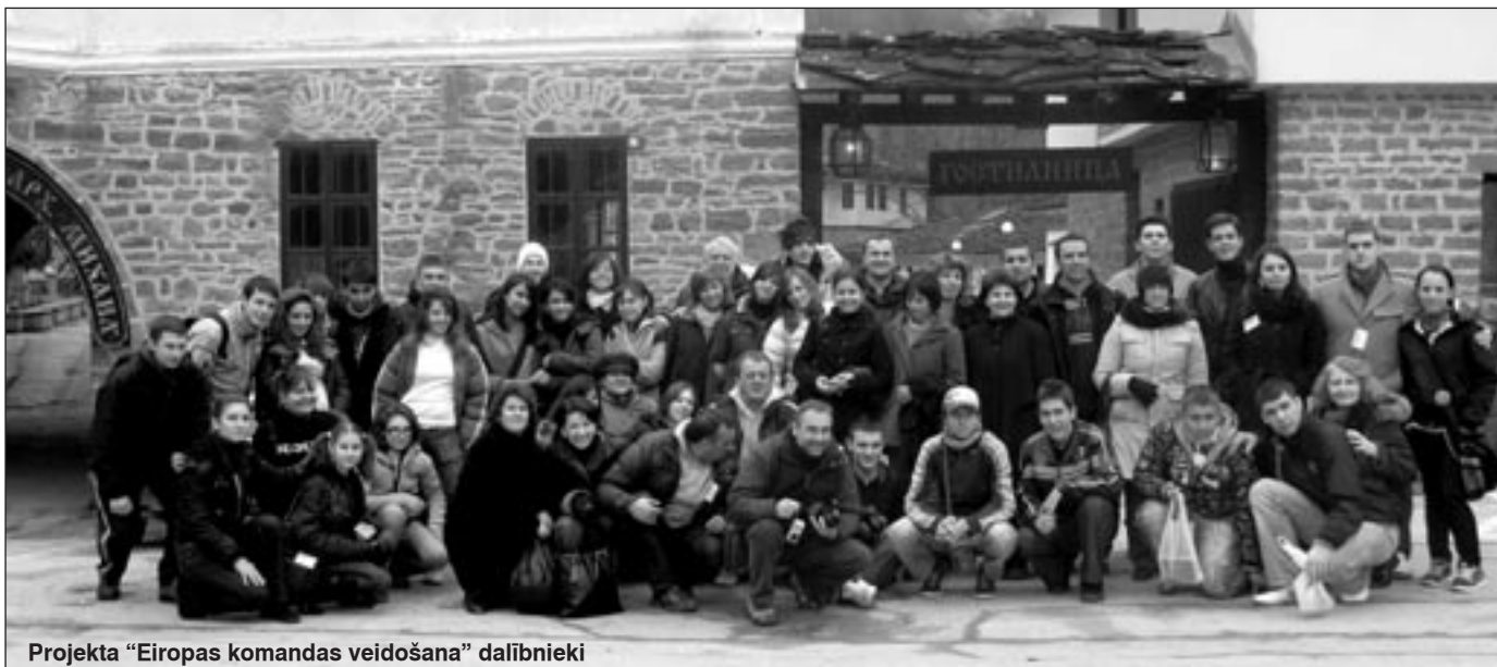
Projekta “Eiropas komandas veidošana” dalībnieki