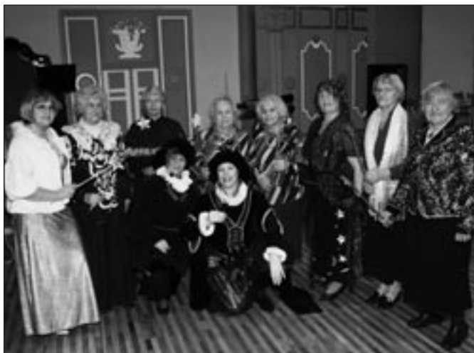
• REZĒDAS – KOSMISKĀS FEJAS

Pedro – Kā mēs viņu sauksim? Galileo – Vēl nezinu. Tas atkarīgs, cik viņas būs lielas un spožas!