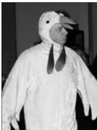
• JAUKTAIS KORIS – kosmiskie gaiļi un kosmiskās vistiņas

Galileo – uz Zemes ir īpaši zvaigžņu grupējumi, no kuriem mēs uzņemam enerģiju. Un mani vērojumi rāda, ka vislielāko enerģijas daudzumu izstaro tieši violetā krāsā... Pēc maniem aprēķiniem, šovakar mēs ieraudzīsim arī kosmiskus gaiļus un vistiņas.