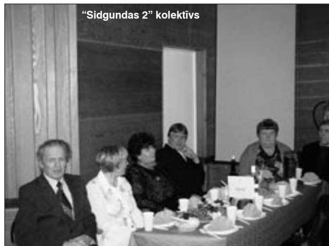
“Sidgundas 2” kolektīvs