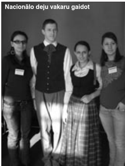
Nacionālo deju vakaru gaidot