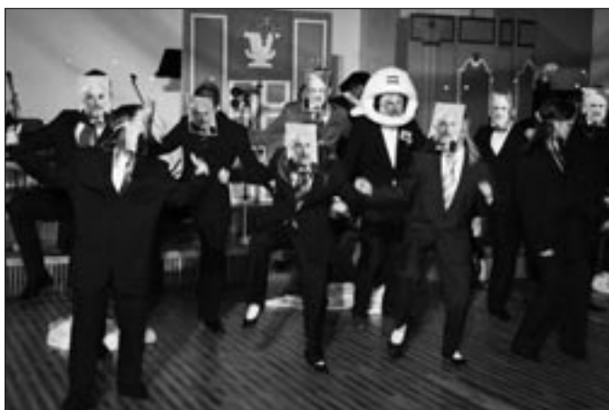
• MĀRA – politiski visaktuālākais priekšnesums – GODMAŅA KLONĒŠANA