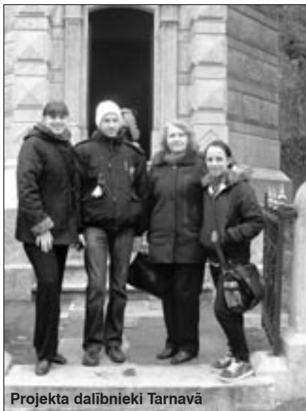
Projekta dalībnieki Tarnavā