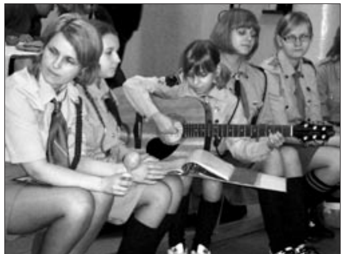
Poļu skautu dziesma