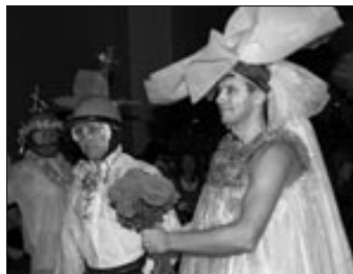
• DEJU KOPA SIDGUNDA jaunā pāra savienība vai kāzas kosmos)