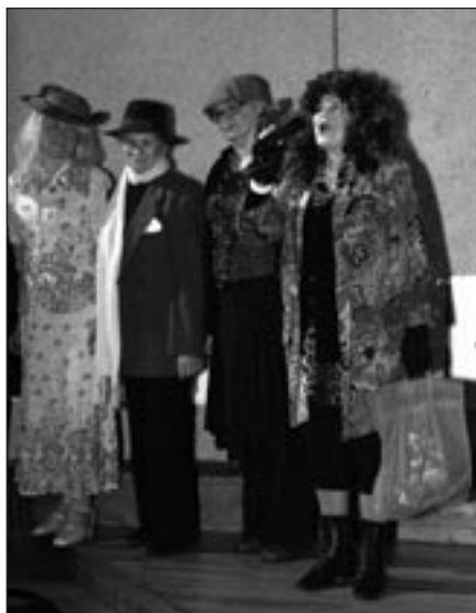
• SIDGUNDAS SIEVAS – ESTRĀDES ZVAIGZNES AR ZVAIŽNOTO DZIESMU POPŪRIJU

Pedro – Ir zināmas dažādas galaktikas, ko sauc par aktīvajām galaktikām. Aktīvajai galaktikai ir raksturīgs ļoti spožs kodols. Aktīvās galaktikas ir, piemēram, Kvazāri, Blazāri un “HardCandy”.