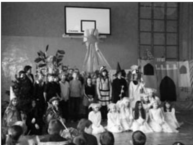
Poļu pasakas uzveduma dalībnieki