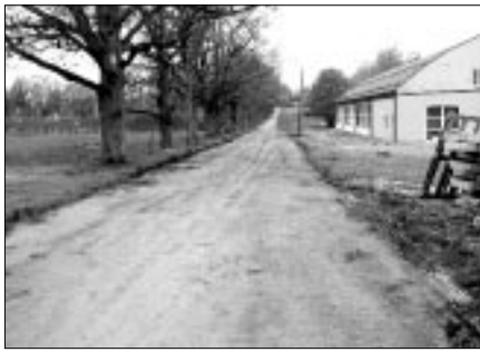
Darbu sākumposmā maijā...