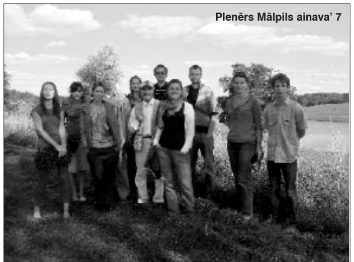
Plenērs Mālpils ainava' 7