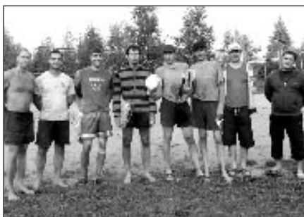
Pludmales volejbola sacensību kopvērtējuma līderi

28.jūnijā , Mālpilī, pludmales volejbola laukumos aizbērnudārza, sākas pirmais no trīs posmiem pludmales volejbola sacensību maratoniem. 1.posmā piedalījās rekordliels skaits komandu – 28 komandas vīriešu konkurencē, 8 jautās un 2 sievietes komandas.