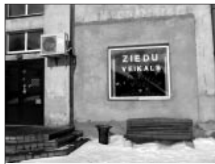
Šeit grāmatnīca darbojās vairāk nekā 20 gadus