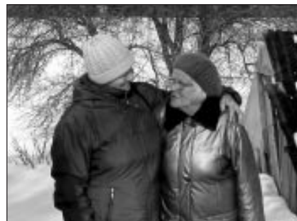
Kolēģes pēc sirsnīgām sarunām