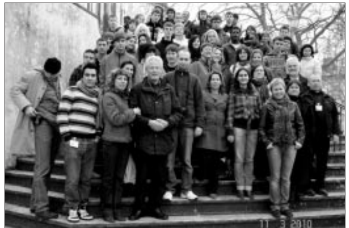
Visi sanāksmes dalībnieki