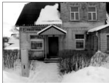
Pirmās grāmatnīcas vieta