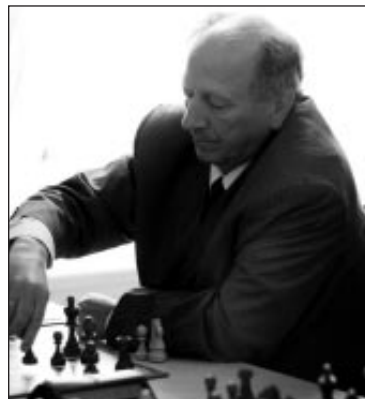
Mālpils muižas kausa izcīņas šahā uzvarētājs lielmeistars Jevgeņijs Svešņikovs