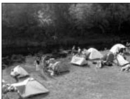
Teļu pilsētiņas iekārtošana

Mergupes ūdeņi pie Brūnu HES laikam tik daudz bērnu vienuviet ar makšķerēm vēl nebija redzējuši. Pašā vasaras vidū, spītējot jūlija tveicei un pa pamali slidošajiem melnajiem mākoņiem, Mālpilī darbu sāka vasaras nometne, kuri daudzi bija ļoti gaidījuši. Tā pulcināja bērnus vecumā no 5 līdz 16 gadiem no Mālpils, Ogres, Siguldas novada, bet bija arī tālāki viesi. Vārdu „darbu” neizvēlējās nejauši, jo te sanākušo bērnu sejās jau pirmajās stundās bija redzams – mēs gribam mācīties, mēs gribam noķert Lielo zivi! Lielākā daļa bērnu, vecāku un vecvecāku pamudināti, ar makšķerēšanu nodarbojas aktīvi un ilgāku laiku.