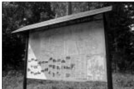
Atpūtas vietas info stends Sidgundas parkā

Velomaršruta bukletus un brošūras var saņemt (bez maksas) Mālpils novada domē, Nākotnes ielā 1, 222.kab.