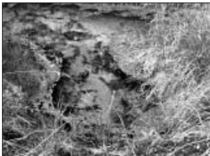
Sēravots pie Dārziņiem