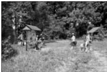
Velomaratonu dalībnieki atpūtas vietā