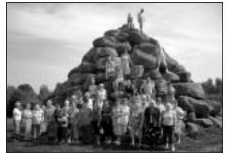
Kaltenes akmeņainās jūrmalas krastā

Šoreiz ekskursijā piedalījās arī tādi braucēji, kas ilgāku laiku nebija ārpus savām mājām, kādam varbūt ceļš līdz jūrai bija mazliet par tālu, taču visvairāk sirdssiltuma, mums, ekskursijas organizētājiem, sagādāja braucēju prieks par iespaidiem dāsno dienu, kas ir vislielākā atlīdzība mūsu darbam. Ļoti ceram, ka ekskursijas dalībnieki guva plašu informāciju par dabas un kultūras vēstures objektiem, emocionāli bagātinājās viens no otra un tā bija lieliska kopā būšanas un citādā pieņemšanas pieredze.