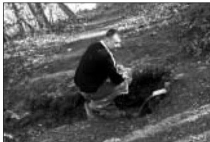
Avots Sidgundas parkā