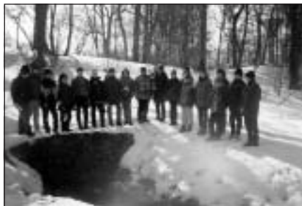
Mālpils vidusskolas bērni tikko sakopuši Vinkalna avota apkārtni. 1999.gads