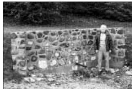
Vitolds Blumbergs pie sava lolojuma