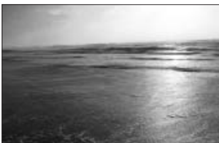
Atlantijas okeāna krastā