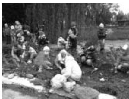
Arī bērniem atrodas darbiņš Bērniības varavīksnē