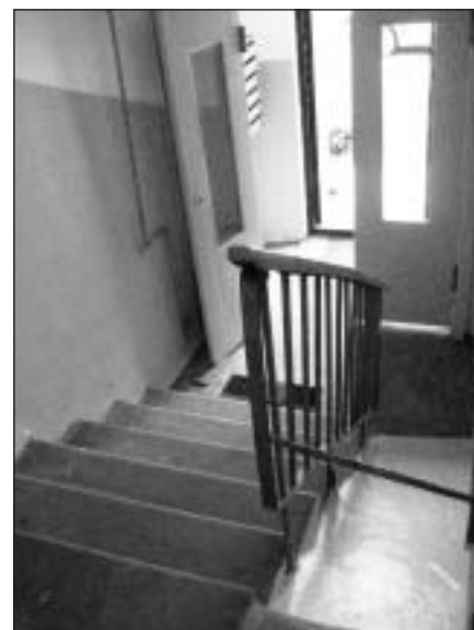
Atjaunota kāpņu telpa

Bērnudārza teritorijas nostūris ar satrudējušiem koka soliņiem, noplukušām, sūnu apaugušām betona plāksnēm,