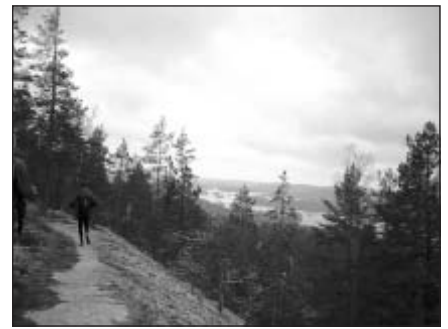
Bieži distance gāja pa klinšainiem akmeņiem, kur takas vietu varēja nojaust tikai pēc pirmo skrējēju radzoto apavu skrāpējumiem akmeņi