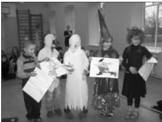
Spociņi un raganiņas