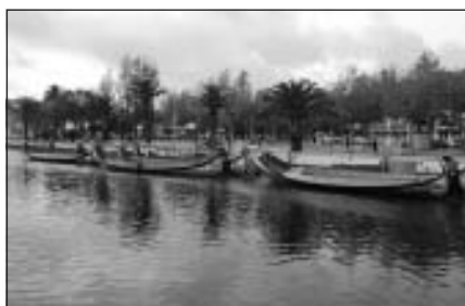
Aveiro pilsētas kanāls