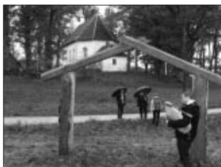
Caur jaunajiem Saulas vārtiem uz pasākuma vietu