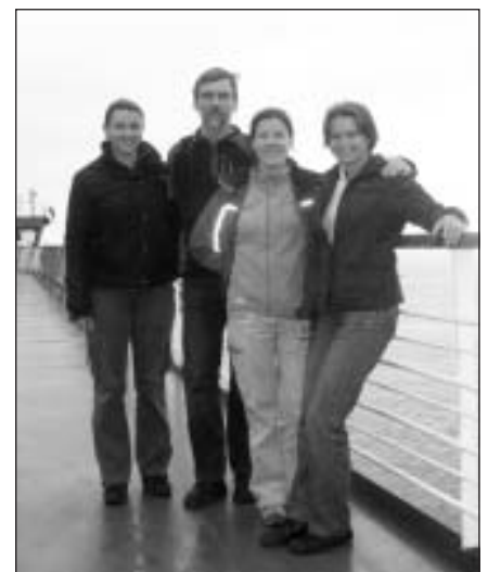
Dalībnieku kompānija no Latvijas

Pēc šīs sagatavošanās devāmies uz starta vietu. Katram tika iedots GPS raidītājs, lai organizatori varētu visu laiku sekot līdzi, kur dalībnieks ir trasē, vai nešmaucas, saīsinot maršrutu, lai neapmaldās, lai signāla