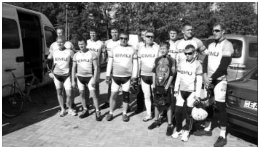
EMU komandas dalībnieki pirms starta 20.Latvijas vienības velobraucienā

7.novembrī , Mālpils sporta kompleksā, norisinājās Mālpils novada atklātais