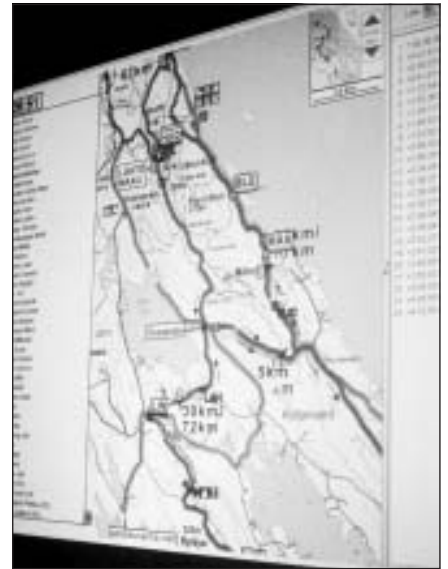
Organizatori visu laiku varēja sekot līdz dalībnieku kustībai interaktīvā kartē, kas ar GPS raidītāju palīdzību rādīja – kur katrs skrējējs atrodas. Kartes kreisajā malā var redzēt burtniņus "LIN", tas bija mans punktiņš, nu jau otrā apla beigās – 72.km