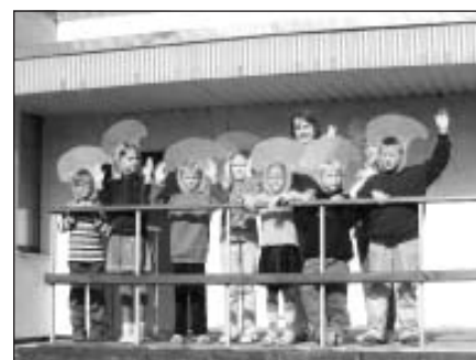
Pirmais pasākums Vasaras klasē