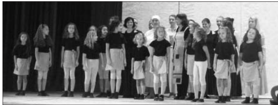
Deju iestudējuma "Par lietām, kas nepāriet" dalībnieki