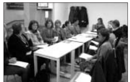
Projekta komanda darbā