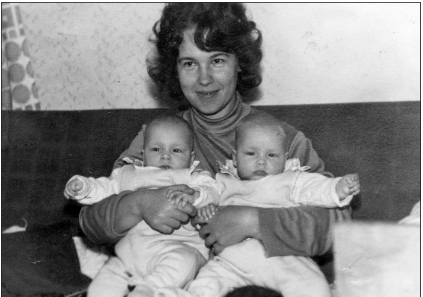
Kopā ar māmiņu