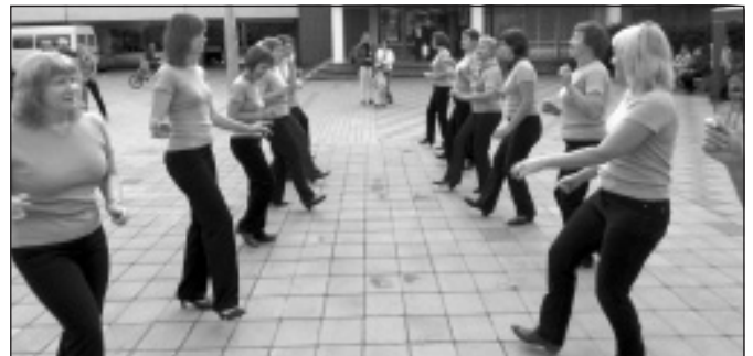
2011. g. Dejo Happy Line.