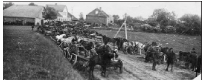
Zaķa krogs Mālpilī ap 1926.g. Tirgus diena