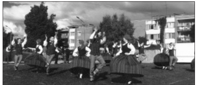
2005. g. Plīv brunči.