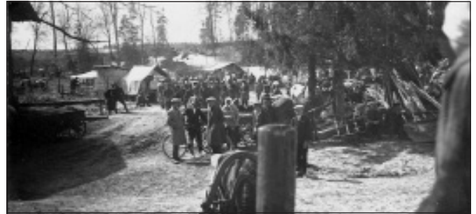
Tirgus vai gadatirgus Mālpilī, iespējams, pie parka stūra, ap 20. gs. sāk.