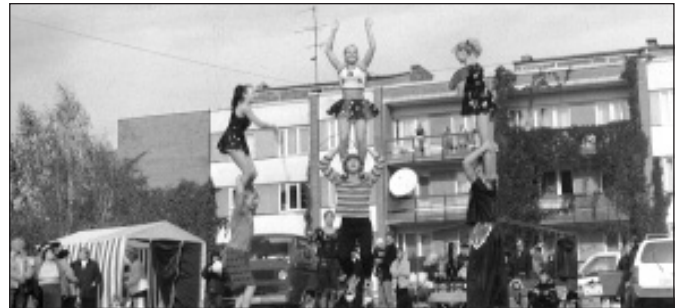
2001. g. Vingrotāji.