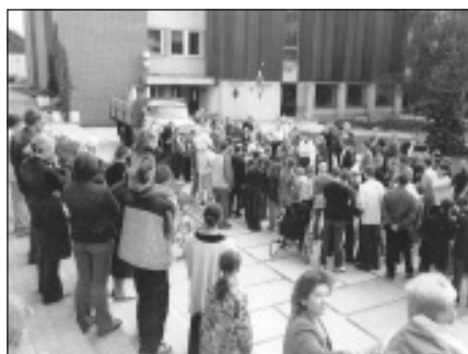
2003. g. Smagās mašīnas vilkšana.