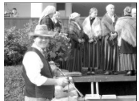
2011. g. Tirgus vecis.