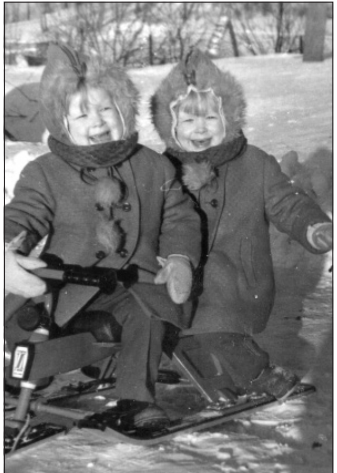
Māsiņas ziemas priekos