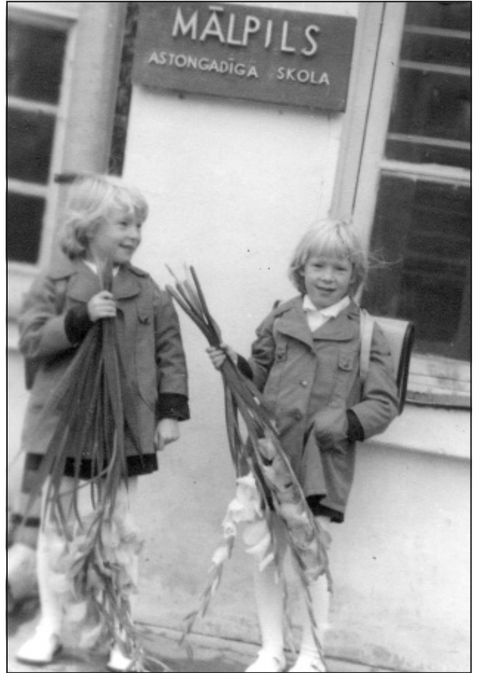
Pirmā skolas diena

un lolots. Māsas bija labas matemātiķes, un audzinātāja, kas bija arī matemātikas skolotāja, par to, protams, priecājās. Viņa māsas atšifrējusi pavisam vienkārši – pēc pilnīgi atšķirīgiem rokrakstiem, pat cipariem.