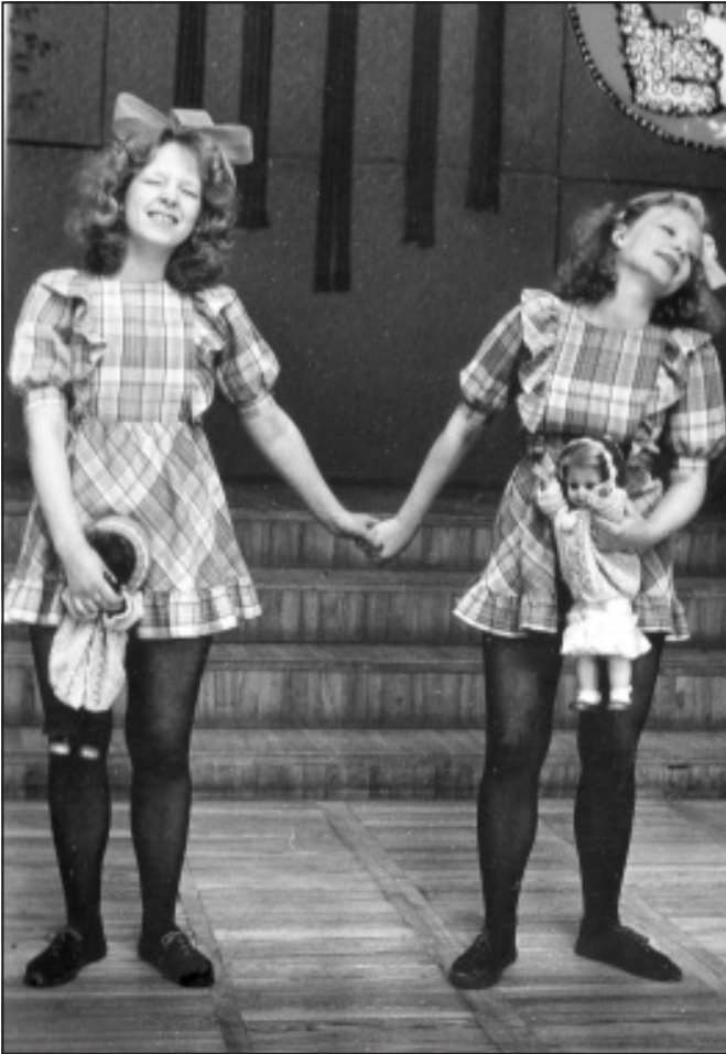
Cīku-caku, dzied māsas žetonvakarā