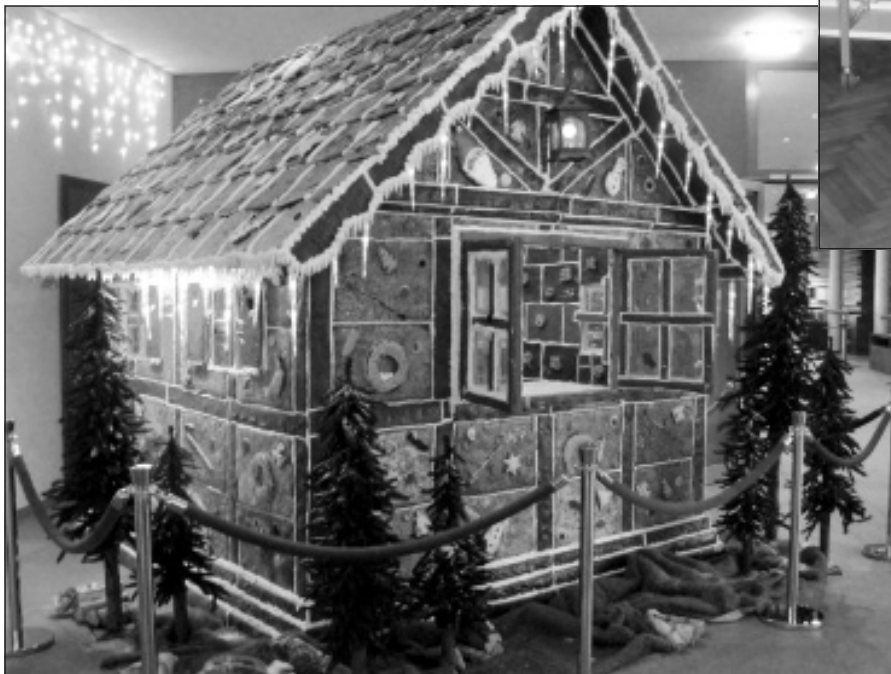
Pasaules lielākā piparkūku mājiņa