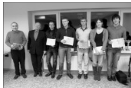
Labākie Mālpils domes kausā