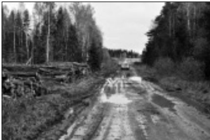
Mežizstrādātāji sabojā ceļus

Veiksmīgu Jauno gadu vēlot, Ilze Vanaga – Dinstmane