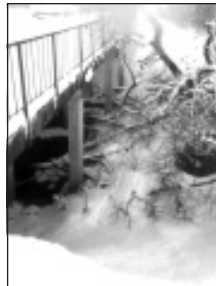
Zaru sanesumi pie tiltiem