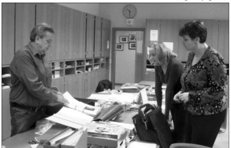
Iepazīstoties ar Poisdorfā pamatskolas darbu