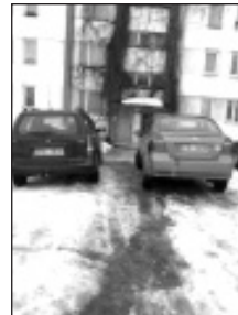
Sniega tīrīšana pie mājām