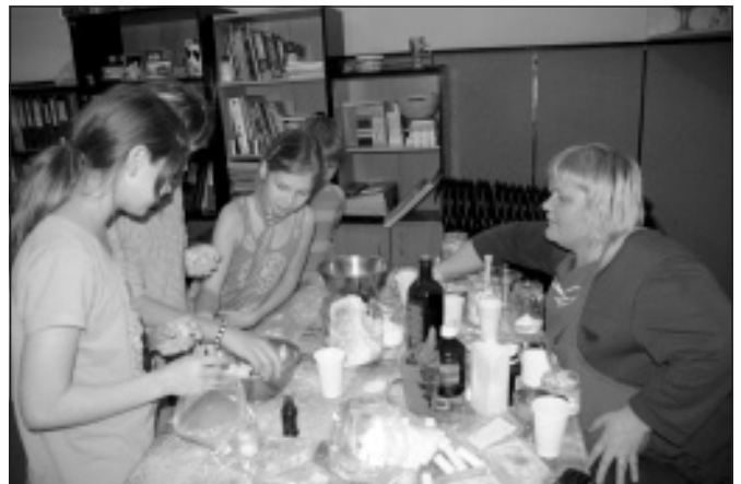
Lūpu balzāmu un smaržīgo vannas bumbu darbnīca