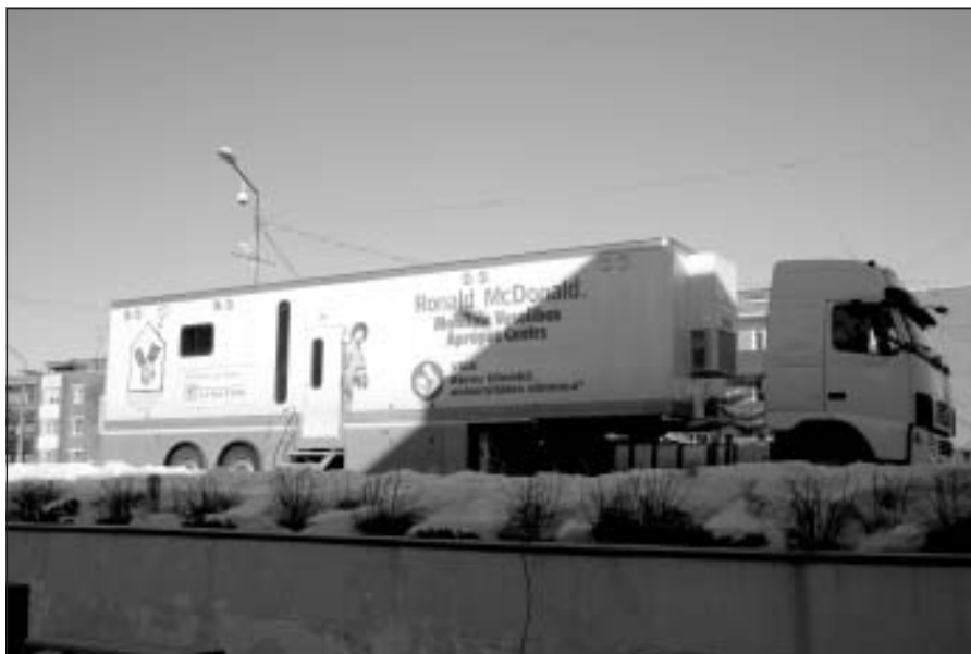
Ronald McDonald Mobilais aprūpes centrs Mālpilī

15. martā Mālpilī pie pašvaldības ēkas visu dienu bija atvērts Ronald McDonald Mobilais aprūpes centrs. Bērnu pieņēma acu ārsts un LORs. Nākamā aprūpes centra vizīte gaidāma maija sākumā, pieņems acu ārsts un neirologs. Vizīte pie ārstiem ir bezmaksas. Ja būs nepieciešamība, P/a "Mālpils sociālais dienests" sadarbībā ar ģimenes ārstiem var atkārtoti aicināt Mobilo centru atbraukt uz Mālpilī!