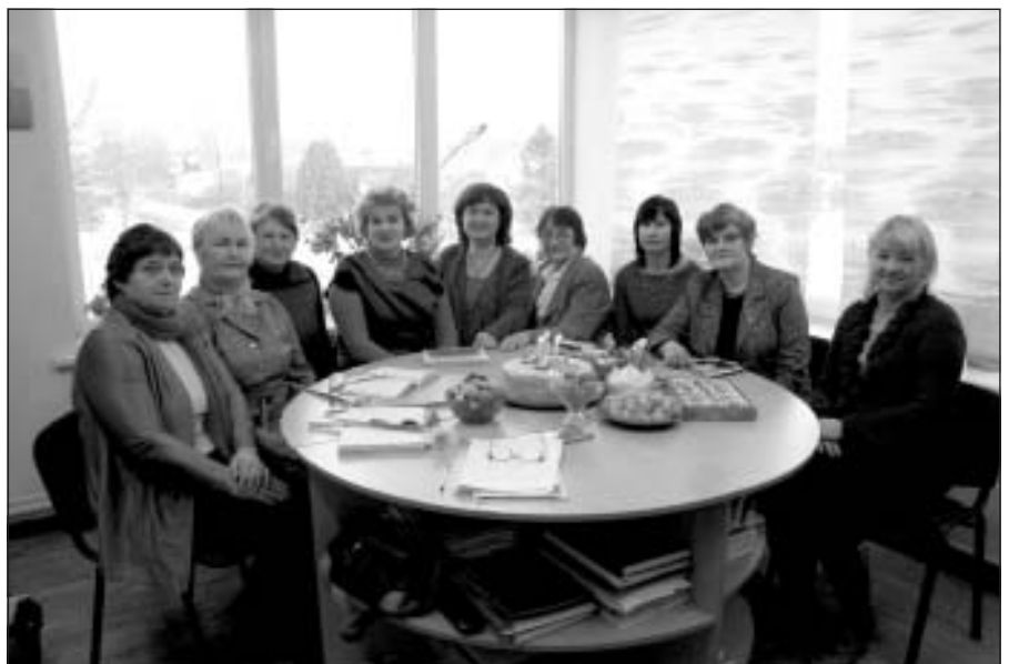
Vācu valodas klubiņa dalībnieces