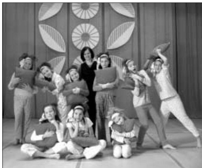
Deju grupa “Nakcītis” – deja “Miegā”

Katrs priekšnesums tika vērtēts pēc 25 punktu skalas: 10 punkti – dejas kompozīcija – horeogrāfiskās idejas oriģinalitāte, dejas ideja, stila izjūta, horeogrāfiskās leksikas atbilstība muzikālajam materiālam, tēls, zīmējumu maiņa, telpas izmantošana, kustību efekts, lakonisms, pārsteiguma efekts. 10 punkti – dejas tehniskais izpildījums – horeogrāfiskā teksta precizitāte, telpas izmantošana, muzikalitāte, dejas tēls, kolektīva kopiespāids (emocionalitāte, kolektīva kopizjūta, atraktivitāte, pievilcīgums), mākslinieciskais sniegums kopumā. 5 punkti – vizuālais efekts, tērpi, frizūra – “make up”, uznāciens, nobeigums un kontakts ar publiku, kustību