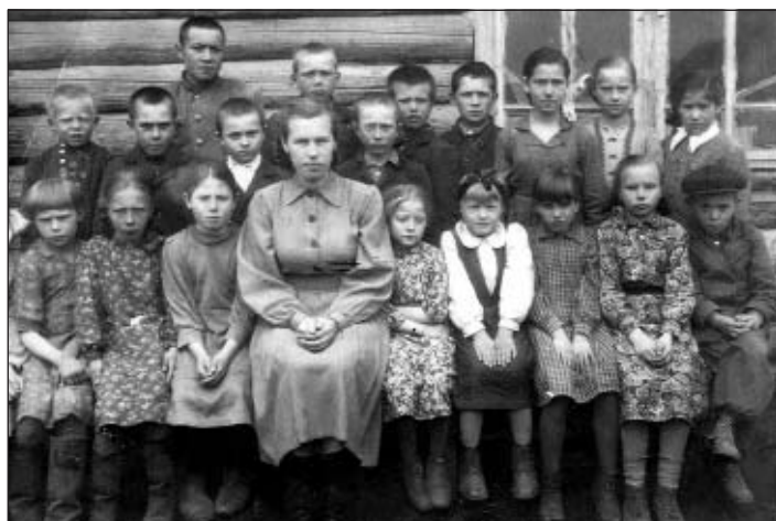
Sibīrijas skolā, 1951.g.