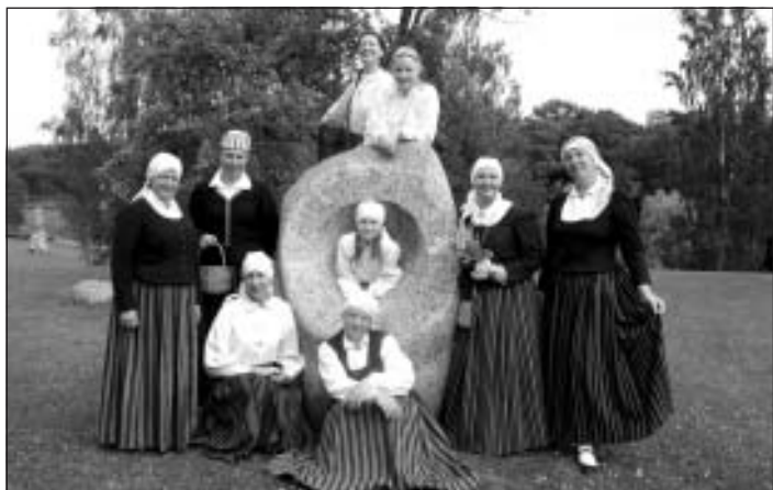
Folkloras kopa "Mālis"

No Mālpils kultūras centra pašdarbības kolektīviem notikumiem visbagātākā vasara bija folkloras kopai "MĀLIS", kura no 5. – 9. jūlijam piedalījās starptautiskajā folkloras festivālā "Baltica 2012" Rīgas un Siguldas pasākumos, no 13. – 15. jūlijam starptautiskajā folkloras festivālā Lietuvas pilsētā Klaipēdā un 18. augustā kopas