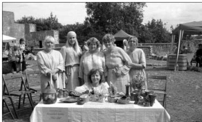
Keramikas studija "Māl-pils"

dalībniekiem pirmo reizi, bija iespēja piedalīties kāzu LĪDZINĀŠANAS rituālā mūsu pašu veidotajā kalnā – SAULES VĀRTI.