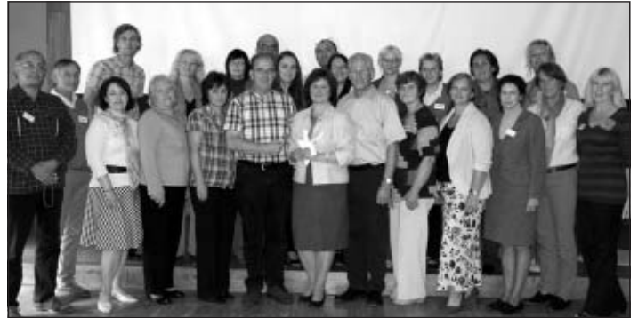
Mācību grupa kopā ar ārzemju viesiem

– Par projekta grupas cilvēkiem jāsaka, ka tie ir savējie – gan mālpilieši, gan bulgāri, slovēņi, vācieši, portugāļi. Ar jebkuru bija viegli kontaktēties un atkal bija izdevība atsvaidzināt svešvalodas prasmes.