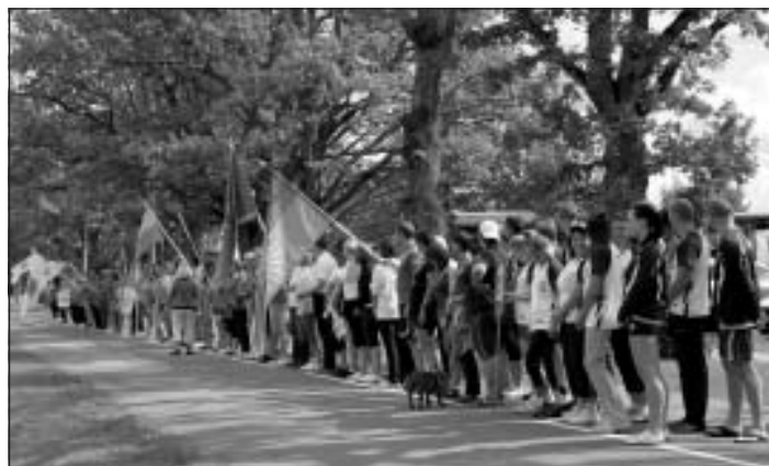
Sporta spēļu atklāšana

25.augustā , Mālpils pludmales volejbola laukumos, jau otro gadu notika pludmales volejbola sacensības „Mālpils pludmales karalis 2012”. Sacensības notika identiski Latvijā notikušajām sacensībām „King of the beach”, kurās pulcējās 8 labākie Latvijas pludmales volejbolisti. Mūsu gadījumā sacensībās pulcējās 8 labākie Mālpils pludmales volejbolisti pēc 3 posmu sacensību kopvērtējuma. Tātad, visi 8 dalībnieki tika salozēti 2 apakšgrupās, katrā pa 4 dalībniekiem. Apakšgrupu ietvaros tika izspēlētas 3 spēles, kurās dalībnieki mainījās ar partneriem. Tādējādi, tika