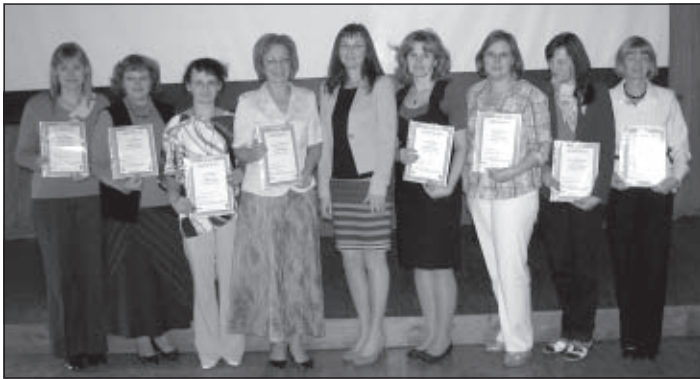
Saņemti pirmie sertifikāti

Sākoties jaunajam mācību gadam, jaunu intensitāti ir ieguvis projekts „Mālpils pašvaldības kapacitātes stiprināšana” (Vienošanās Nr. 1DP/1.5.2.2.3/11/APIA/SIF/063/95). Jau ir noslēgusies mācību tēmas „Lietišķā etiķete” apguve, pavisam nedaudz ir stundu ir palicis tēmai „Iepirkums”, bet 18.septembrī uzsāktas mācības par tēmu „ES fondu iespējas un izvēle”.