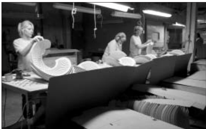
Mēbeļu detaļu apstrādes process

Es vēlētos, lai cilvēki vairāk uzņemtos atbildību, lai dotu no sevis pievienoto vērtību, mēs uz to ticamies. Mēs ejam uz skandināvu modeli, kur netiek skaitītas darba stundas, bet vērtē padarīto. Pārsvārā ražošanā visi saņem akordalgas, tas nozīmē, ja dienā tiek saražots vairāk detaļu, kā nosaka norma, tad darbiniekam tiek aprēķināta piemaksa pie algas. Mums ir svarīgi, lai mēs spētu noteiktā termiņā saražot tik, cik esam klientam apsolījuši. Aktuāls