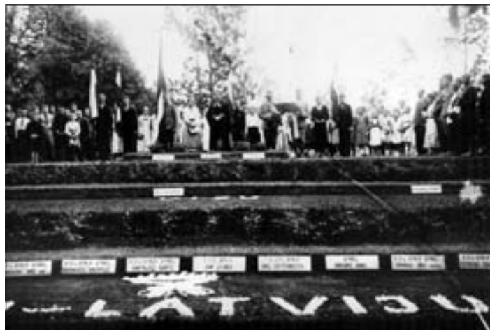
Mazpulku svinīgais mitiņš Mālpils Strēlnieku kapos, 1935. g.