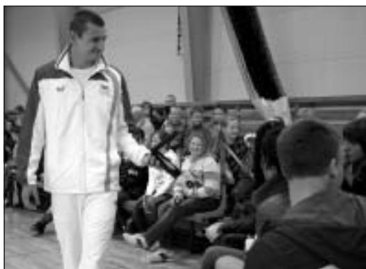
Mārtiņš Pļaviņš rāda jauniešiem savu Olimpisko bronzas medaļu