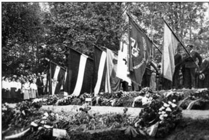
Klusuma brīdis Mālpils Strēlnieku kapos, 1930. g.

1919. gada 11. novembrī neatkarīgās Latvijas armija izcīnīja uzvaru pār Pāvela Bermonta – Avalova karaspēku, un tas tika padzīts no Rīgas. Bermontiāde ir ievērojama ar to, ka sākotnēji nelielā Latvijas valsts armija ar ierobežotiem resursiem spēja sakaut skaitliski daudz lielāko un labāk bruņoto Rietumu brīvprātīgo armiju. Kā galvenie uzvaras iemesli tiek minēti latviešu karavīru drosmē un varonīgums, kā arī sabiedroto sniegtais atbalsts Latvijai. Tikai pēc šīm asiņainajām cīņām, kurās krita daudzi mūsu tautas dēli, kļuva skaidrs, ka Latvijas valsts ir atguvusi un nostiprinājusi savu neatkarību.