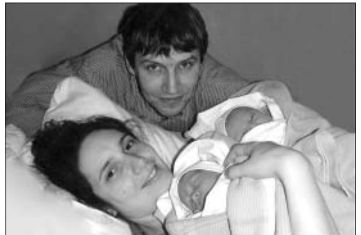
Lāču ģimenei lielisks papildinājums