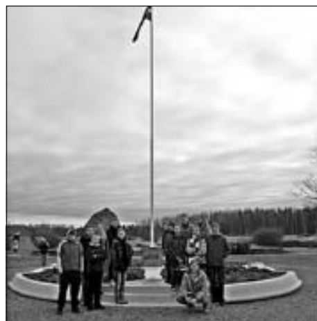
Tūrisma pulciņa dalībnieki O.Kalpaka dzimtajās mājās "Liepsalās"

Jauno sezonu uzsākuši skolas tūrisma pulciņa dalībnieki. Šoreiz ceļš veda uz Madonas novada Praulienu, kur risinājās pulkveža O.Kalpaka piemiņai un Lāčplēša dienai veltītais tūristu pārgājiens – sacensības. Satiekšanās norit Ošupes pagasta "Liepsalās" – pirmā Latvijas karaspēka vienības komandiera O.Kalpaka dzimtajās mājās.