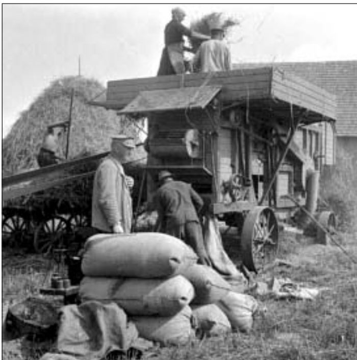
Pie kuļmašīnas 1938. g.

Bērniem ļoti interesantas likās kulšanas talkas. Kuļmašīnai divi zirgi bija aizjūgti priekšā, tai bija lieli, plati dzelzs riteņi un, kad zirgi to ievilka šķūnī, to darbināja ar dampi. Kad es biju pavisam maza, dampi darbināja ar malku. Vēlāk pie mums brauca Čida – kuļmašīnas "Imanta" īpašnieks. Mūsu mājā kuļmašīna brauca divas reizes gadā. Pie rudzu kulšanas tas bija īsi – rudzu mums bija maz un tad pa kādām trim, četrām stundām tos nokūla un aizbrauca tālāk. Kuriem vajadzēja strādāt pie dampja, tas viss tika ar kaimiņiem sarunāts. Kaimiņš kaimiņam gāja palīdzēt, kamēr visiem labība tika nokulta. Šajā darbā katram bija sadalīti savi pienākumi – bija iekšā laidēji, pelavu tantes, salmu tantes, maisu nesēji un vēl citi amati. Viss bija labi noorganizēts. Lielā kulšana notika tad, kad visa labība bija savesta šķūņos, izžuvusi un pārkaltusi, tikai tad nāca riktīgā kuļmašīna. Uz šo notikumu tika gatavotas lielas balles un ēšanas. Brūvēja īsto miežu alu un šajā lietā mana mamma bija īsts speciālists, viņa ārkārtīgi garšīgi mācēja to pagatavot. Kā tad tas tika darīts – sacēpa maizi krāsnī, cik tā gan bija garšīga un salda, kad mieži bija izaudzēti, izkaltēti un samalti! Kad maizi izcēpa, tāds liels koka kubuls bija, tad to ielika tajā, kur apakšā bija sakārtoti salmi, uz tiem uzlika maizi un lēja virsū vārošu ūdeni. Kādu laiku tas tā stāvēja. Baļļa bija apsegta, tai apakšā bija krāniņš, pa kuru tecināja ārā brūno iesaļu. Kā tas smaržoja un cik salds bija! Pēc