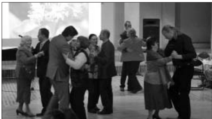
Jubilāres dejo ar Mālpils staltākajiem puisiem