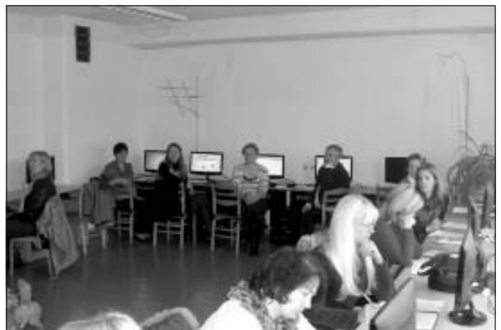
Projektu vadības nodarbības Mālpils vidusskolas datorklasē