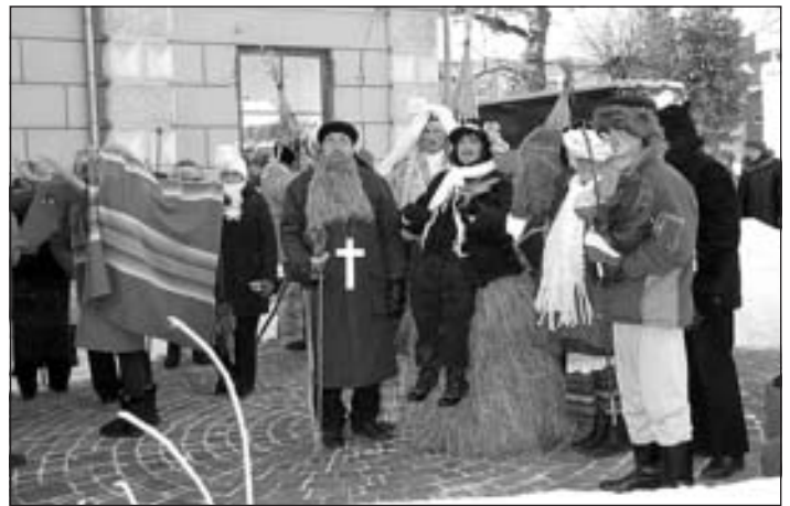
Čigāni. Brocēnu folkloras kopa "Virši"

21.gadsimts iezīmējas ar Starptautisko masku tradīciju festivālu norisēm dažādos Latvijas novados un pilsētās. Pateicoties pētnieku, kultūras dzīves organizatoru un maskotāju entuziastu sadarbībai aizvien vairāk atdzimst lokālām tradīcijām atbilstošas masku grupas. Pamazām atjaunojas bagātīgais maskošānās tradīciju pūrs, kas ietver sevī dažādos masku grupu nosaukumus, plašu un daudzpusīgu rituālo darbību spektru, dialektu daudzveidību un citas spilgtas un savdabīgas parādības.