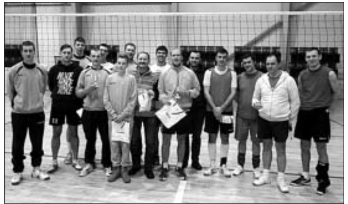
Mālpils sporta kluba kausa izcīņas volejbolā dalībnieki