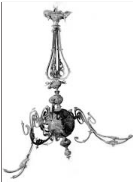
Pašlaik restaurācijā esošā lustra ar 18 spuldzēm

Mālpils ev.-lut. draudzes padome un biedrība "Idoves mantojums"