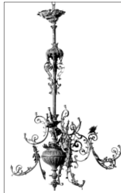
Lustra, kuras restaurācijai vēl nepieciešams finansējums, ar 30 spuldzēm