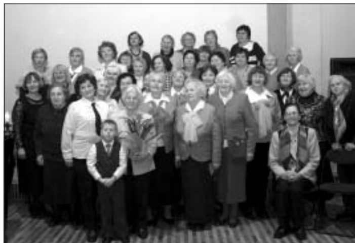
Klubiņa "Rezēdas" dalībnieces 2013. gada 12. janvārī