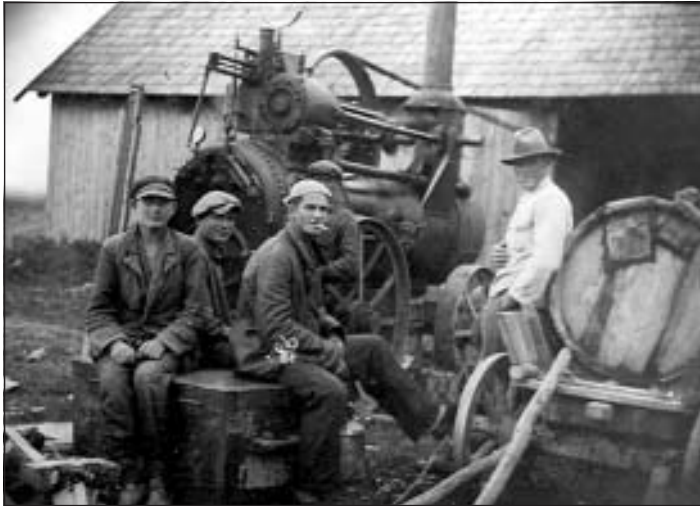
Labības kulšana 1936. g.