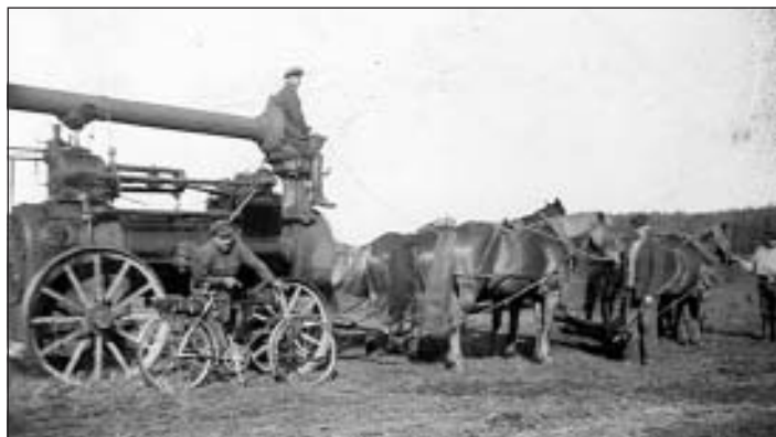
Rudzu kulšana 1936. g.