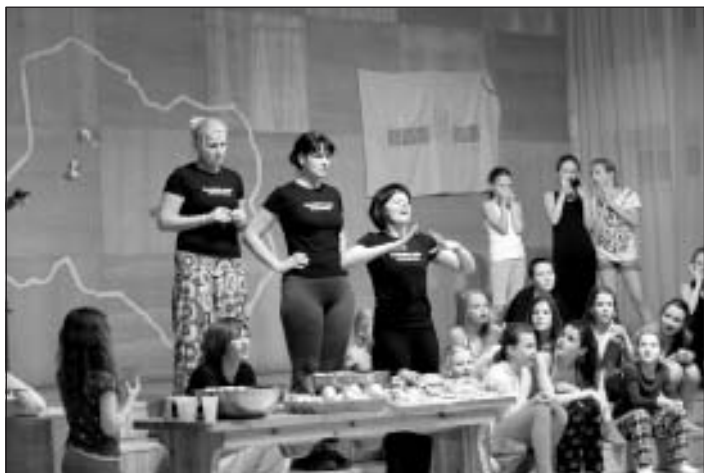
Solo deju sacensības

Visjaukākais bija tas, ka iemācījāmies jaunu deju "Nenāk miegs". Šo iespēju gaidījām jau visu vasaru. Vēl man patika ekskursija uz Mālpils muižu un Mālpils pienotavu. Pienotavā varēja nopirkt dažādus siera veidus. Iespaidīgi bija tas, ka mūsu istabiņa aizgāja gulēt tikai 4:30 naktī, kaut gan bija jāceļas jau 9:00 no rīta. Man vēl patika, ka varējām peldēties baseinā un kārtīgi izdancoties ballītē. Un pats galvenais – ieguvām jaunus draugus! Tas bija ļoti un interesanti pavadīts laiks.