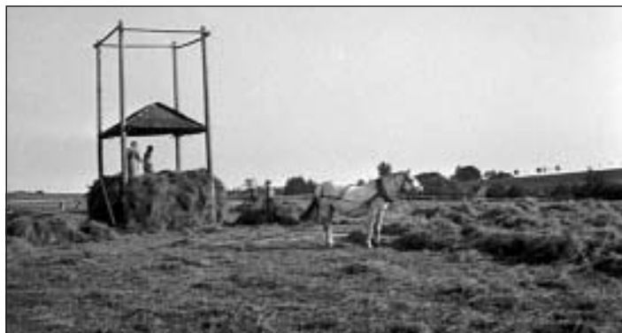
Siena talka 1938. g.