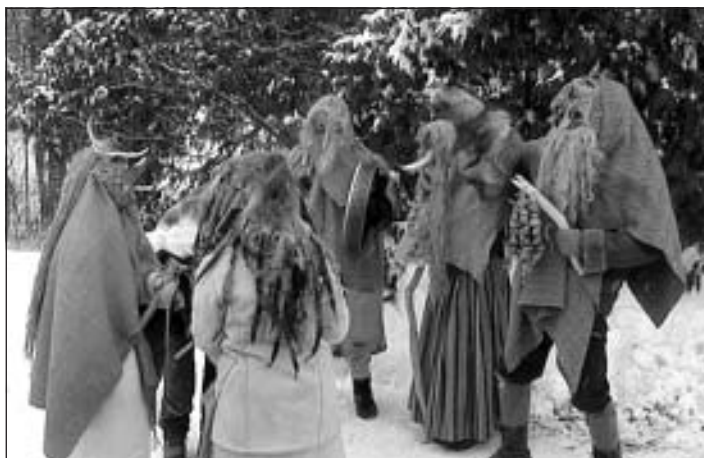
Vecīši. Vidrižu folkloras kopa "Delve"

ir trokšņošana, tāpēc maskotie ņēma no mājām līdz klabeķļus, žvadzekļus, katla vākus, spaiņus, lapstas un gājienu laikā taisīja lielu troksni. Vienas maskas vairāk dziedāja, citas dancoja, bet, piemēram, tādas grupas kā čigāni vai kaitas izrādīja dažādas izrādes – čigānu kāzas, kristības, tiesa vai citas. Visās šajās izdarībās caurvijās viena ideja vecais nomirst un piedzimst jaunais.