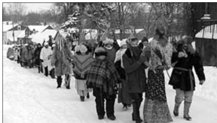
Lielais masku gājiens Viesītē 2011. gadā