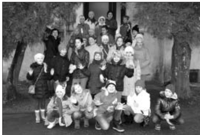
Mālpils un Ķekavas dejotāji apmeklē Mālpils pienotavu