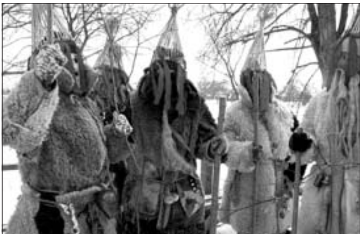
Budēļi. Rīgas folkloras kopa "Grodī"

19.gadsimta beigās Latvijā iezīmē sarežģītu sociāli ekonomiskās dzīves pārmaiņu sākumu, kas saistītas ar tradicionālā dzīvesveida pakāpenisku izzušanu. Cilvēku apziņā masku gājieni pakāpeniski zaudēja savas reliģiski rituālās funkcijas, priekšplānā izvirzot ieražas izklaides raksturu. Neskatoties uz pārmaiņām sabiedrības dzīvē, šur tur Latvijas novados vēl notika maskošānās. Savukārt pagājušā gadsimta beigās liels nopelns masku tradīciju atdzimšanā bija folkloras kustībai. Folkloras kopas iekļāva savā repertuārā arī maskošānās programmas un ar tām piedalījās dažādos pasākumos, it sevišķi Mārtiņu, Ziemassvētku un Meteņu laikā.