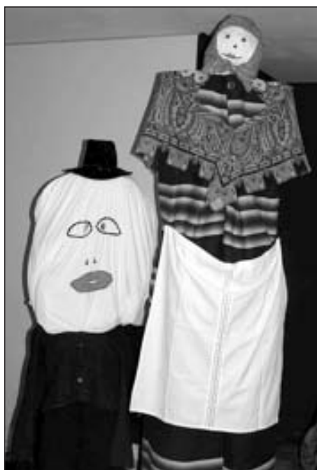
Garā sieva un Mazais vīriņš. Mālpils folkloras kopa "Mālis"