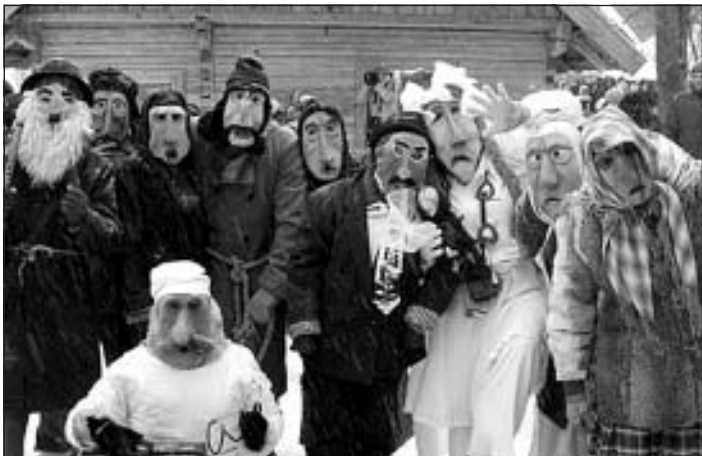
Masku kāzas. Šauļu folkloras kopa "Salduve"

Maskas, maskošānās tradīcijas, ar maskām saistītie rituāli un ieražas ir vienas no visnoslēpumainākajām un interesantākajām parādībām pasaules tautu reliģijās un kultūrās. Maskās materializējas senču gars. Tās ir "logs uz citu pasauli", kas ļauj nākt saskarē ar saviem senčiem, bet ar viņu palīdzību jau ar "augstākiem spēkiem". Maskošānās mērķis ir viens – palīdzēt cilvēkam. Pasaules tautu kultūrās tās tiek izmantotas visos svarīgākajos cilvēka dzīves brīžos – bērna dzimšanā, pilngadības sasniegšanā, kāzās, bērēs. Ar maskām aizsargā savu māju no slimībām, ļauniem gariem, nelaimēm. Ar maskām dziedē. Ar maskām nodrošina auglību un ražu nākamajam gadam, veiksmi medībās. Ar masku šamanis gatavo bungas. Visbeidzot maskas izmanto Pirmmātes atjaunošanas rituālā. Tas ir Rituāls visas mūsu tautas dzīvības un radošo spēku saglabāšanai un atjaunotnei.