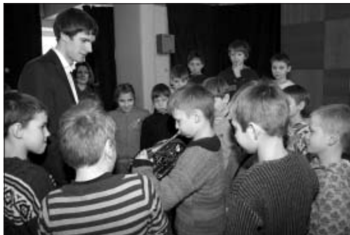
Pamēģināt spēlēt flautu un mežragu noteikti ir kas īpašs!