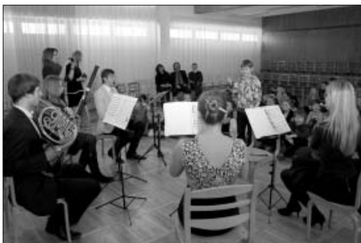
Bērni varēja iejusties diriģenta lomā