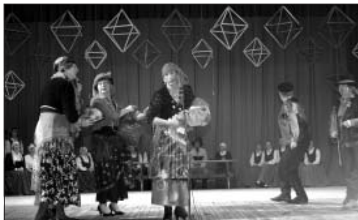
Kāzu čigāni, "Sidgundietes"