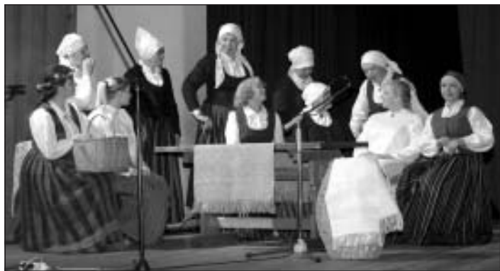
Līgavas mājās pošas kāzām, folkloras kopa "Mālis"