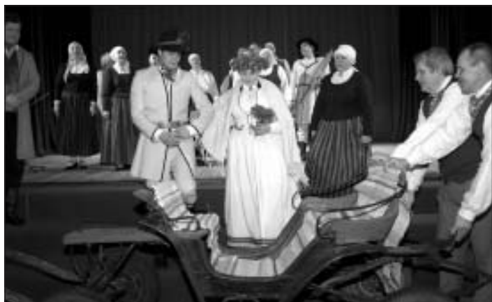
Jauno pāri ved uz līdzināšanu