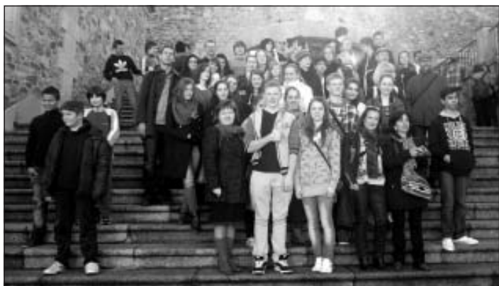
Comenius projekta "Leģendas mūs vieno" dalībnieki