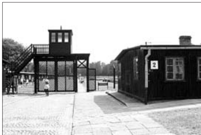
Ieeja Štuthofas nāves nometnē