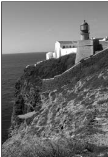
Eiropas tālākajā Rietumu punktā