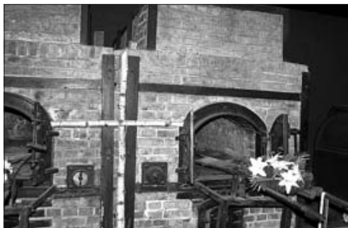
Krematorijas krāsnis Štuthofas nāves nometnē

vilka piekabi. Gāja gar barakām un tad tos līķus meta iekšā. Citi meta, bet tie astoņi cilvēki tik vilka. Un polis ar milzīgu pātāgu un steku tam, kurš nevilka, gāza. To katru rītu redzējām. Katru rītu savāca līķus. Ziemā nebija vairs kur tos likt, veda uz krematoriju dedzināt, bet tik daudz to mirušo ķermeņu bija, ka krematorija nodega. Nespēja vairs nokurināt visus, un tagad nu tie krājās kaudzēs. Tur no cilvēka bija tikai ģindenis, mati un pergaments. Nāca pavasaris, vajadzēja visu likvidēt, vācieši pielaida līķu kaudzei uguni, tie apsvila un nosmirdēja, bet nedega, neviens nedega, saproti?