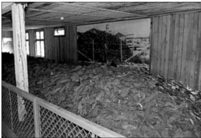
Nogalināto cilvēku apavu kaudzes

ēst, maize bija tik maz, ka nebija ko iesākt. Kā kurš darīja – cits sūkāja, cits nolika rītdienai, cits ne. Starp mums bija visādas tautības, bet dzīvojam ļoti satīcīgi, nevienam nekas nebija jādala.