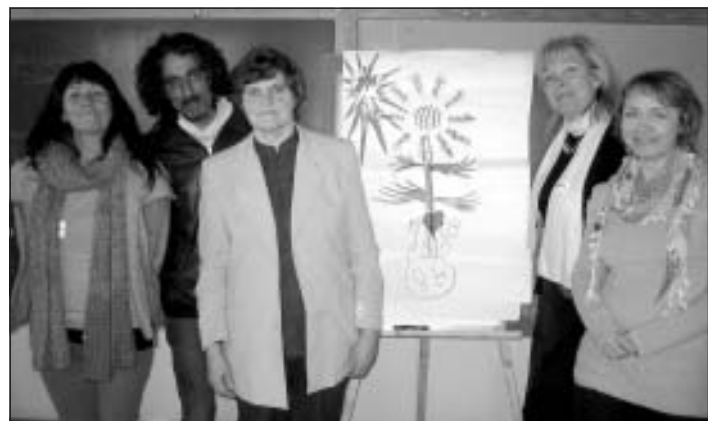
Grupu darba prezentācija