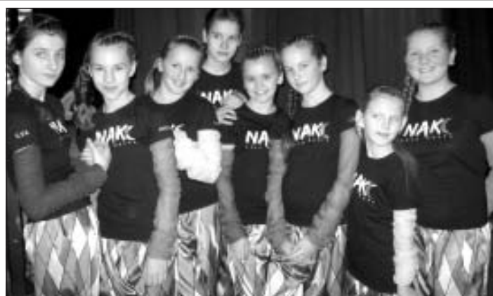
Deju grupa "Nakc"