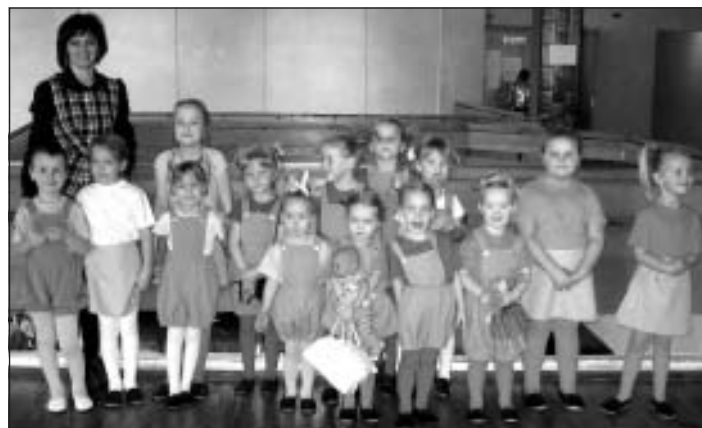
Deju grupa "Nakcītis"