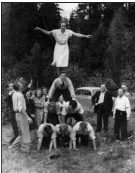
Piramīda upmalā 1954.g.

draudu padoma. Dišreits pierunāja palikt "Briežos" fermā par slaucēju. Abas ar mammu kopām desmit govīs. Toreiz visus darbus vajadzēja izdarīt slaucējām. Braucu pļaut vīkus uz "Brūnām", sēju runkuļus, vedu mēslus. Naktīs tirpa rokas, mērcēju tās aukstā ūdenī, bet aiz sāpēm gulēt nevarēju. Pienāca algas diena – saņēmu 30 rubļus. Dišreits gan solīja, ka ar laiku būšot vairāk, bet es nenoticēju. Draugu pierunāta aizbraucu atpakaļ uz Rīgu. Auklīte pieskatīja puikas, un es sāku strādāt savu ierasto darbu. Tas bija 1958.gada rudens.