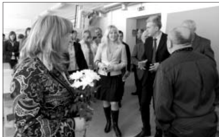
Ciemiņi iepazīstas ar skolas materiālo bāzi