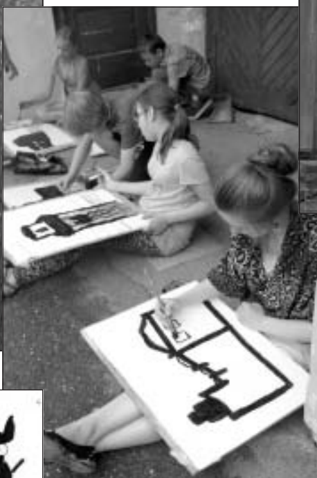
Prakses diena Siguldā