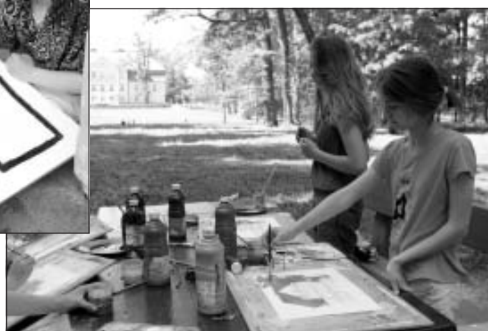
Prakses diena Mālpilī pie muižas