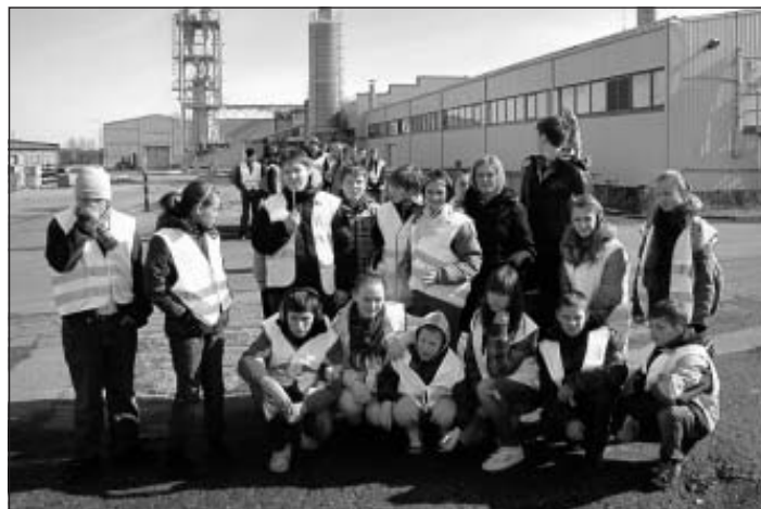
Mālpils internātpamatskolas 6. klase