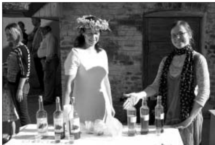
Šogad pirmo reizi 19. jūnijā Jāņu ielīgošana, lielā vainaga pišana un Zāļu tirdziņš ar vietējo mājražotāju labumiem notika Mālpils centrālajā gājēju ielā