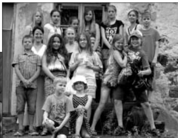
Prakses diena Sidgundas "Mālkrogā"