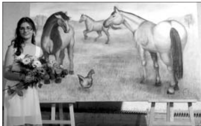
Elīna Tarakanova un viņas diplomdarbs