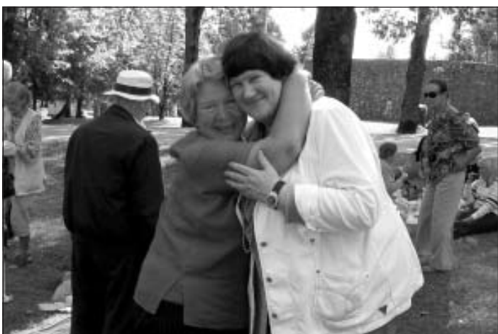
Salidojums ir vieta, kur represētie var satikt savus draugus un izsūtījuma biedrus, dziedāt dziesmas, baudīt līdzīgi paņemtos gardumus zaļā plāvā un izdejoties zaļumballē