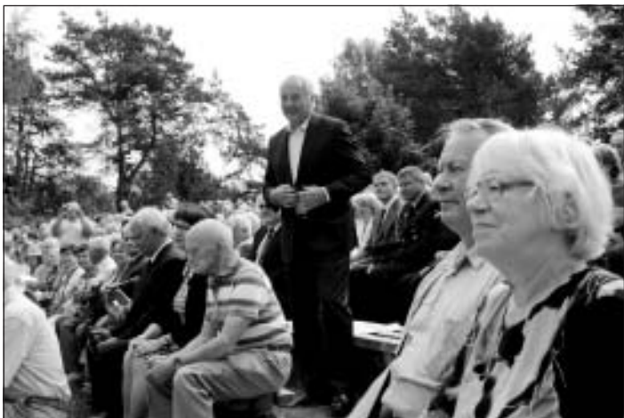
Valsts prezidents politiski represēto vidū