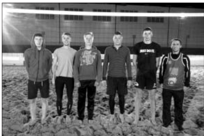
Pludmales volejbola čempionāta nakts turnīrs