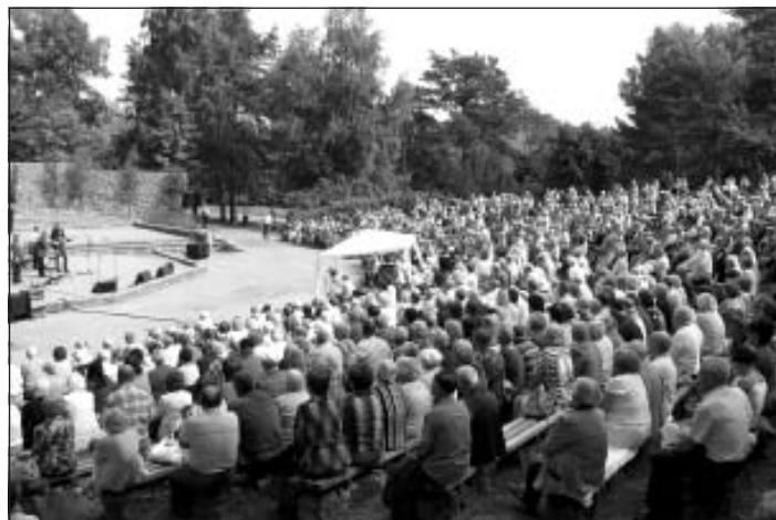
Pēc oficiālās daļas, kopā ar Valsts prezidentu visi klausījās dzīvespriecīgo "Labvēlīgā tipa" koncertu