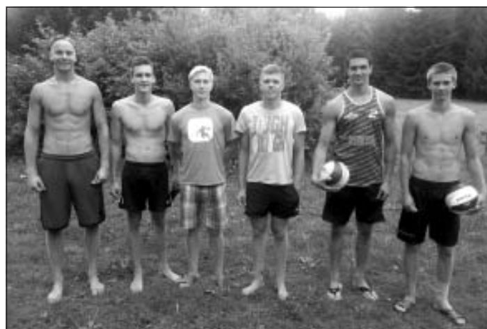
Pludmales volejbola čempionāta 4. posms