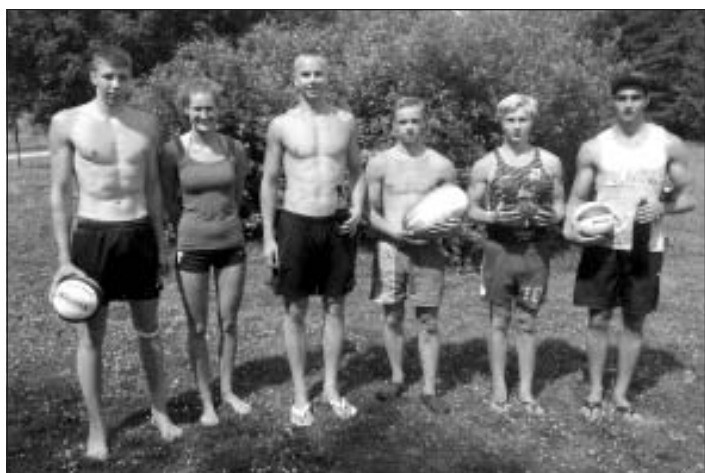
Pludmales volejbola čempionāta 2. posms