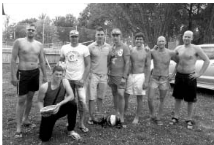
Pludmales volejbola čempionāta 3. posms