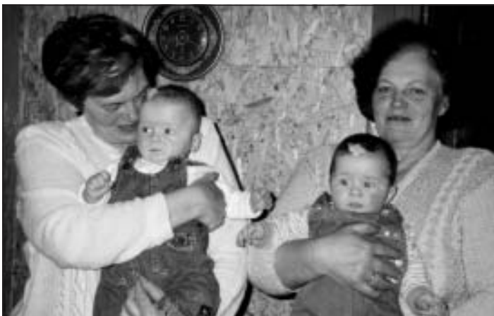
Interesanti – tēta mammai arī ir dvīņu māsa