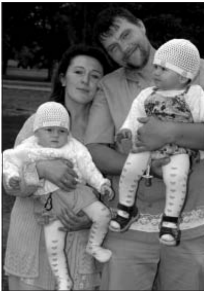
Vēršu ģimenes bilde