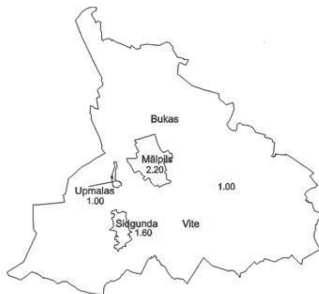
Mālpils novada dzīvojamo māju apbūves vērtību zonas 2014. gadam, individuālās apbūves zemes bāzes vērtības Ls/m 2

Kaut arī kādā teritorijā vai īpašumu grupā bāzes vērtības nav mainījušas, tomēr kadastrālās vērtības var mainīties, ja notikušas izmaiņas objektu datos (piemēram, pašvaldība mainījusi zemes lietošanas mērķi, reģistrēti jauni apgrūtinājumi). Ja Kadastra informācijas sistēmā reģistrētie dati neatbilst īpašuma patiesajam stāvoklim dabā, tad īpašnieku pienākums ir ierosināt datu aktualizāciju, ko paredz Nekustamā īpašuma valsts kadastra likuma 13. pants.