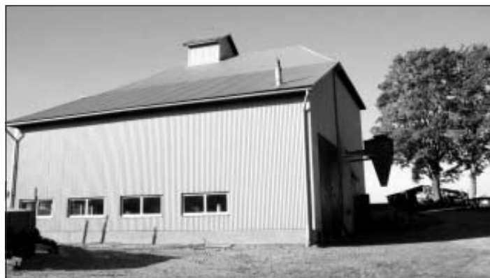
Tehnikas darbnīca, graudu pirmapstrādes punkts