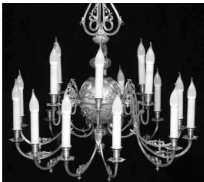
Atjaunotā Mālpils baznīcas lustra ar elektrificētiem gaismekļiem, bez kristālstikla piekariņiem un viena no trim lustrām Mālpils baznīcā 20. gs. 20. – 30. gados

Bankas konts ziedojumiem: Biedrība „Idoves mantojums” (sabiedriskā labuma organizācija), Reģ. Nr. 40008119825 SEB banka: LV57 UNLA 0050 0172 8648 6 (ar norādi „Mālpils baznīcas lustrai”)