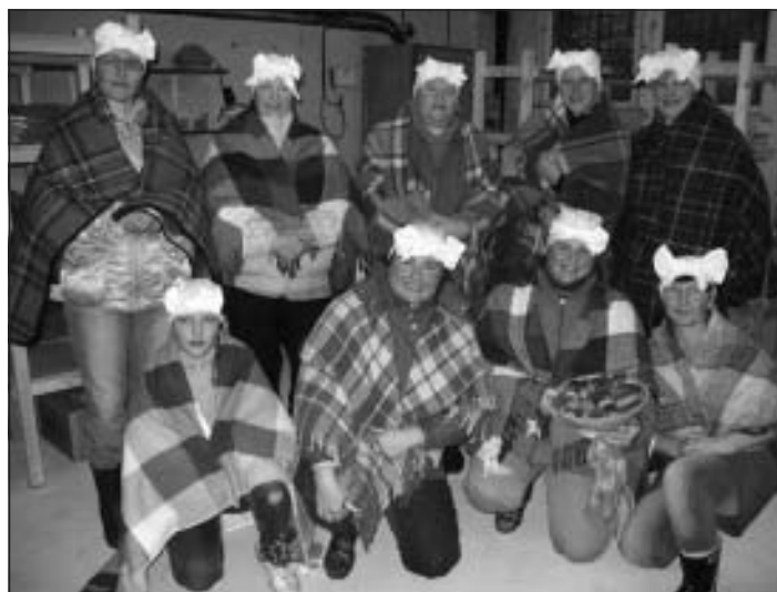
Ejam ciemos pie folkloras kopas "Mālis"!