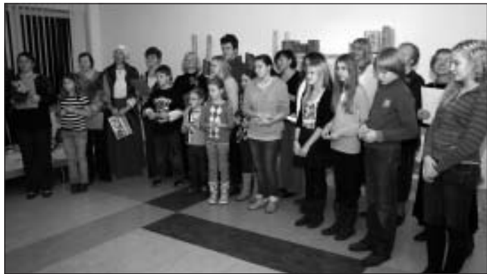
Keramikas studijas “MĀL-PILS” dalībnieki 5 darba gadu jubilejas izstādes atklāšanā 2013. gada 1. decembrī