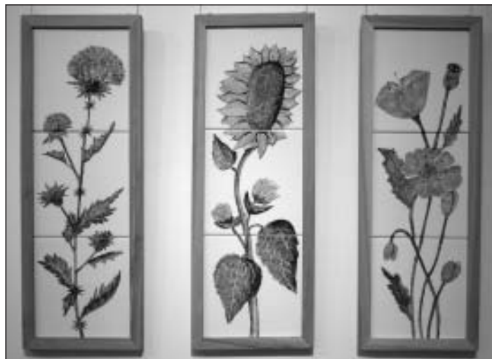
Autors Ināra Bahmane