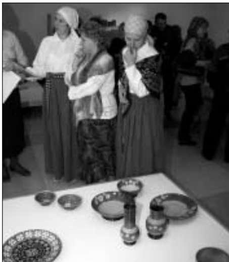
Keramikas studijas 5 darba gadu jubilejas izstādes atklāšanā 2013. gada 1. decembrī

Bet, tā mums dzīvojoties pa pagraba stāvu, vienmēr līdzās ir cilvēki, kuri ļoti daudz jau ir palīdzējuši un turpina to darīt gan tiešāk, gan netiešāk un no kuriem saņemam milzīgu atbalstu, tāpēc mūsu PALDIES – Novada domei, visiem kultūras centra