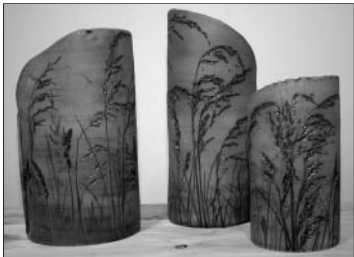
Autors Jolanta Kļaviņa