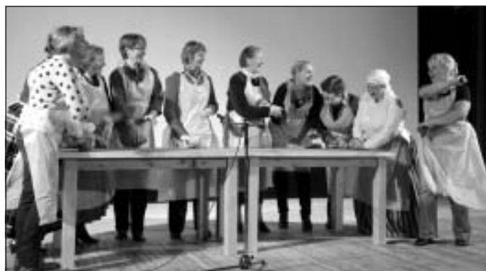
Studijas dalībnieces Nīderlandes projekta noslēgumā

Keramika nav no vieglākajiem amatieriem, varētu pat teikt mazliet ķēpīgs, darbi visu laiku kā mazi bērniņi pieskatāmi, ir lietas ko nedrīkst sasteigt un ir lietas ko nedrīkst nokavēt, un reizēm gadās, ka gala rezultāts nemaz neatbilst iecerētajam, jo pēdējo vārdu pasaka uguns un augstajās temperatūrās ne visi procesi ir paredzami. Un tieši tāpēc visvairāk apbrīnas vērti ir tie cilvēki, kuri nemaz nav keramiķi, bet kuriem kaut kādu iemeslu dēļ māli kļuvuši pat par zināmu dzīves sastāvdaļu. Un, lūk, kādi viņi: