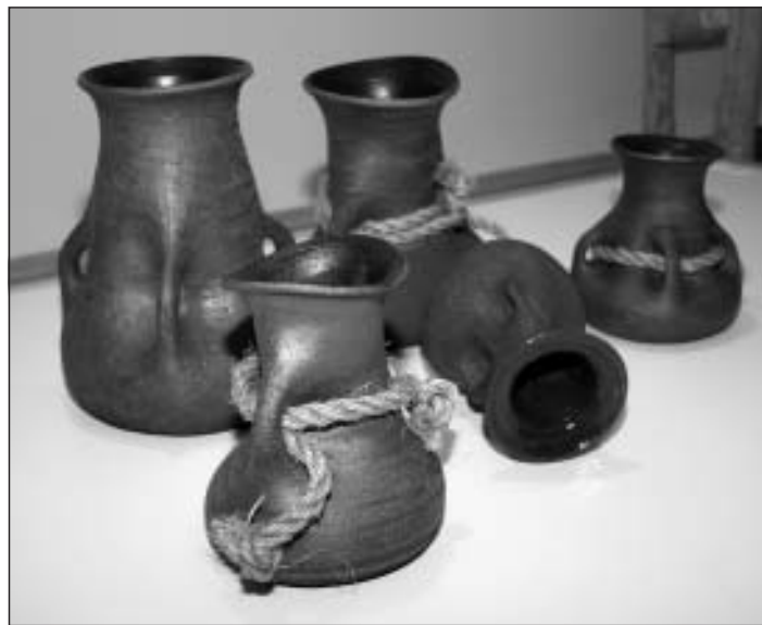
Autors Elīta Mīeze