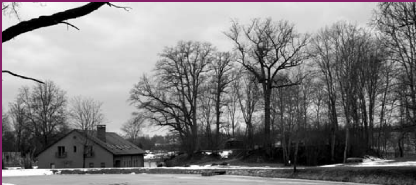
Mālpils novada kultūrvēsturiskās vietas – Mālpils pilskalns (Vīnkalns, 1. g. t. beigas – 2. g. t. sākums)