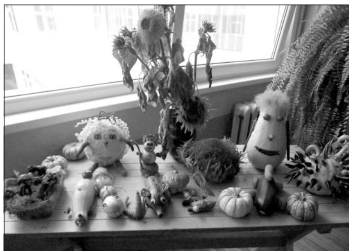
Skolēnu veidotās dārzeņu kompozīcijas