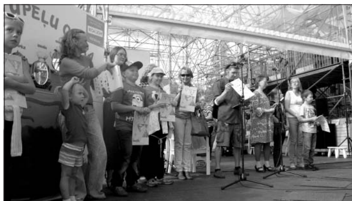
Kartupeļu brālības Ražas svētkos