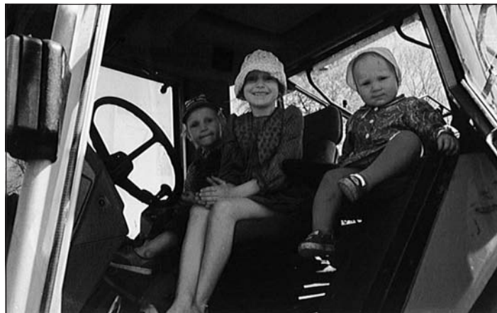
Juniori 1997. gadā