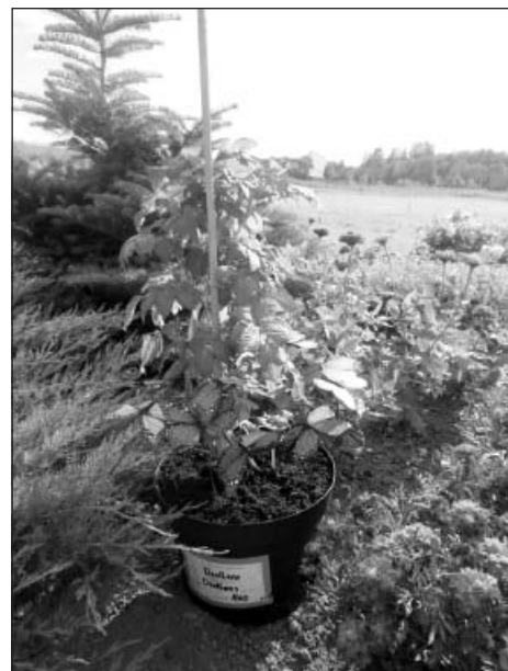
Kartupelis pilnā plaukumā vasaras vidū

Kartupeļa Dzeltenis draugi – sākām kā trešklasnieki, beidzām kā ceturtnieki Mālpils novada vidusskolā