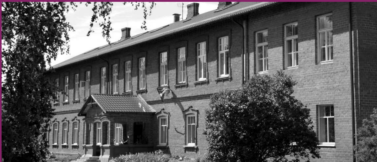
Mālpils novada kultūrvēsturiskās vietas – Mālpils novada vidusskolas Sīdgundas filiāles ēka (būvēta 1876./1877. g.), foto I. Brencis