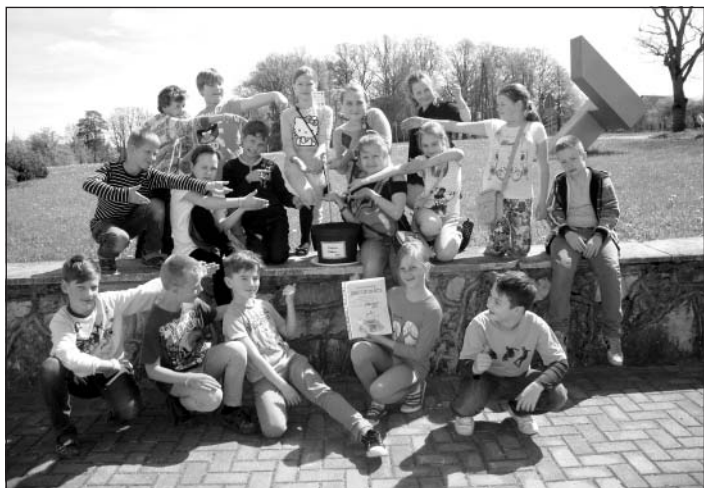
16. maijs – Dzeltenis pirmo dienu skolā