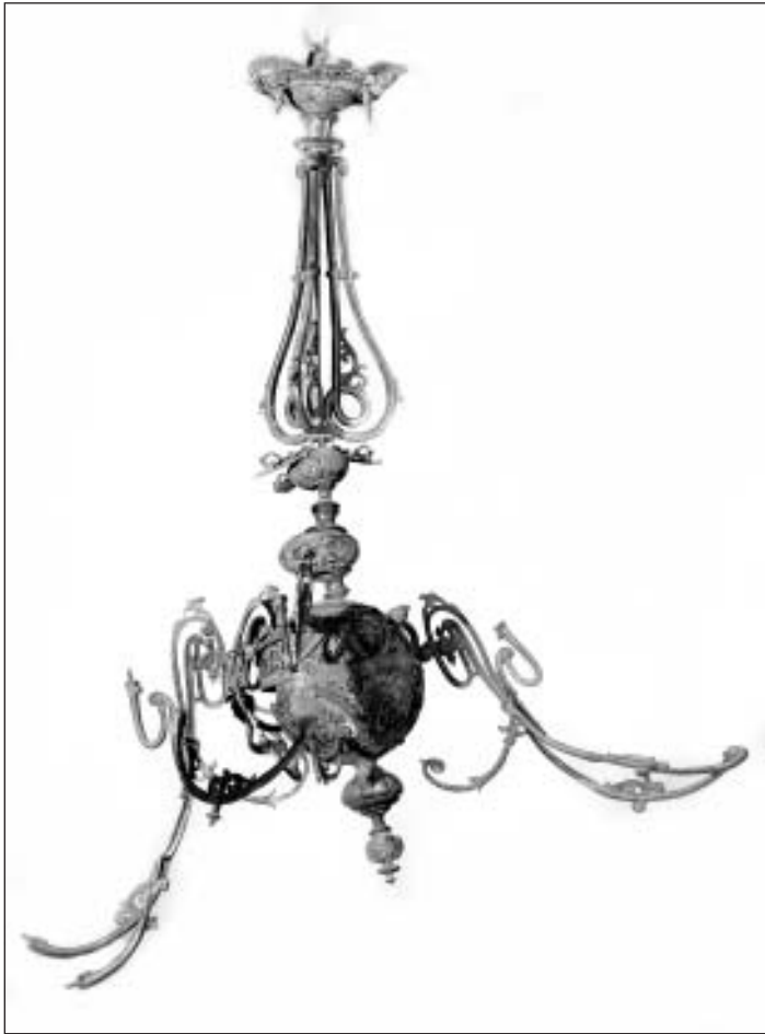
Pirmā bronzas lustra pirms restaurācijas, 2012