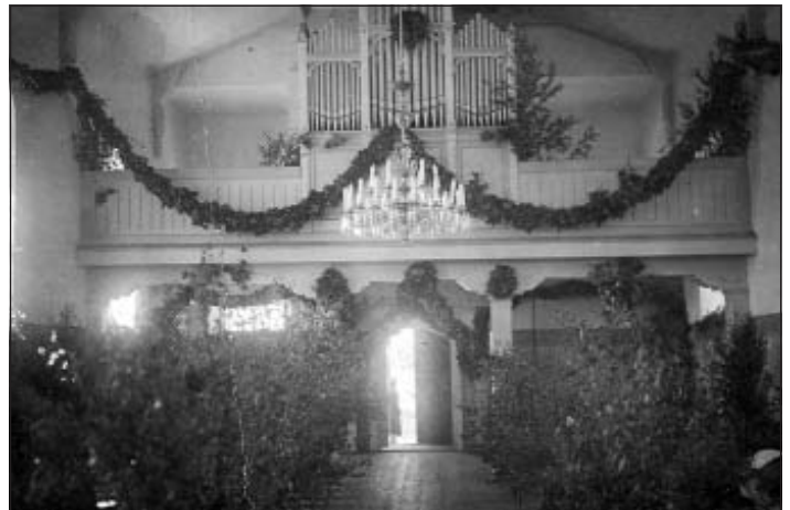
Otrā lustra 20. gs. 20. – 30. gados

2013. gada sākumā tika restaurēta viena no trim vēsturiskajām Mālpils luterāņu baznīcas bronzas lustrām, ar elektrificētiem gaismekļiem un jauniem kristālstikla piekariņiem.