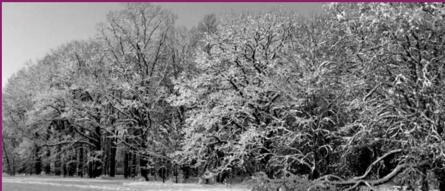
Mālpils novada kultūrvēsturiskās vietas – Mālpils muižas parks.