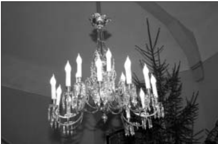
Pēc restaurācijas, 2013. gada nogalē