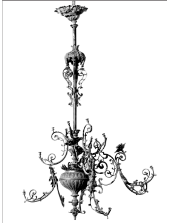
Otrā lustra, ko restaurēs 2015. gadā