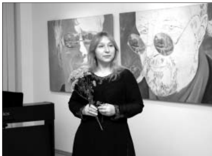
Leva Muzikante izstādes atklāšanā