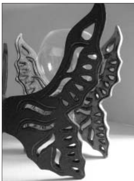
Kristīnes Kaņepējas darba "Naktstauriņi" fragments