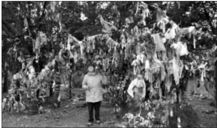
Pie vēlmju koka

kurš ved par 12 lariem (citiem jāsaķē, ka maksājām 15). "Jūs ved tīrasīņu gruzīns", viņš lepnī saka. Klosteris atrodas kalnā starp Mtkvari un Aragvas upi. To savā poēmā "Mcirī" apdziedājis arī Ļermontovs. Klosteris 6. gs. uzcelts vietā, kur 4. gs. uzstādīts kristietības nesējam Nino veltīts milzīgs koka krusts. Krusta pamatne klostera vidū saglabājusies vēl arvien. Arī mūri dveš senatni un svētumu. Tādā vietā īpaša sajūta pārņem pat ne pārāk reliģiozu cilvēku – bijība un svētvinīgums. No klostera mūka nopērku un nolieku divas svečītes – vienu par jauniešu tālāko ceļu un otru par vēl kādu lielu vēlēšanos.