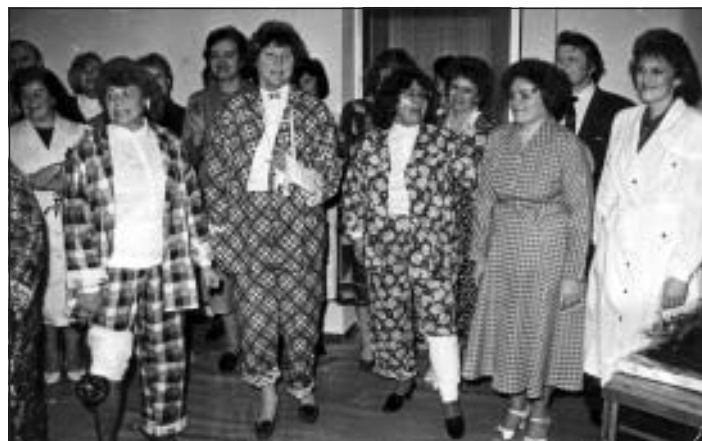
Ansamblis "Sidgundietes" uzstājas ar oriģināliem tērpiem un speciāli sagatavotu programmu Mālpils jaunās poliklīnikas atklāšanā, 1990. gads

Savas 25 un 35 gadu jubilejas ansamblis vēl svinēja Sidgundas jaunajā kultūras namā, kuru uzcēla 1973. gadā. Bet drīz pēc Mālpils kultūras nama atklāšanas 1988. gadā vairāki Sidgundas kultūras nama darbinieki pārnāca strādāt uz Mālpili, un arī ansambļa darbībā iestājās pauze.