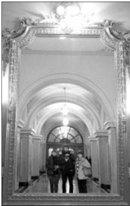
Rustavelli teātra spoguļi