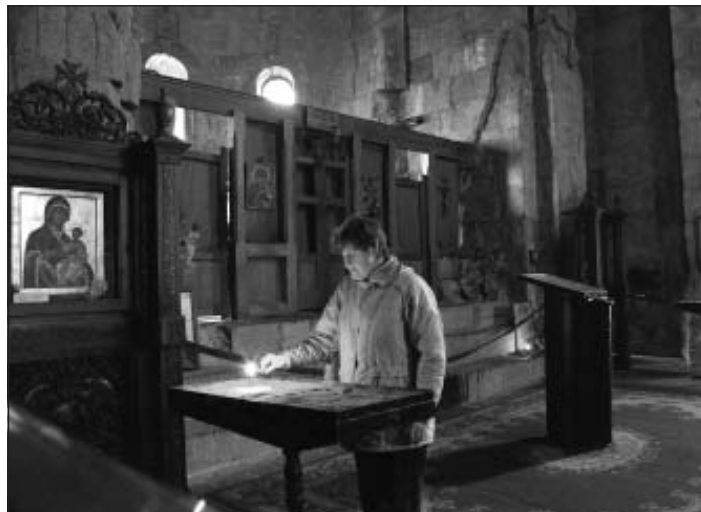
Džvari klostera baznīcā