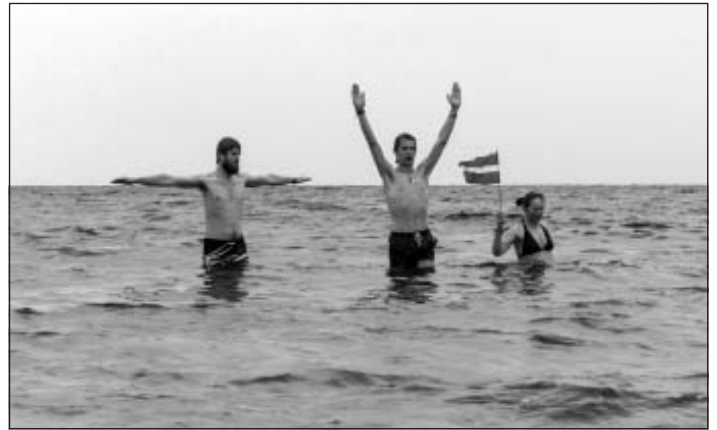
Pelde ar Latvijas karogu Melnajā jūrā par godu Lāčplēša dienai, 2014. gada 11. novembris

Krimā no jauna lielu pārsteigumu sagādāja cilvēku dažādie uzskati – no prieka par pievienošanu Krievijai līdz pilnīgi pretējam viedoklim. Pēc vietējo uzskatiem, ja būtu notikusi īsta balsošana, ap 40% balsu varētu būt bijušas arī pret. Krievijā daudzpilsonība nav nekas neierasts un cilvēkiem Krimā pašlaik, lai legāli iegūtu kaut vai mobilā telefona numuru, jābūt pierakstam un pasei. Taču sastapām arī cilvēkus, kas ilgojas pēc radniekiem, draugiem Ukrainā un divpilsonība viņu problēmu nebija atrisinājusi. Ar Ukrainas pasi baidās ie braukt valstī, jo nevēlas karot, bet ja dotos kā Krievijas pilsonis, tiktu uzskatīts par separātistu.