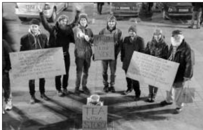
Kampaņa "Tēja ar stāstu"

Sarīkojām arī publisku bilžu un stāstu vakaru "Europe House Georgia" telpās, kur parādījām un pastāstījām interesentiem par mūsu ceļojumu līdz šim. Pasākums izdevās, piedalījās arī citi līdzīgu piedzīvojumu