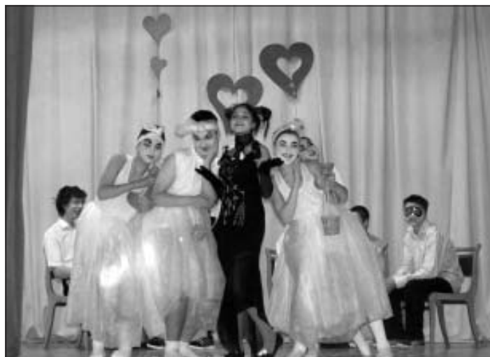
8. klase un 1. kurss savā priekšnesumā